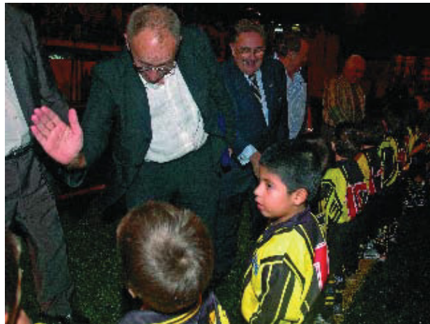
Presentació dels equips del Club Futbol Montañesa.

La Generalitat de Catalunya destina 10 milions d'euros a subvencionar la instal·lació de gespa artificial a cent camps esportius de Catalunya per millorar les condicions de la pràctica esportiva i optimitzar la utilització d'aquests espais. Aquesta primera etapa del Pla Director, que finalitzarà el 2008, beneficiarà uns 100.000 usuaris a tot el territori. El Camp Municipal de Futbol de Nou Barris, que és un del beneficiaris d'aquesta subvenció, gaudeix d'una gespa artificial molt