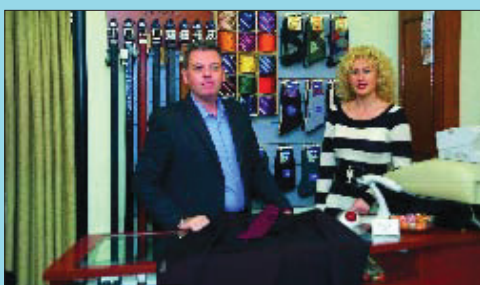
Segons els propietaris, cada vegada es fan menys vestits a mida.