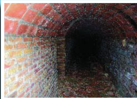
Interior del refugi 647 al carrer Cornudella.

Si té fotografies o documents del seu barri, en pot fer donació a l'Arxiu Municipal del Districte, 93 291 68 36