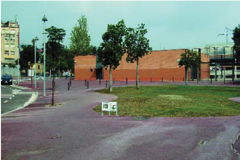
Nous espais més aptes per a passejar.

Els nous espais pretenen dignificar la zona fent-la més accessible, oberta i apta com a lloc de passeig. Les actuacions inclouen més zona verda i enllumenat i mobiliari urbà nous