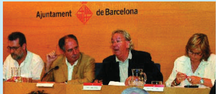
Un moment del ple del districte.