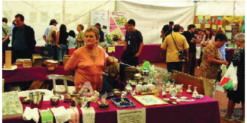
Mostra d'entitats de la Zona Nord el mes d'octubre.