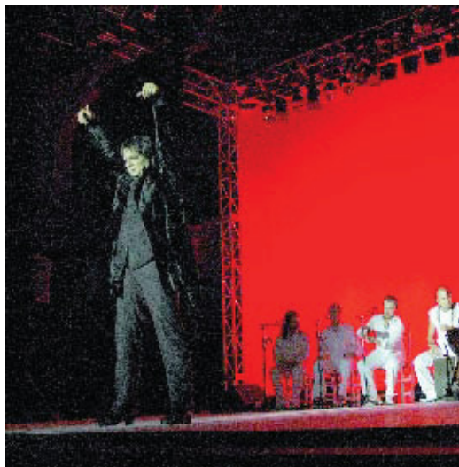
Un moment de l'actuació d'Antonio Canales.

P arlar de la Festa Major de Nou Barris és parlar també del Festival de Flamenc, el qual va comptar amb el bailaor Antonio Canales com a figura més popular i mediàtica. Canales va oferir divendres 19 una actuació carregada de força i sentiment que no va decebre cap dels nombrosos assistents al pati de la seu del Districte. Acompanyat per uns efectius Oscar de los Reyes i Adela Campallo, l'artista va rebre una bona mostra de suport al seu darrer espectacle d'explícit títol "Bailaor". Al mateix temps, el Centre Cívic Les Basses acollia el Festival Propostes, a càrrec del col·lectiu FEA. O el que és el mateix: tecno-pop i electro per ballar i suar fins a altes hores de la matinada amb propostes de Barcelona (Tannhauser, Lorenna C o Ultraplayback), Madrid i Alemanya. La segona jornada del Festival Propostes, a càrrec dels col·lectius Minifestival de Música Independent, Septiembre Recuerdos i Laboratori Musical Les Basses, va oferir dissabte una nova mostra del millor pop-rock , amb les actuacions, entre d'altres, dels barcelo-