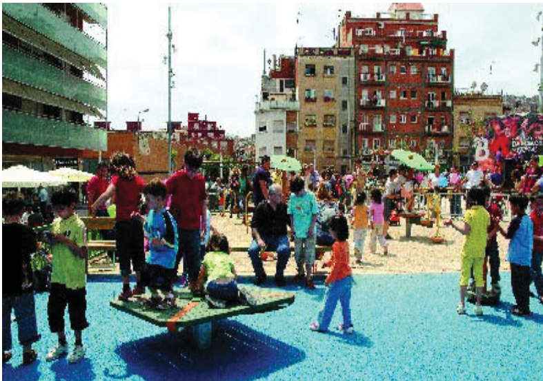
Festa d'inauguració de la plaça Miquel Ferrà.

El carrer Miquel Ferrà s'ha convertit en una plaça amb jocs infantils i paviments de colors diversos. A sota mateix, hi ha un aparcament de 322 places, el 23è dels construïts a Nou Barris