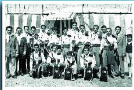
La banda de trompetes i tambors de la Societat Coral L'ideal d'en Clavé, davant de l'envelat de festa major, a la Via Júlia en la dècada de 1950.

Si té fotografies o documents del seu barri, en pot fer donació a l'Arxiu Municipal del Districte, 93 291 68 36.