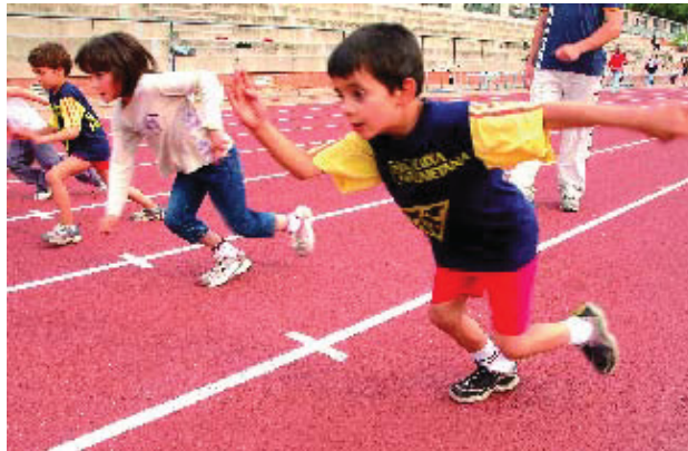
Futurs atletes al Parc Esportiu de Can Dragó.