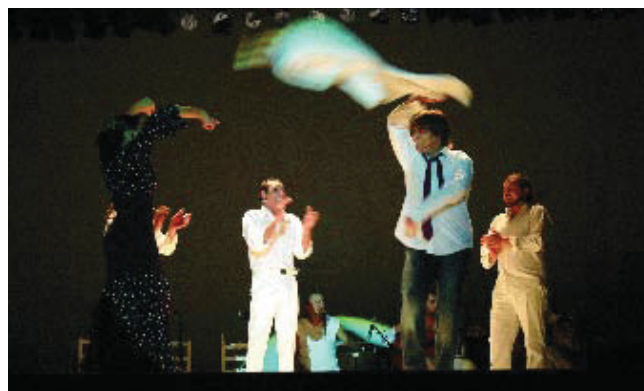
Antonio Canales durant la seva actuació al Festival de Flamenc.

El districte de Nou Barris ha tornat a viure durant deu dies un autèntic festival de ball, música, xerinola i representacions diverses de la tradició dels seus barris. Gegants, cercaviles, passejades amb bicicleta, mostres alimentàries, tallers i una clara presència de la cultura, materialitzada especialment en diverses expressions folklòriques, actuacions musicals o espectacles de dansa, són algunes de les activitats de les quals han pogut gaudir entre el 18 i el 28 de maig els veïns i veïnes del districte. Com sempre, una part important de les activitats han format part del Festival de Flamenc, que ha comptat amb el ballaor Antonio Canales com a convidat d'excepció.