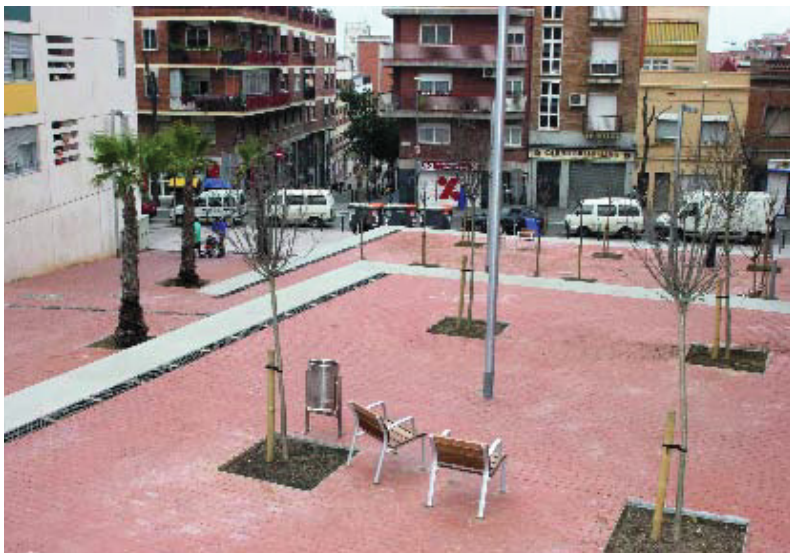
La nova plaça, de 3.220 m 2 connecta els carrers Góngora i Viladrosa.

Quan ja falta poc perquè s'acabi la remodelació del polígon conegut com a Habitatges del Governador, s'ha enllestit la urbanització de la plaça del Verdum, la qual queda encerclada pels nous edificis