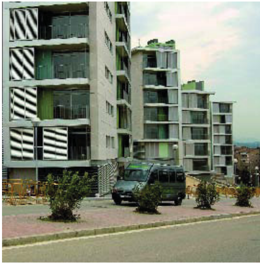
Els pisos del carrer Aiguablava.

Els anys noranta, les diferents administracions implicades van arribar a un acord i