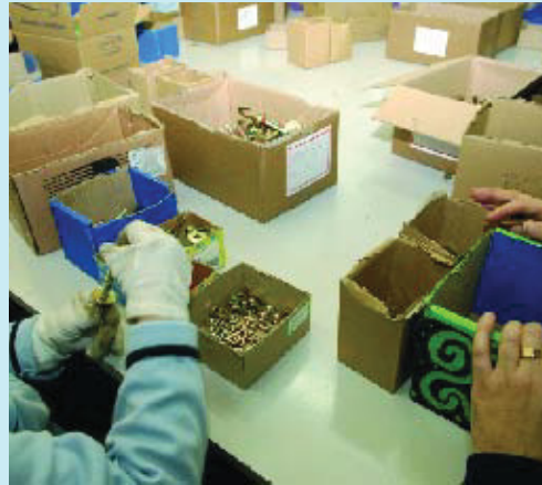
Grup d'usuaris del centre ocupacional de Nou Barris.

El Grup de Serveis d'Iniciativa Social, que ara és al carrer Escultor Llimona, ocuparà un espai dins la gran illa d'equipaments de les Cotxeres de Borbó