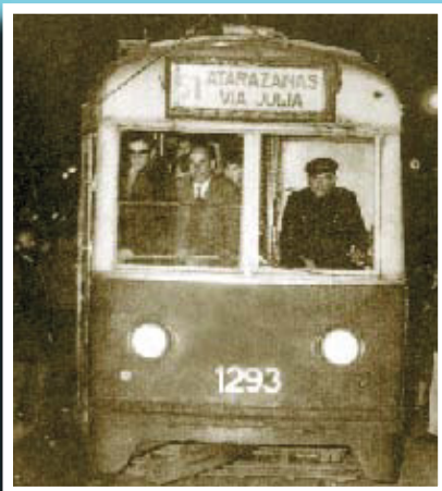
Un cotxe de la línia 51 el dia del seu comiat, el 18 de març de 1971.

Si té fotografies o documents del seu barri, en pot fer donació a l'Arxiu Municipal del Districte, 93 205 41 04