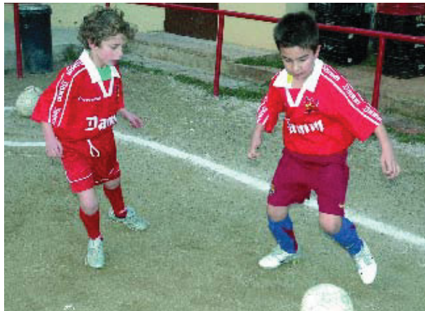
El club va néixer com una obra social dels treballadors de l'empresa cervesera.

El CF Damm va néixer com una obra social dels antics treballadors