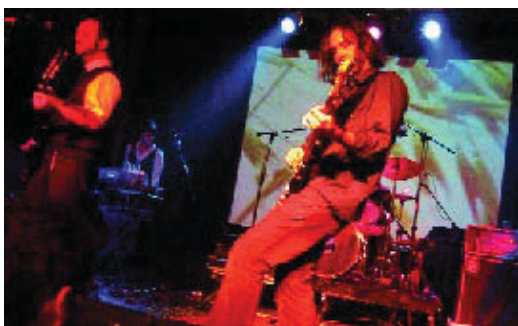
Actuació musical a Les Basses.