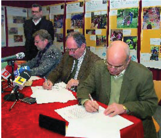
Instant en què les tres parts signen el conveni.

Com que l'estructura dels edificis no permet la instal·lació d'ascensors, cal que estiguin a l'exterior, ubicació que significa una ocupació de l'espai públic que el Districte s'encarrega de gestionar i facilitar. Ajuntament