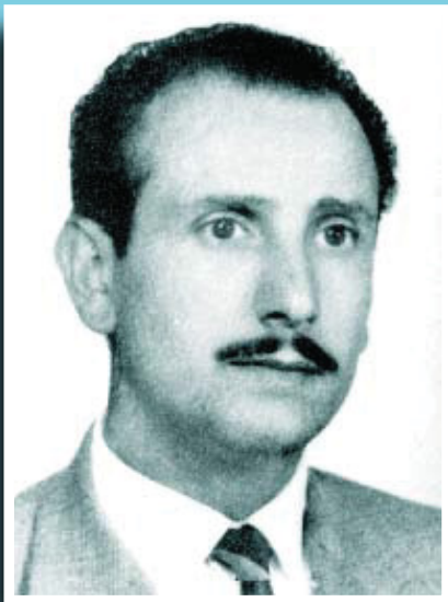
Darrera fotografia de Josep Lluís Facerias feta l'agost de 1957 a Toulouse i utilitzada en la documentació falsificada que duia.

El 15 d'agost de 1957, el guerriller antifranquista Josep Lluís Facerias, conegut com Facerias, va intentar passar la frontera des de França amb dos companys, tot i que la línia divisòria estava impermeabilitzada per la policia. Dos dies més tard, però, van aconseguir travessar-la i arribar a Barcelona. El dia 30, Facerias tenia prevista una trobada al final del carrer Doctor Pi i Molist, davant de l'Institut Mental. Sense saber que estava denunciada, va anar a la cita. En aquests casos, abans feia una volta amb un taxi per comprovar que no hi havia perill. Però aquell dia la policia, coneixedora del sistema, va organitzar un dispositiu invisible: al carrer no s'hi veia res, però les finestres dels edificis dels voltants eren plenes d'agents armats. Quan Facerias va aparèixer, el va rebre una pluja de projectils, alguns dels quals impactaren en el seu cos. Llavors, pistola en mà, va fugir i es va llançar per un terraplè de quatre metres. Tot i el cop, encara va tenir forces per agafar una bomba de mà, però no la va poder activar perquè va ser abatut a trets. Si té fotografies o documents del seu barri, en pot fer donació a l'Arxiu Municipal del Districte, 93 205 41 04