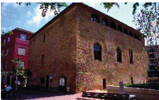
El Centre Cívic Torre Llobeta acull el concurs literari.