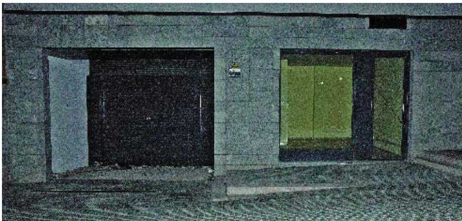
Aspecte exterior del nou local del club.

Més informació: Club Atletisme Nou Barris Telèfon: 93 346 62 26 Club Atletisme Nou Barris Té nou local a Via Favència