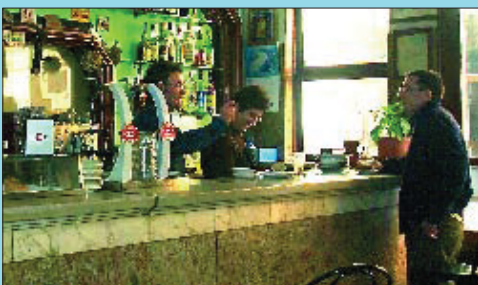
Interior de la bodega Montferri.

Es considera que Bodegas Montferri és la primera franquícia que hi va haver a Espanya. En el passat tingué diferents establiments a la ciutat de Barcelona i rodalies. Encara avui es manté la Bodega Montferri del carrer Eduard Tubau, establiment que té al voltant de cent anys d'antiguitat i que manté gairebé el mateix aspecte dels seus orígens. Hi ha el taulell de marbre, els barrils que antigament contenien el vi, les rajoles amb imatges de fruites, les taules i els banquets de fus-