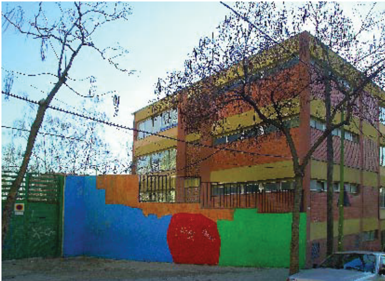
El CEIP Sant Antoni M. Claret acollirà una escola bressol.

Abans de la primavera entraran en funcionament el Casal de Joves de Roquetes, el Centre Ton i Guida i el Casal de Gent Gran. L'escola bressol El Castell inaugurarà noves instal·lacions al setembre