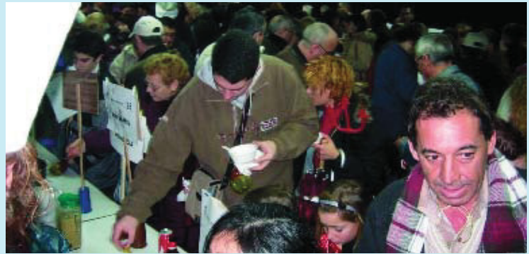
Imatge de l'edició 2005 del Festival de Sopes del Món.

La xarxa d'entitats 9 Barris Acull organitza, el proper 26 de febrer, la tercera edició del festival a la plaça d'Àngel Pestaña