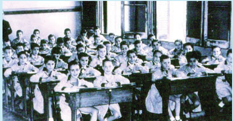
Una de les fotografies de l'exposició.

"Un segle d'escola a Barcelona. L'acció municipal i popular" es pot visitar al pati de la seu del Districte fins al 15 de febrer