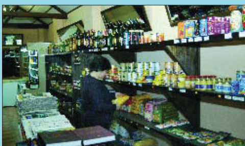
Interior de El Arca de Noé.