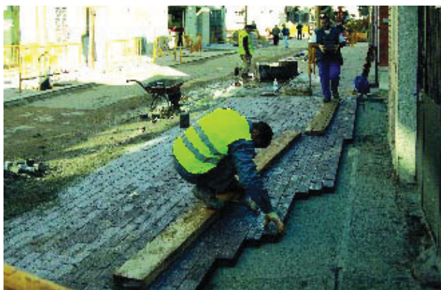
Obres de millora del barri de Prosperitat.

Prosperitat és un barri amb una trama urbana densa que aviat es veurà alleujada. Actualment s'estan duent a terme les obres que convertiran el carrer Santa Engràcia, en el tram que va del carrer Turó Blau fins al de Sant Francesc Xavier, en un carrer amb prioritat per a vianants, tal com ja ho és el tram que va fins a Argullós. Per altra banda, ben a prop d'allà, s'està construint una plaça de més de 2.700 m 2 en l'espai delimitat pels carrers Enric Casanovas, Borràs i Boada. Un cop acabada, aquesta plaça tindrà espais per a diferents usos i tindrà rampes que en salvaran els desnivells i faran que no hi hagi barreres arquitectòniques.