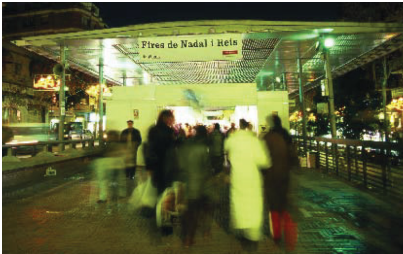
La marquesina de Via Júlia acollirà una nova edició de la Fira de Nadal.