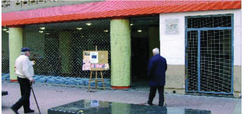
Entrada al Centre Cívic Zona Nord.