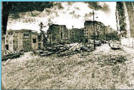
Abans El carrer Valldaura en les obres d'urbanització al començament dels anys noranta.

Si té fotografies o documents del seu barri, en pot fer donació a l'Arxiu Municipal del Districte, 93 205 41 04