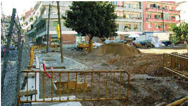
La nova plaça s'està construint entre els carrers Enric Casanovas, Borràs i Boada.

La trama urbana de Prosperitat millorarà sensiblement gràcies a l'actuació d'esponjament que s'està duent a terme a l'espai delimitat pels carrers Enric Casanovas, Borràs i Boada. La nova plaça que s'hi està construint tindrà un gran espai central de sauló i gespa, que estarà combinat amb una important plantació d'arbres amb espècies de fulla caduca i d'altres de perennes. També tindrà àrees de descans i espais amb jocs infantils. Tot plegat es combinarà amb altres zones pavimentades. Un cop acabada, la plaça aportarà un nou espai de 2.775 m 2 de lleure per al barri de Prosperitat, que ajudaran a esponjar una mica la densa trama urbana d'aquest barri. El pendent de la plaça quedarà salvat a través de rampes que faran també que aquest espai estigui lliure de barreres arquitectòniques.