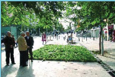
Ara La urbanització del carrer Pablo Iglesias entre els carrers d'Argullós i Flor de Neu, el convertí en un bulevard.