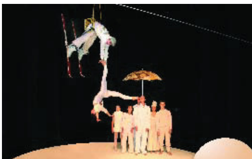
"Circus Klermer", el Circ d'Hivern del 2004.