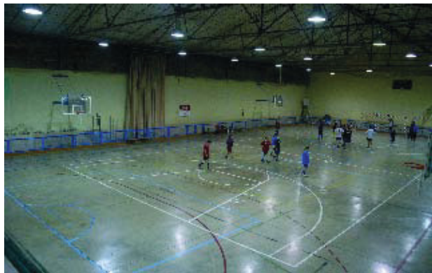
Imatge actual del pavelló.

Aquestes millores de condicionament general del poliesportiu han estat adjudicades a l'empresa Servi-