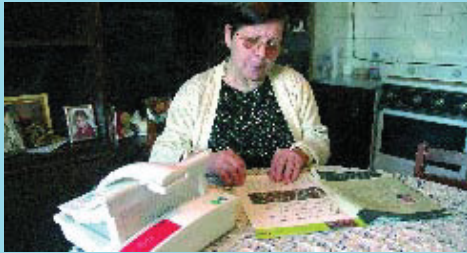
El servei de teleassistència funciona les 24 hores del dia.