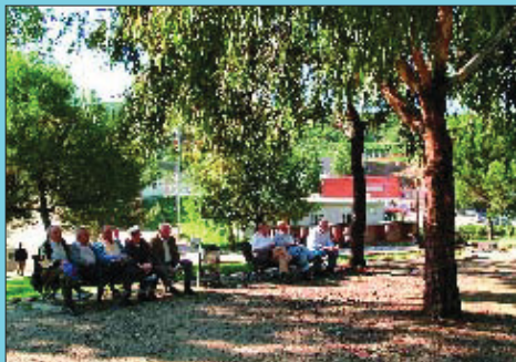
Ara La plaça de la Font dels Eucaliptus; a l'ombra hi ha una gran zona d'esbarjo.