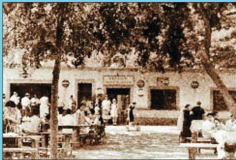
Abans El Parador de la Font dels Eucaliptus, l'any 1960.

Si té fotografies o documents del seu barri, en pot fer donació a l'Arxiu Municipal del Districte. T. 93 291 68 36