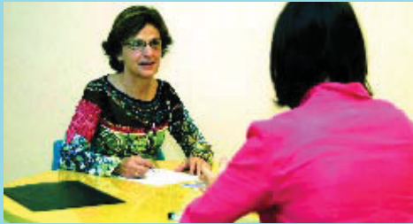
Una adjunta a la Síndica atén una ciutadana.