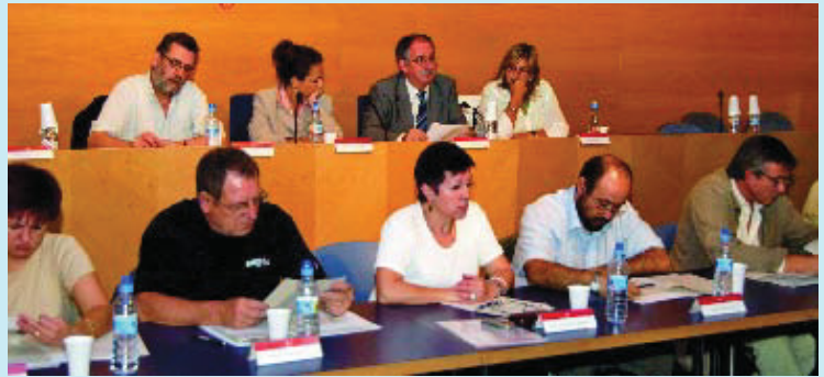
Un moment del Ple d'octubre.