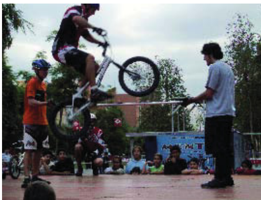
Exhibició de "biketrial", en el marc de la Setmana.

La Federació d'Associacions de Comerciants de Nou Barris, els Eixos Comercials de Nou Barris, la Coordinadora de Comerciants de Virrei Amat i l'Eix Comercial de Maragall, amb el suport del Districte, van organitzar la primera Setmana del Comerç a Nou Barris. Aquesta iniciativa, que va ser possible gràcies a l'activa participació dels comerciants, es va autofinçar amb les aportacions dels comerciants mateixos i amb el patrocini privat. Activitats culturals i lúdiques per a tothom, així com taules rodones per a la dinamització del comerç als barris van configurar el programa d'aquesta