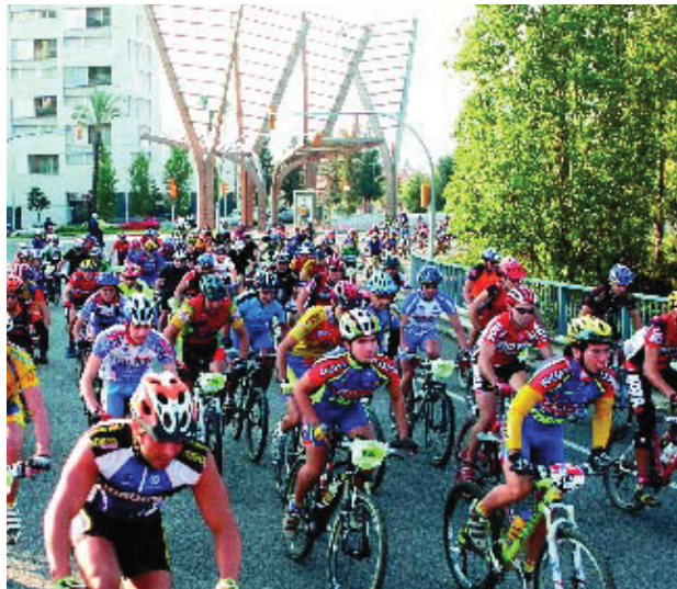
La marxa va omplir alguns carrers de bicicletes de muntanya.