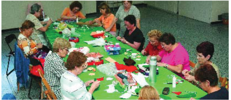
Taller de manualitats de dimecres a la tarda.

És l'entitat que durant més anys, prop de 80, ha estat activa al barri i, juntament amb el Cassinet d'Horta, és de les més antigues