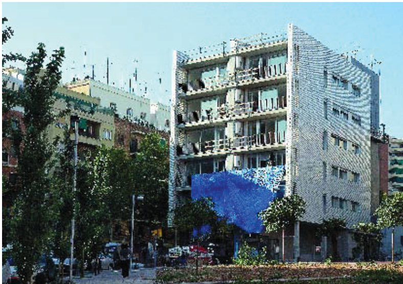
A la promoció del carrer Doctor Pi i Molist s'han reservat 6 habitatges protegits.

Els habitatges, que són de tres dormitoris, es van sortejar el passat 5 d'octubre i inclouen plaça d'aparcament. Totes dues promocions es podran entregar als propietaris d'aquí a tres mesos