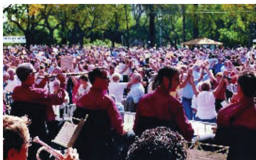
Un moment de l'aplec del 16 d'octubre.