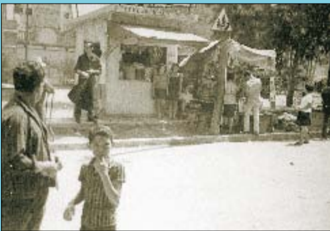
Abans En l'indret on avui es troba la pèrgola, l'any 1963 acollia un quiosc.

Si té fotografies o documents del seu barri, en pot fer donació a l'Arxiu Municipal del Districte, 93 291 68 36