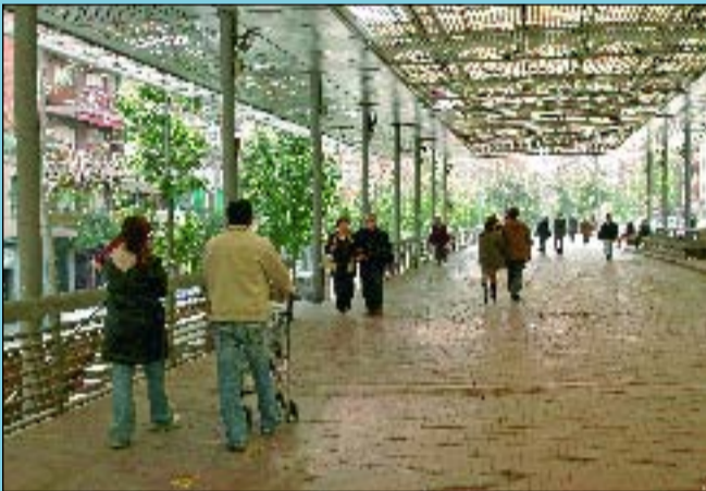
Ara Amb la seva reurbanització, els veïns gaudeixen d'un lloc de trobada i esbarjo més confortable.