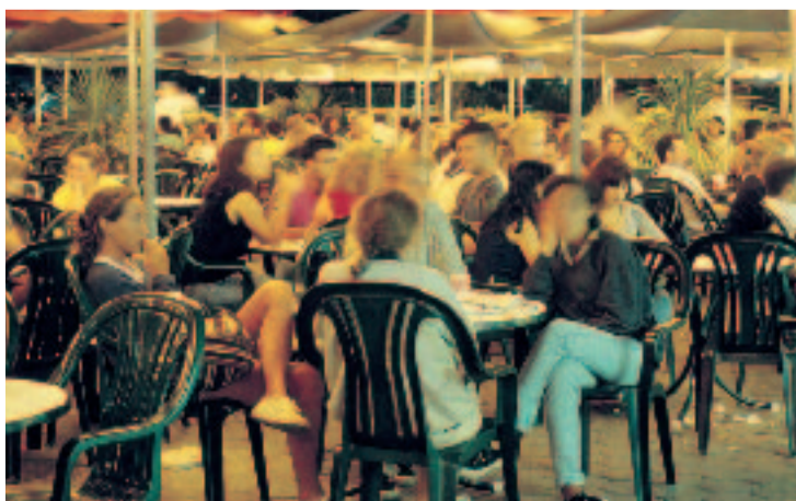
Una vintena de joves emetrà un informe sobre opcions per a la nit.

Una vintena de joves d'entre 15 i 29 anys, triats a l'atzar entre els 800 que van contestar una enquesta municipal fa alguns mesos, participaran els dies 17 i 18 de juny en el primer Jurat de Joves del districte. Els joves assistiran a una sèrie de conferències sobre els models d'oci nocturn urbans, l'ús dels espais públics, les normatives vigents (horaris, llicències, dret d'admissió...) o la mobilitat a la