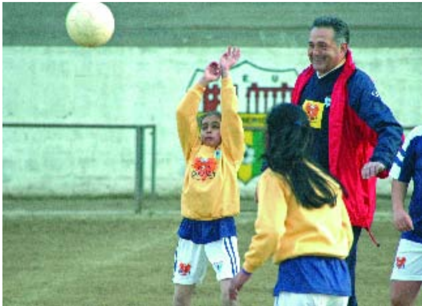
La classe pràctica va ser la part més divertida de la jornada.

El minicampus, dirigit a nens i nenes que participen al programa Escuelas Deportivas Copa Danet, es realitza a tot l'estat i fa possible que molts infants de zones socialment desfavorides tinguin la possibilitat, mitjançant la pràcti-