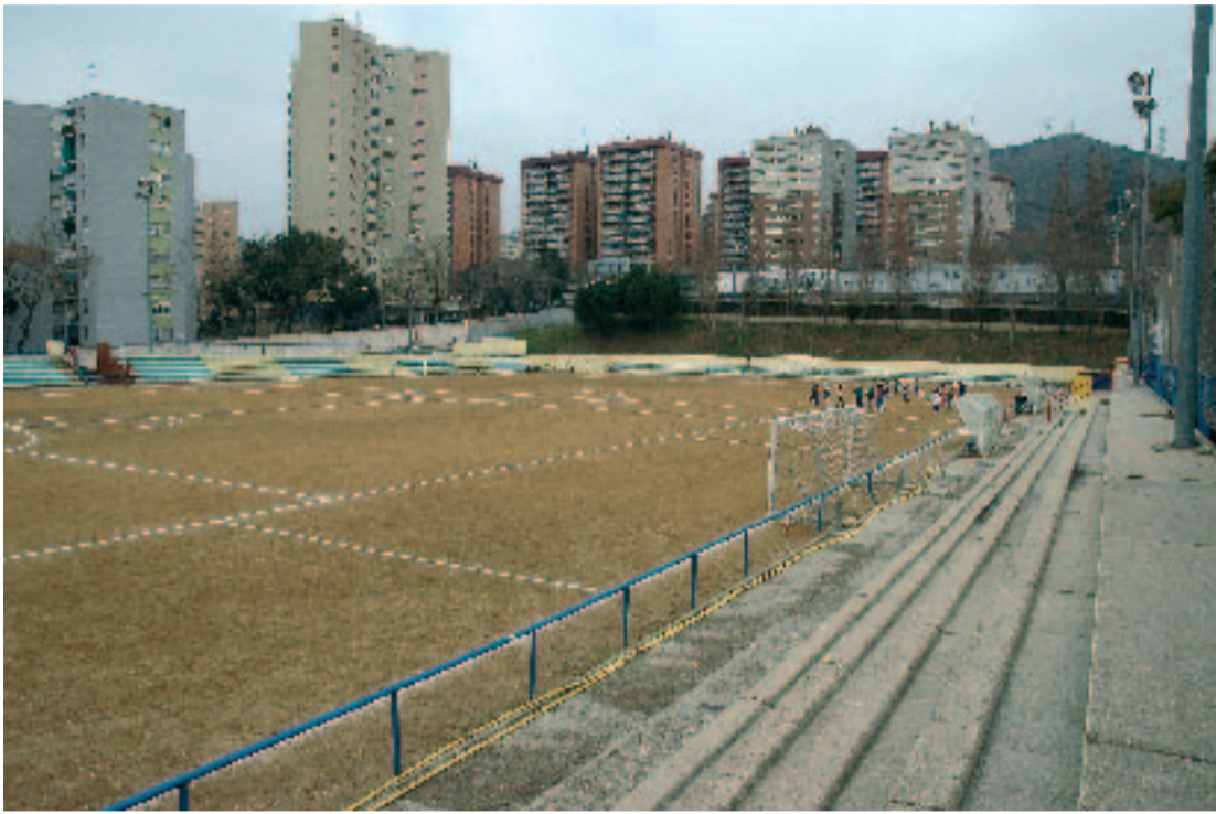
L'Ajuntament invertirà aquest estiu uns 70.000 euros en obres de millora a la Guineueta i Prosperitat.