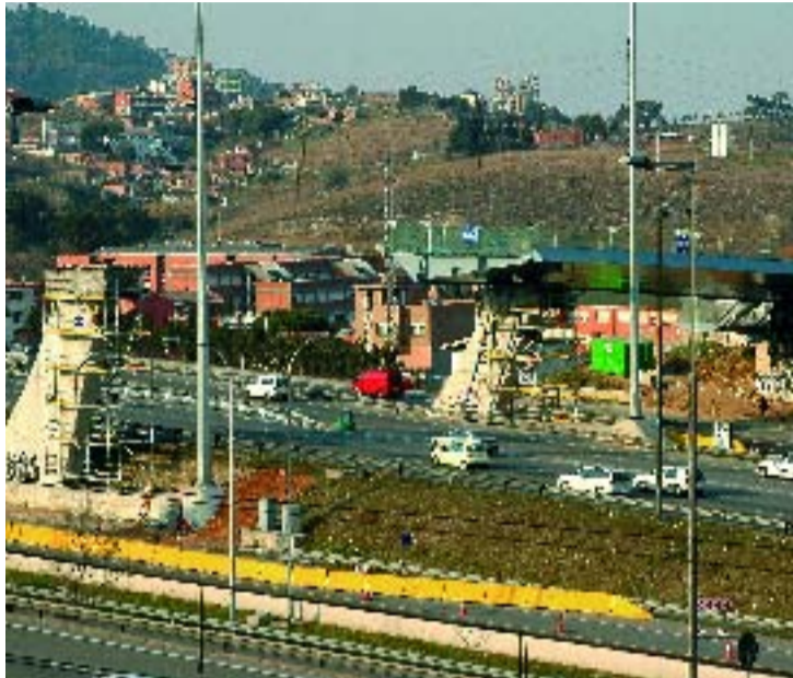
La tècnica d'empenta ha permès executar l'obra en 18 mesos.

Encara que la zona afectada per la construcció del pont