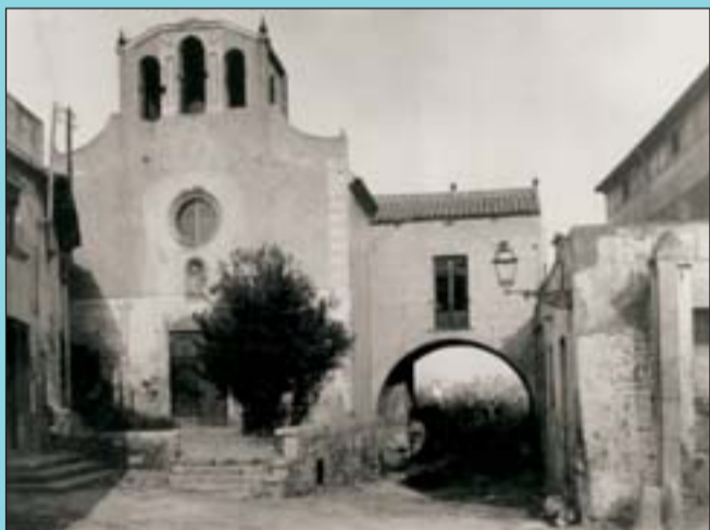
Abans El conjunt de Vilapicina, una imatge de pessebre.

Si té fotografies o documents del seu barri, en pot fer donació a l'Arxiu Municipal del Districte, 93 285 03 57