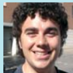
Albert Miret Telecomunicacions

Ara guanyarem una plaça, però perdrem lloc per aparcar el cotxe. De tota manera, crec que la plaça serà millor que l'aparcament. Jo vivia en un pis amb aluminosi i ara visc en un pis molt gran i molt maco.