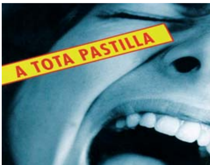
Cartell de la mostra sobre el problema de les drogues de síntesi.

El Consell de Cooperació i Solidaritat de Nou Barris i el Districte són els organitzadors de l'exposició itinerant "Nou Barris Solidari", que mostra la tasca de les entitats que formen part del Consell. L'exposició es podrà visitar fins al 26 de novembre al Centre Cívic Via Favència (Via Favència, 217). A partir del dia 29 i fins al 23 de desembre romandrà al Centre Porta-Sóller (baixos plaça Sóller).