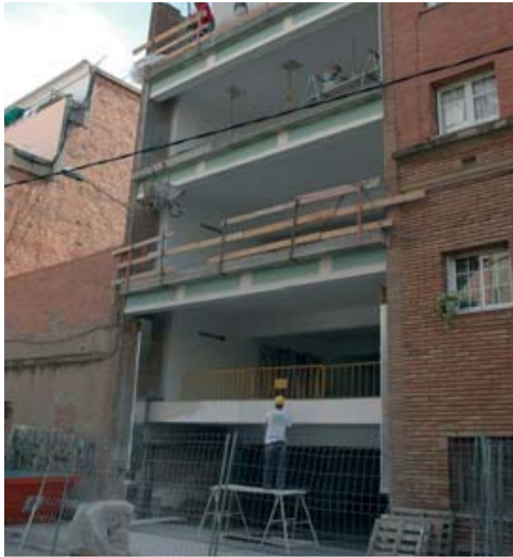
El casal Ton i Guida és al carrer Romaní, 6.

El projecte d'obres que s'està executant preveu la reforma de les dues façanes que té el bloc, tant la que dona al carrer de Romaní, on hi ha l'entrada principal, com la del carrer de Vidal i Guasch, a més d'una distribució completament nova de l'interior. El nou edifici no tindrà barreres arqui-