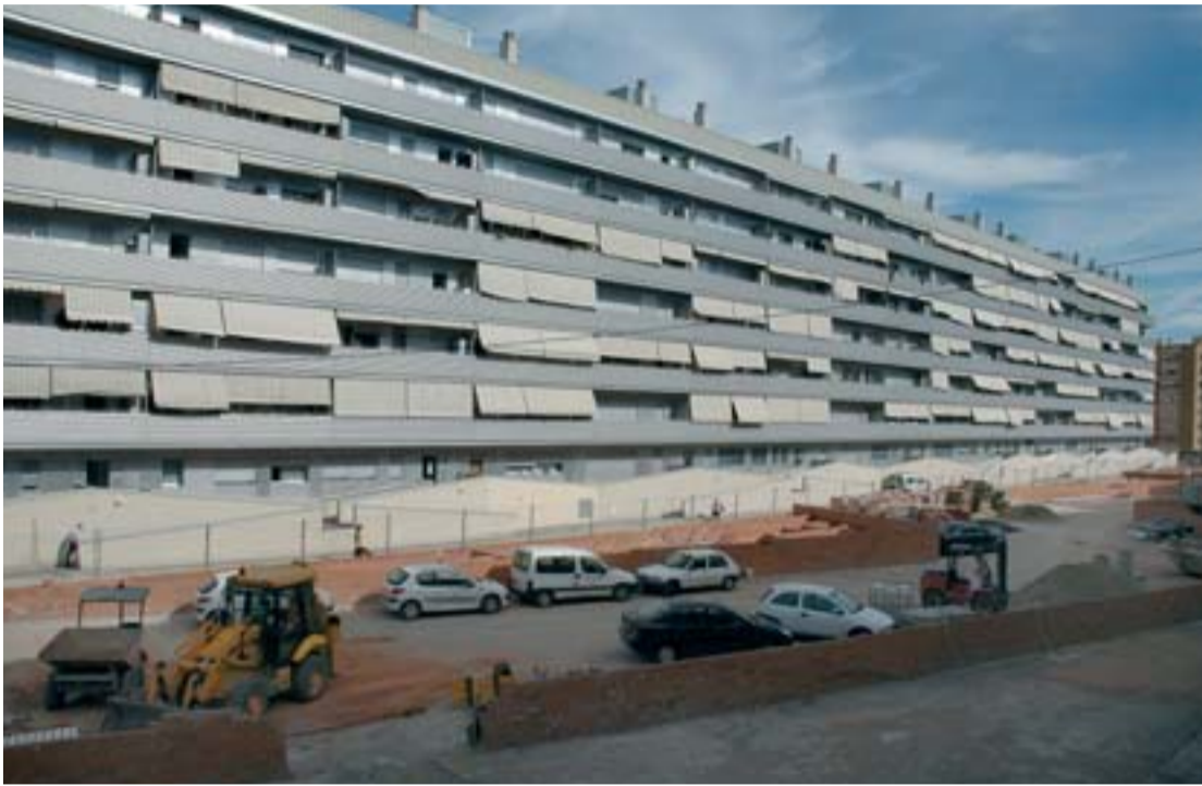
La zona que delimita amb el passatge d'en Grau és com un balcó amb vistes.