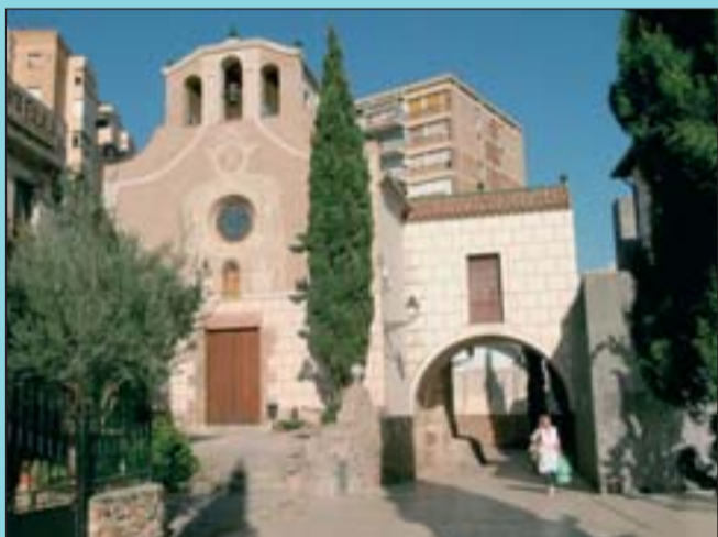
Ara Amb el pas del temps s'hi han afegit nous edificis.