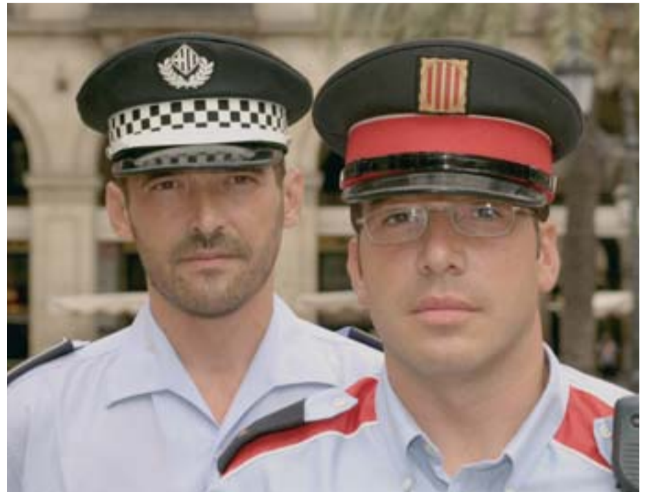
El nou model policial de Barcelona estarà basat en la coordinació.

La Guàrdia Urbana i els Mossos es formen al mateix centre, a l'Escola de Policia de Mollet. Us heu trobat antics companys de classe?