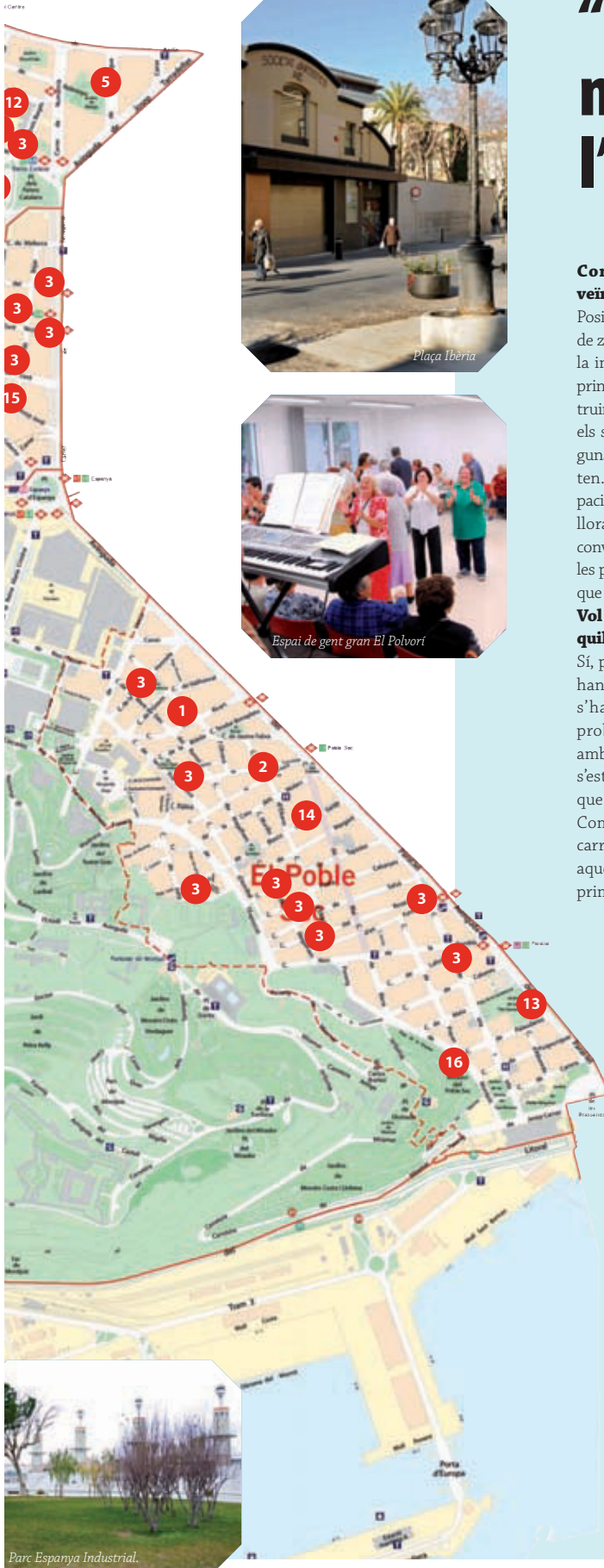
Parc Espanya Industrial.