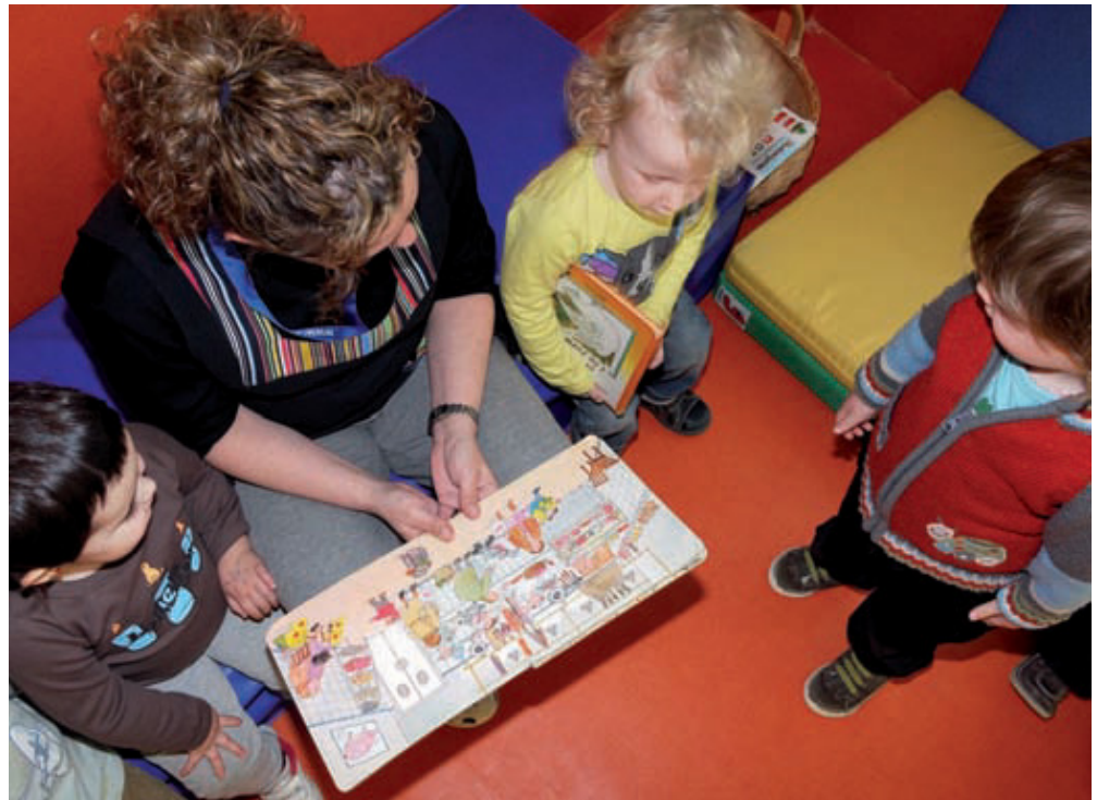
L'escola bressol Guinbó ha estrenat recentment el seu nou edifici.