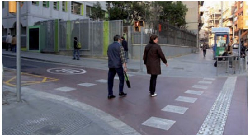
Cruïlla dels carrers Olzinelles i Constitució.