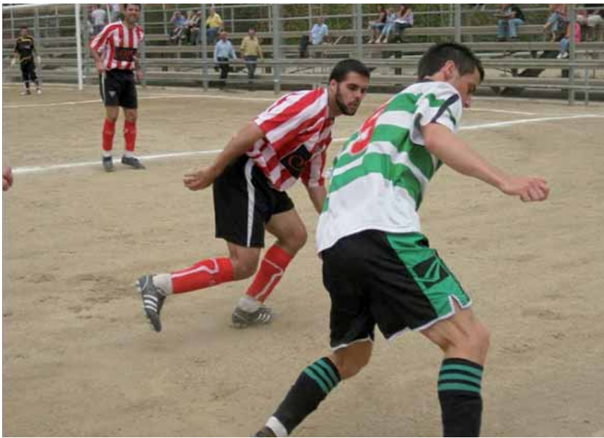
La Unió Esportiva Sants té més de 450 jugadors.

Ara, i de cara a aquesta pròxima temporada, el directiu remarca el seu desig de "continuar treballant modestament en la consolidació del nostre equip en aquesta categoria. Ja hi haurà temps, en les següents, de pensar a pujar i anar guanyant títols".