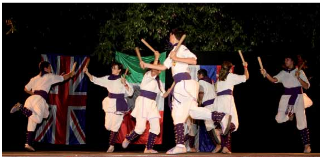
Una de les actuacions celebrades a la Festa Major del Poble Sec de l'any passat.

lebrarà al CEIP Barrufet. El seguiran el tradicional lliurament de premis del Concurs de Guarniment de Carrers, dilluns 24 al passatge Vapor Vell; la Cercavila de Festa Major (el 22), o l'Ofrena Floral a Sant Bartomeu, per part de les Comissions de festes dels carrers, els Castellers de Sants i els veïns que ho desitgin. Els jardins de Can Mantega, d'altra banda, concentraran els concerts musicals, amb grups com Lolaimon (25), La Carrau (26), l'Ivanow Jazz Group (27) o Love Of Lesbian (28). Destaquen també la Diada castellera de Festa Major (30), amb els Castellers de Sants, i altres colles invitades; el Correfoc infantil de Guspines de Sants i el Correfoc dels Diables de Sants i altres colles invitades (tots dos dimecres 26). Aquest últim recorrerà, previsiblement, els carrers Muntades, Autonomia, Premià, Sants, Gayarre i Sant Crist fins a les places Ibèria i Bonet i Muixí.