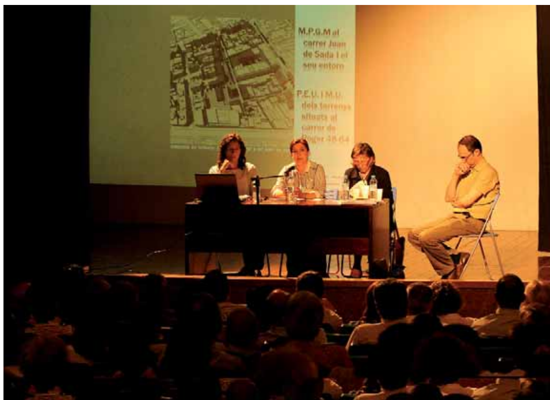
La reunió informativa per als veïns es va celebrar el passat 9 de juny.

En una reunió informativa a l'escola d'FP Oscus, s'hi va explicar al veïnat el projecte de reordenació del carrer Joan de Sada i el seu entorn per crear un nou espai d'estada i esbarjo per als veïns i pacificar el trànsit