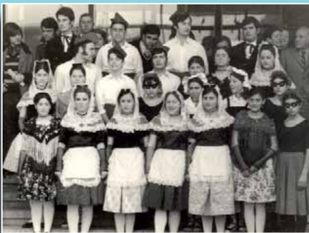
Membres de l'esbart a la plaça de l'Univers de Montjuïc, al 1971.

Si té fotografies o documents del seu barri, en pot fer donació a l'Arxiu Municipal del Districte, 93 332 47 71