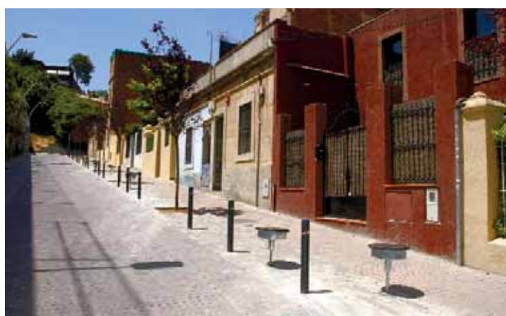
Els bancs de Margarit s'han dissenyat per salvar el pendent.