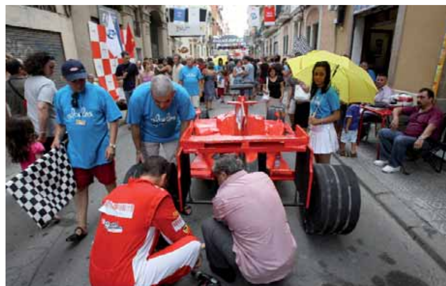
Un carrer de Sants durant la Festa Major del 2008.

La Festa Major del Poble Sec ja és aquí. Entre el 18 i el 26 de juliol, el barri s'omplirà de nombroses activitats lúdiques pensades per a tots els gustos. L'actriu Leticia Dolera en serà la pregonera. Una altra actriu, Lloïl Bertran, donarà el tret de sortida a la Festa Major de Sants, del 22 al 30 d'agost. S'espera el tradicional lliurament de premis del Concurs de Guarniment de Carrers; l'Ofrena Floral a Sant Bartomeu; el clàssic correfoc doble (l'infantil, per la tarda, i el d'adults, per la nit), així com una programació musical, com la de Poble Sec, variada i de qualitat, amb les actuacions de grups com Love Of Lesbian o La Carrau.