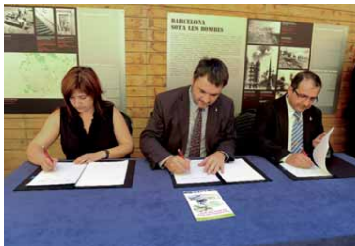
La regidora del Districte, Inma Moraleda, el primer tinent d'alcalde, Carles Martí, i l'alcalde de Flix, Òscar Bosch, durant la signatura.

El refugi 307 del Poble Sec, situat a la confluència del carrer Nou de la Rambla i el passeig de Montjuïc, va ser l'escenari el passat 27 de juny de l'acte d'agermanament entre aquest refugi i el de Flix. El conveni de col·laboració el van signar d'una banda el primer tinent d'alcalde de Barcelona, Carles Martí, i la regidora del Districte de Sants-Montjuïc, Imma Moraleda, i de l'altra, l'alcalde de Flix, Òscar Bosch. La iniciativa d'agermanar ambdós refugis va néixer de l'Associació per a la Recerca Històrica i Documentació de la Guerra Civil i del Poble Sec, una entitat que darrerament s'ha dedicat a l'estudi de la batalla de l'Ebre. En unes de les visites que l'associació va fer a Flix mentre preparaven una exposició sobre aquesta temàtica, van coincidir amb el Sr. Bosch, aleshores primer tinent d'alcalde del municipi, i fou quan se li plantejà la possibilitat d'un agermanament. Durant l'acte, el tinent d'alcalde, Carles Martí, va comentar