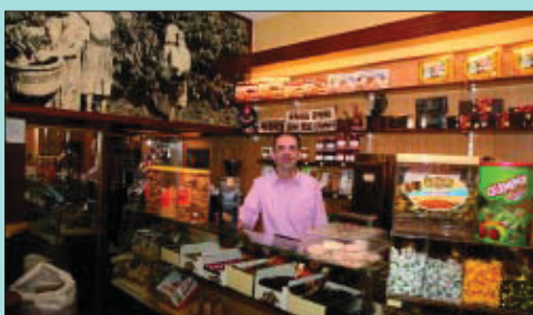
A Cafès Gimeno elaboren mesclades exclusives.