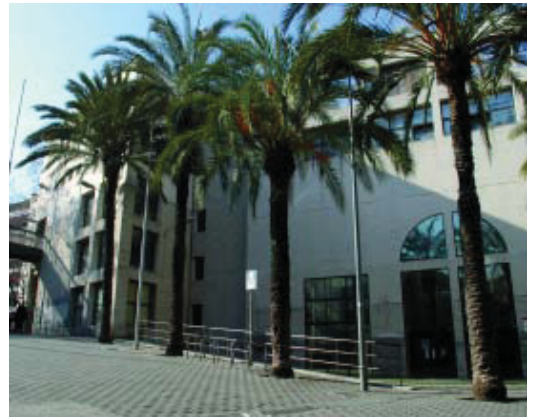
Imatge del centre cívic de les Cotxeres de Sants.

E ls centres cívics funcionen molt bé al seu barri, però encara són desconeguts a la ciutat com a veritables centres de proximitat que són, per això, el sector d'Educació, Cultura i Benestar impulsa un projecte per fer més visibles els centres cívics en el conjunt de la ciutat. Per aconseguir-ho, els facilita el seu treball en xarxa, coordinadament amb els districtes. La primera acció és "Barris Creatius. Energia Barcelona". Es tracta d'un projecte on els directores i les directores dels 51 centres cívics de la ciutat treballen per primer cop de manera conjunta i amb els actors implicats per fer de Barcelona una ciutat innovadora, inclusiva i més cívica. Aquests professionals es reuneixen tres o quatre vegades a l'any per desenvolupar accions. Enguany, els 51 responsables han seleccionat cent propostes fetes per les entitats de la ciutat i que actual-