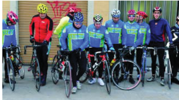
Les sortides de l'associació estan diferenciades en cinc grups.

Els inicis de l'Agrupada es remunten a l'any 1917, quan es va fundar com "un grupet que feia algunes sortides i excursions amb bicicleta. A poc a poc, es va anar fent més i més gran, amb més amics i socis, i es va atrevir a organitzar les seves primeres curses, entre les quals hi havia l'escalada