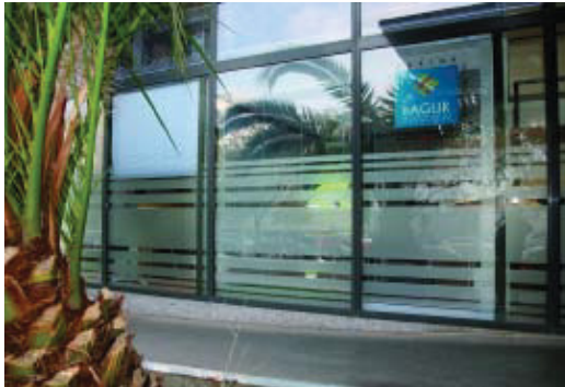
Imatge de la nova oficina d'informació municipal.

L'Ajuntament de Barcelona impulsa la transformació urbanística de la Marina del Prat Vermell a través de la seva oficina d'informació, oberta el passat mes de juny