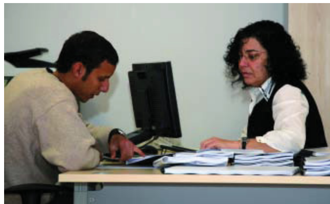
La nova oficina vol ser el mitjà per consensuar la transformació del barri.

L'oficina d'informació que l'Ajuntament va obrir el passat mes de juny a la Marina del Prat Vermell s'ha convertit en l'eix vertebrador dels canvis i les transformacions d'aquest nou barri. La zona, situada entre la muntanya de Montjuïc i la Zona Franca, tindrà més de 10.000 nous habitatges, 133.000 m 2 destinats a espais lliures i zones verdes i 111.0000 m 2 per a nous equipaments. L'oficina té per objectiu establir un vincle entre l'Administració, els veïns, els comerciants i les entitats de la zona, per tal de consensuar la transformació prevista per al barri.