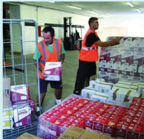
Personal de la Fundació Bancs d'Aliments.

El funcionament dels Bancs d'Aliments es basa en la donació i el repartiment d'aliments. El menjar és rebut als magatzems dels bancs i es distribueix gratuïtament per mitjà d'entitats benèfiques reconegudes. Per la seva relació directa amb els necessitats, aquestes entitats poden assegurar la des-