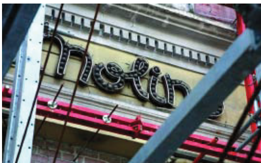
Part de la façana que es conserva de l'antic teatre.