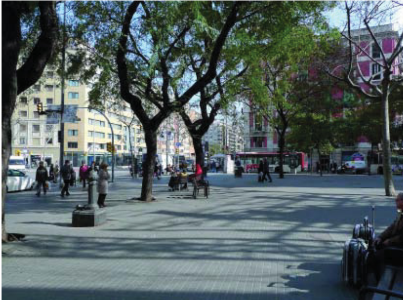
Estat actual de la plaça Bella Dorita.