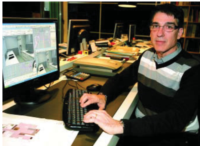
Segons Llanas, els comerciants de Creu Coberta són gent molt dinàmica.

Molts dels comerciants treballen i viuen al barri. I els qui no hi vivim, hi passem molt de temps i això fa que portem el barri al cor. Participem en molts dels seus projectes i hi organitzem activitats. Ara oferim unes passejades temàtiques amb una guia. Or-