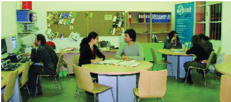
El Punt d'Informació Juvenil.

El servei ha obert dues sucursals a l'Espai Jove 12@16 del Poble Sec i al centre de barri la Vinya de la Marina