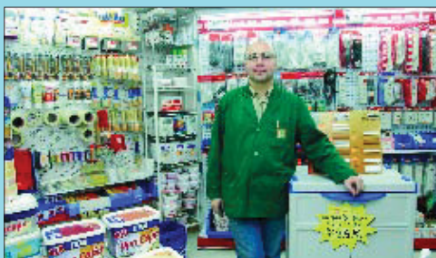
A la ferreteria Rodríguez es troben productes i consells.

C om és d'important trobar un bon consell quan ens hem d'enfrontar a les reparacions o arranjaments que sempre cal fer a casa! Ara s'ha de penjar un prestatge o un quadre, després cal tancar una esquadra o segellar una finestra, pintar... A Ferreteria Rodríguez, hi trobarem tot el material que ens cal, i no només de ferreteria, sinó també material elèctric i de fontaneria, pintures i parament per a la llar, entre moltes altres coses. Però el més important és que trobarem el consell expert i la solució més