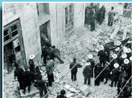
Aspecte dels treballs d'auxili després del bombardeig del 13 de març de 1937.

Si té fotografies o documents del seu barri, en pot fer donació a l'Arxiu Municipal del Districte, 93 332 47 71