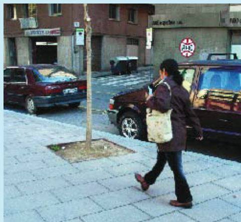
Una part del carrer Gavà, ja urbanitzada.

La regidora va informar també de la recent obertura