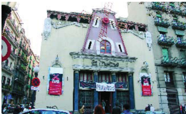
El nou Molino oferirà espectacles de flamenc, cabaret i dansa.

L'any 2008, el Paral·lel tornarà a veure girar les aspes del teatre El Molino. Un nou projecte preveu reobrir la famosa sala, la qual oferirà, entre altres espectacles, flamenc, cabaret i dansa. El projecte arquitectònic conserva la façana tradicional, refà l'interior del teatre i aixeca un edifici de cinc pisos amb pell de colors. El nou teatre comptarà amb un aforament total per a 230 persones. Un dels encants d'aquest projecte arquitectònic serà la petita terrassa damunt del terrat actual, la qual també estarà oberta cap a l'escenari i on a més de prendre copes es podrà prendre un sopar lleuger. Aquest projecte va ser presentat el passat mes de febrer en un acte amb presència de l'alcalde de Barcelona, Jordi Hereu.