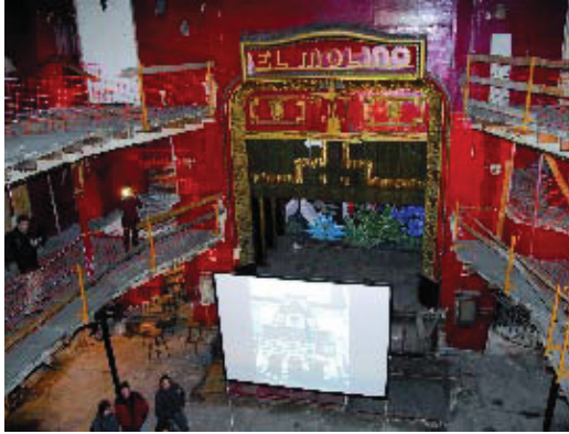
Interior d'El Molino el dia de la presentació del projecte.

El Paral·lel recupera El Molino després d'onze anys a les fosques i molts projectes inviàbles. El teatre recuperarà la façana modernista de Raspall i farà girar de nou les emblemàtiques aspes, però també guanyarà alçada amb un modern edifici de façana vidriada i colorista, segons va avançar el seu equip d'arquitectes (Bopbaa). Aquest edifici serà com un teló de fons que tindrà cinc plantes d'alçada, on aniran les oficines, les sales d'assaig i una sala tècnica; a nivell de carrer se situarà l'escenari, amb una platea amb taules i cadires, i dos petits amfiteatres amb un aforament total de 230 persones. A les dues plantes subterrànies, s'hi instal·laran les cuines i el magatzem. Un dels encants d'aquest projecte arquitectònic serà la petita terrassa damunt del terrat actual, que també estarà oberta cap a l'escenari i on, a més de prendre copes, s'hi podrà prendre un sopar lleuger. Considerat el café teatre més antic i petit d'Europa, El