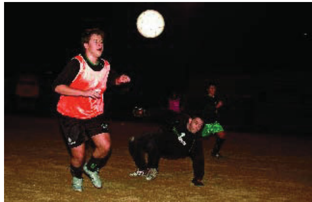
La secció de futbol compta actualment amb uns 20 equips.

"Volem que aquesta motivació torni", explica el gestor, "i per aquesta raó hem lluitat per aconseguir encarre-