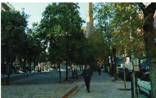
Plaça de Joan Corrades, on s'inicia el futur nou carrer.