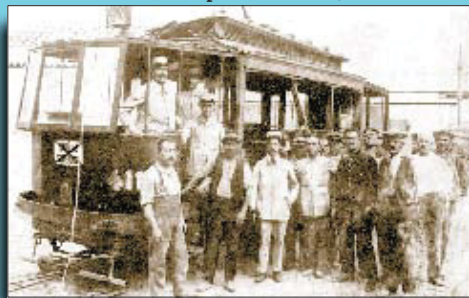
Tramvia de la línia de la Rambla al cementiri Nou, sobre el qual van caure alguns fragments de roca en la carretera del Morrot.

Si té fotografies o documents del seu barri, en pot fer donació a l'Arxiu Municipal del Districte, 93 332 47 71.