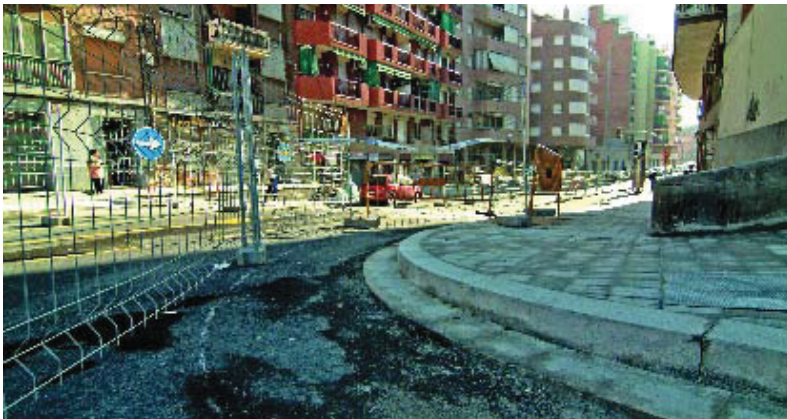
Les obres de Riera Blanca, a punt d'acabar-se.

El tram de la via entre el carrer Collblanc i la ronda Torrassa-Esterràs presenta unes voreres més amples, un nou enllumenat i una senyalització més moderna