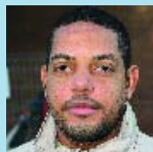
Henry de Oleo Sense feina

Bé. Tot i que fa molt de temps que tenim tallat el carrer, les obres eren necessàries.