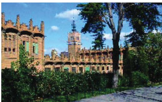
L'antiga fàbrica Casaramona és la seu de CaixaForum.