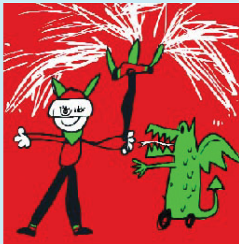
L'activitat reuneix prop de 30 colles infantils.

La festa començarà a les 12 amb una tabalada –una cercavila dels timbalers de les colles de diables– pels carrers i places Joan Güell, Madrid, Centre, Vallespir, Riego, Osca, Masnou, Olzinelles, Bonet i Muixí, Ibèria, Rossend Arús, Farga, Ferreria, Guadiana, Sant Medir, Daoiz i Velarde, Sant Jordi i Sants fins al parc de l'Espanya Industrial. En aquest mateix parc, a dos