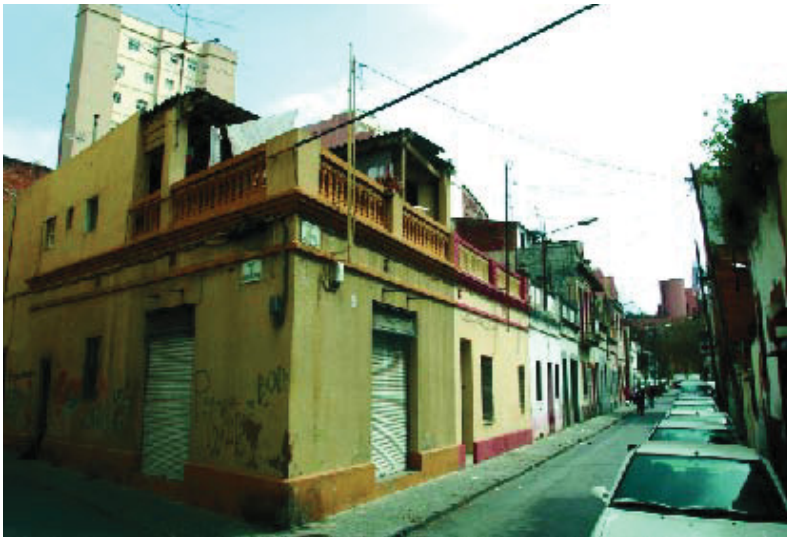
Una imatge del barri, amb les cases característiques.