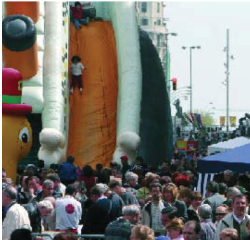
Festa d'inauguració de la remodelació del carrer Creu Coberta.

T riar el menú d'un restaurant o entrar en una botiga o centre comercial són activitats quotidianes que semblen no tenir cap complicació. Una afirmació amb la qual segur que no estan d'acord molts ciutadans invidents o amb problemes de mobilitat. L'Associació Sants-Creu Coberta Centre Comercial ha iniciat una campanya en col·laboració amb l'ONCE per elaborar cartes en braille i retolar també en l'alfabet dels cecs l'exterior dels establiments. Aquesta iniciativa, que s'emmarca dins l'Any del Comerç, se suma al conveni que recentment han signat l'Institut del Paisatge Urbà, Barcelona Comerç i l'Institut Municipal de Persones amb Disminució per eliminar les barreres arquitectòniques dels establiments comercials. Els comerciants que ho desitgin podran obtenir un informe de viabilitat de les obres de forma totalment gratuïta i accedir a subvencions per construir rampes i suprimir barreres. L'Any del Comerç s'ha estrenat a Sants coincidint amb la