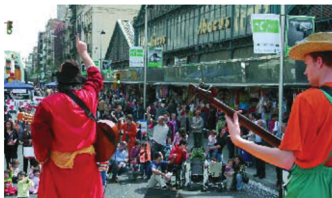
El 6 de maig s'hi celebra la Festa del Comerç al carrer.

L'Any del Comerç s'ha estrenat a Sants amb la reurbanització del carrer Creu Coberta que, com altres eixos comercials del districte, celebra el dia 6 de maig la Festa del Comerç al Carrer. Més de 500 establiments dels eixos comercials Sants-Creu Coberta Centre Comercial, Galileu-Joan Güell-Vallespir i la plaça de la Marina fan dels carrers de Sants un gran aparador comercial. Però sens dubte, una de les iniciatives més originals i pioneres de l'Any del Comerç és la de l'Associació Sants-Creu Coberta Centre Comercial, que està impulsant la retolació dels establiments comercials i l'elaboració de cartes de menú en braille.