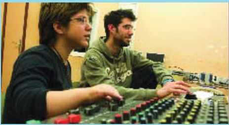
El servei s'adreça a joves de 16 a 30 anys.