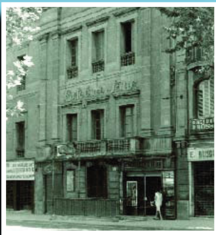
Primer edifici al carrer de Sants, 71-73, de l'Orfeó de Sants, l'any 1905, poc abans de ser enderrocat.

Si té fotografies o documents del seu barri, en pot fer donació a l'Arxiu Municipal del Districte, 93 332 47 71