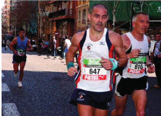
La competició va comptar amb 6.000 inscrits de 40 països.

per on passava la cursa i més de 20.000 visitants que durant divendres i dissabte van passar per la Marató Expo, la fira associada a la marató.