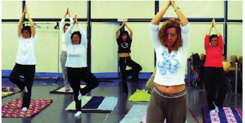
Els tallers de l'equipament reben unes 400 persones cada mes.