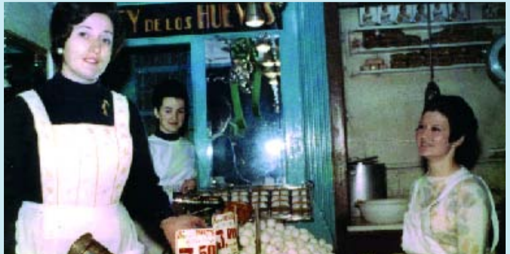
Imatge de l'exposició "Vida i treball, les dones del Mercat d'Hostafrancs".