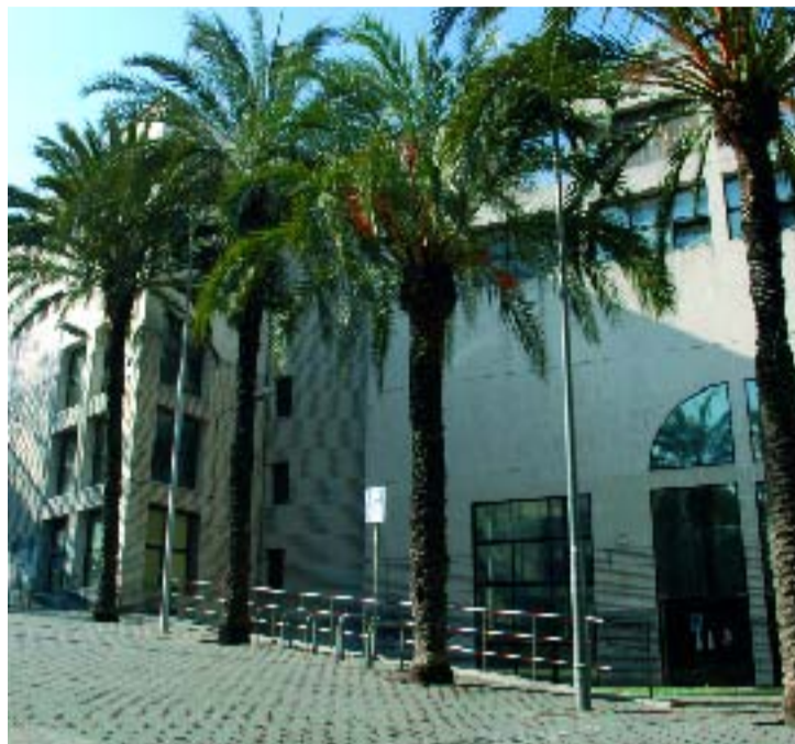
Els treballs de reforma del centre cívic s'acabaran al principi de 2007.