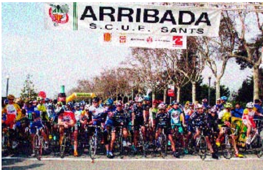
Nascuda el 1911, la volta arriba a l'edició 86.

Aquest any se celebrarà l'edició 86 d'una de les tres curses ciclistes internacionals amb més antiguitat del món. "Tornarem a tenir els grans equips i les grans figures d'aquest esport de les dues rodes.