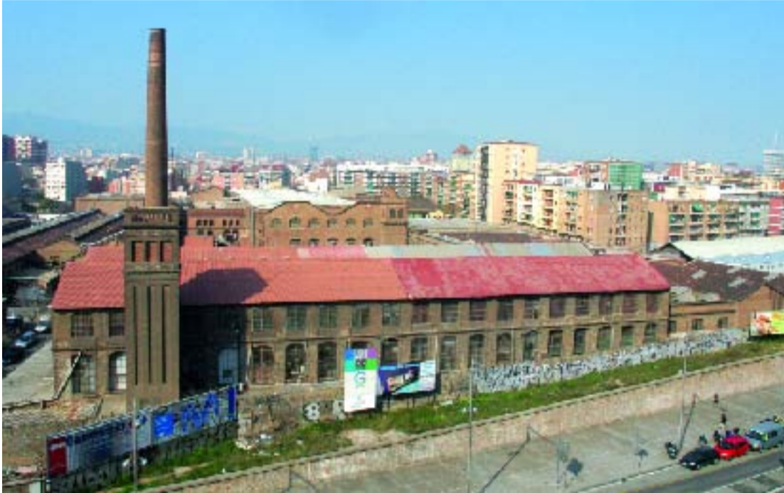
L'antiga fàbrica serà una de les zones més dinàmiques del districte.

D.V. El passat 6 de febrer es va celebrar una reunió de la Comissió de Seguiment de Can Batlló amb un únic objectiu: conèixer de primera mà la nova proposta urbanística de transformació d'aquest complex industrial. Després d'un intens i llarg