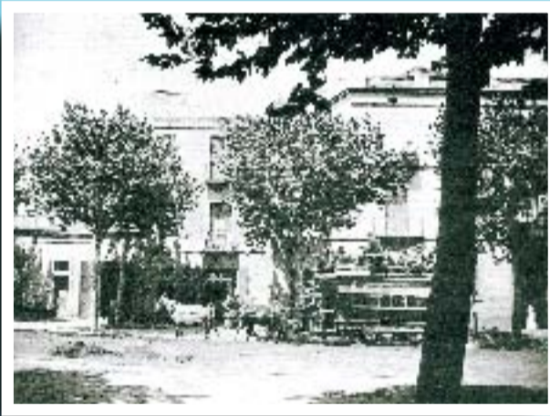
Un dels primers tramvies per la carretera de Sants al voltant de l'any 1880.

Si té fotografies o documents del seu barri, en pot fer donació a l'Arxiu Municipal del Districte, 93 332 47 71