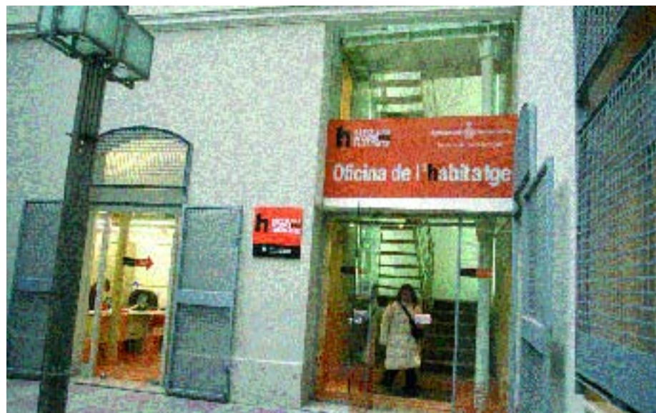
L'oficina es troba al Poble Sec, al carrer Blai, 34.

La nova Oficina de l'Habitatge de Sants-Montjuïc ha atès una mitjana de trenta persones diàries des que va entrar en funcionament a final de gener.