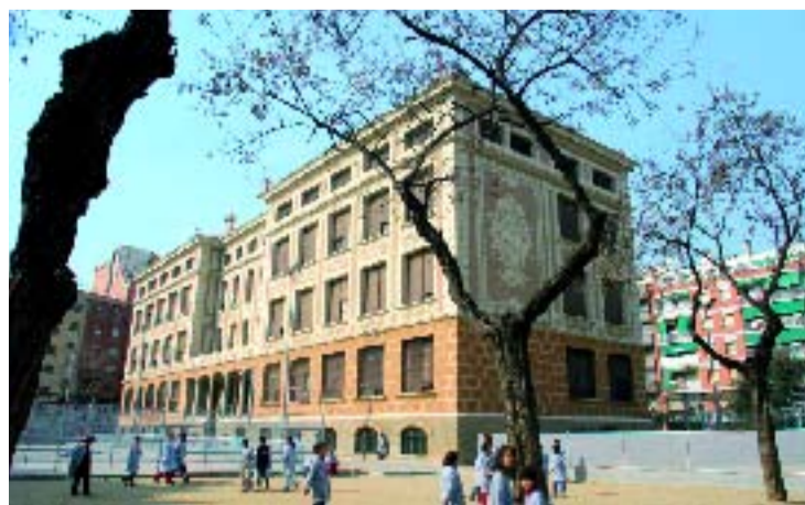
El centre Lluís Vives.