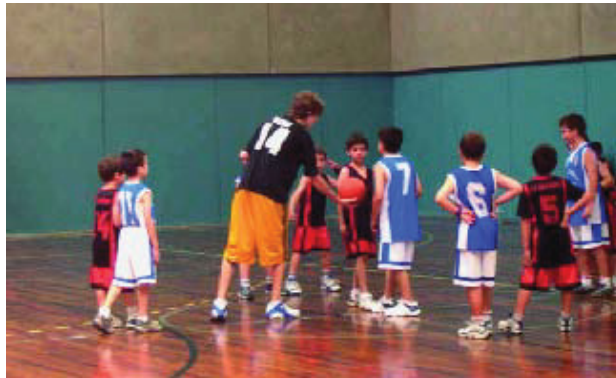
El BAM aposta pel foment de la pràctica del bàsquet.

El BAM té vint equips en totes les competicions: vuit són de categoria femenina, entre els quals destaca