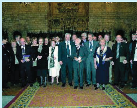
Els premiats amb les Medalles d'Honor de l'any 2004.

D urant la celebració de l'últim Consell Plenari del Districte, el mes d'octubre, es va aprovar per unanimitat presentar la proposta al Consell Plenari de Barcelona sobre l'atorgament de les dues Medalles d'Honor corresponents al territori de Sants-Montjuïc a la família Santiveri i a la Fundació Hospital Sant Pere Claver. Cada any, des del 1997, l'Ajuntament de Barcelona concedeix 25 Medalles d'Honor a ciutadans i entitats que han destacat per la seva tasca social realitzada en els diferents districtes, com també pels seus valors cívics o per la seva contribució al desenvolupament de la consciència ciutadana. La iniciativa de l'atorgament de guardons correspon al Consell Plenari de Barcelona (5 medalles) i els Consells de Districte (20 medalles, 2 per districte). La família Santiveri ha estat pionera en la recerca