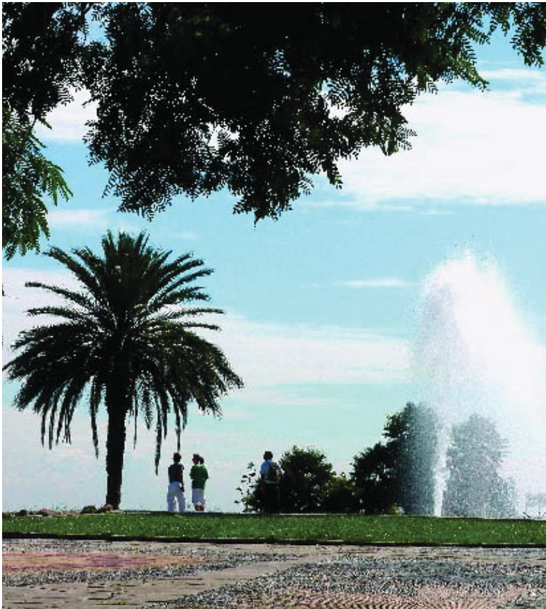
El Parc de Montjuïc és un gran pulmó verd dintre del nucli urbà.

El Parc ofereix unes passejades guiades perquè els visitants puguin conèixer els abundants racons lligats a la història de la ciutat i la diversitat d'espais naturals que hi ha a la muntanya