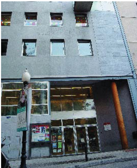
El Centre Cívic del Sortidor.