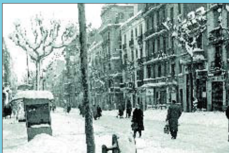
Abans El carrer de Sants, entre Alcolea i Salou, el dia de Sant Esteve de 1962, després de la gran nevada.

Si té fotografies o documents del seu barri, en pot fer donació a l'Arxiu Municipal del Districte, 93 332 47 71