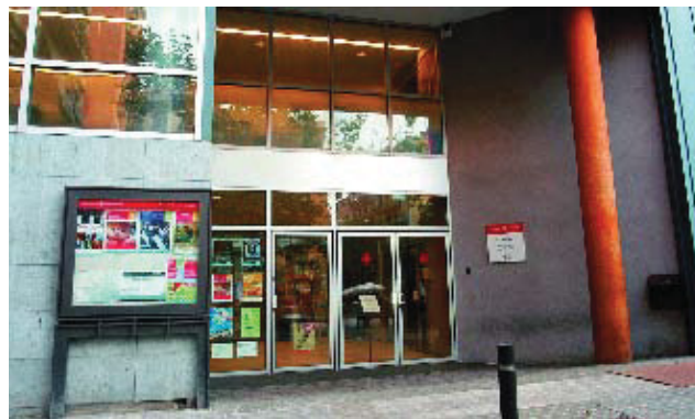
Entrada al Centre Cívic El Sortidor on es troba el PIAD.

El districte disposa d'un nou Punt d'Informació i Atenció a les Dones al territori. Aquesta va ser una de les actuacions que més es van destacar durant la celebració de l'últim Consell Pleneri del mes d'octubre. El PIAD tindrà la seu al Centre Cívic del Sortidor del Poble Sec, fet que coincidirà amb la finalització de les obres de millora d'aquest espai. Amb el nou Punt, les dones del districte tindran un servei on s'oferirà informació i orientació sobre recursos laborals, formatius, personals i de participació, espais de trobada i associacionisme femení. Els PIAD també ofereixen assessorament jurídic gratuït.