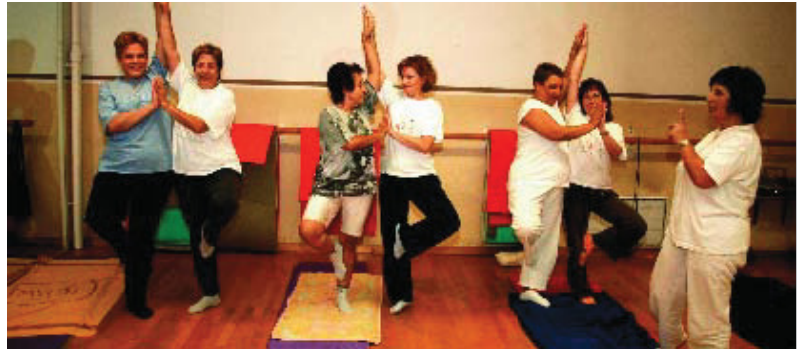
Està semiespecialitzat en arts plàstiques i fa tallers de fotografia, esmalts, ceràmica...