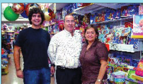
Va ser un dels primers autoserveis de les juguines.