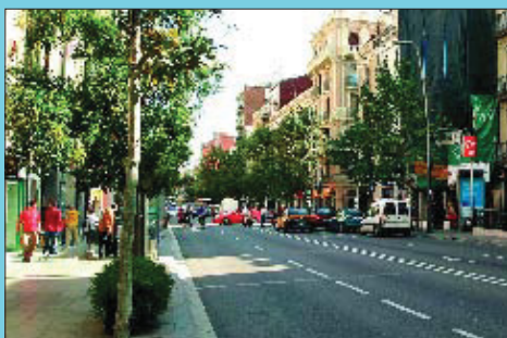
Ara El mateix tram del carrer sense neu, però amb la mateixa activitat comercial de sempre.