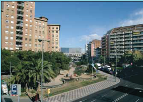
Ara Amb la desaparició del tren i els tramvies, el metro de la línia 5 va arribar a la plaça.