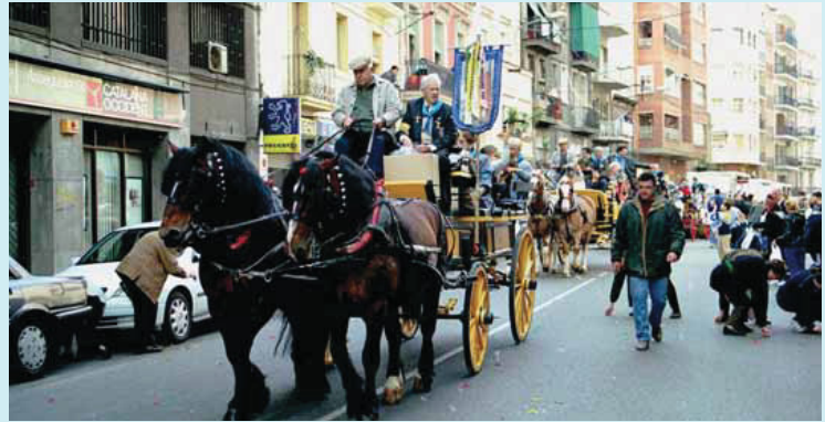
Desfilada de Sant Medir per un dels carrers de Sants.

La Federació de Colles de Sant Medir de Barcelona aplega 29 colles: cinc de Sarrià-Sant Gervasi, una de Sants i la resta de Gràcia