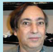
Josep Ll. Clarà Botiga roba

És clar, quan surt el sol surt per a tothom, això és bo. Crec que s'hauria de millorar el tema de la neteja. Per a nosaltres, els comerciants, és un tema fonamental.