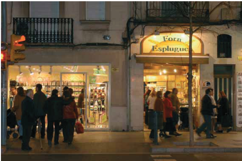
La marca 'Sants Comerç' s'estendrà més enllà del conegut eix Sants-Creu Coberta.