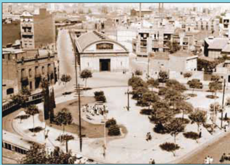
Abans La plaça l'agost de 1952, amb l'estació de RENFE i els tramvies que hi tenien l'origen.

Si té fotografies o documents del seu barri, en pot fer donació a l'Arxiu Municipal del Districte, 93 332 47 71