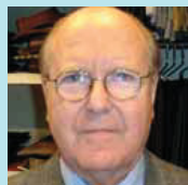
Enric Ricart Sastreria

Hi ha anys més bons i d'altres de més dolents, però Creu Coberta té bona salut. Oferim un servei de qualitat i tracte personalitzat, la qual cosa ens diferencia de les grans superfícies.