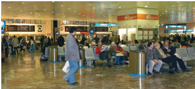
La circulació de trens no es veurà afectada fins a finals d'aquest any.

Menció a part mereix el cobriment de les vies al seu pas per Sants. Els veïns que en reclamaven el soterrament total admeten una solució similar a l'adoptada en la cobertura de la ronda del Mig a Badal. Agrupats en una coordinadora que vigila els treballs, exigeixen, però, que la solució definitiva "no enterrí la possibilitat futura d'un soterrament".