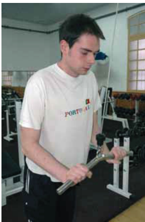
És també un lloc per treure adrenalina.

"Als col·legis -diu Simó- els tenim una gran devoció i som els primers a promoure activitats esportives entre els centres del barri, i els nostres equips de natació i waterpolo es nodreixen d'aquesta canalla".