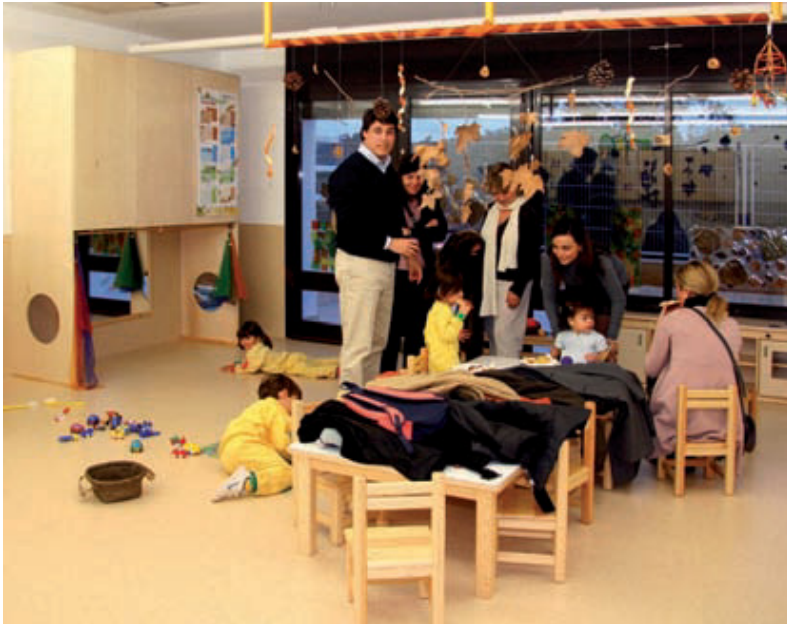
L'escola bressol La Puput, el dia de la inauguració.