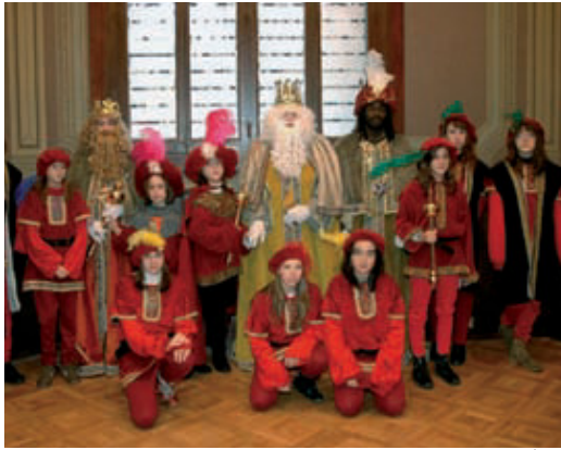
Recepció als Reis Mags a la seu del Districte de les Corts.

J a fa dies que les olors dels dolços nadalencs, els carrers il·luminats i les cançons tradicionals ens anuncien l'arribada de les festes. Un any més, Sarrià-Sant Gervasi viu el Nadal a tots els equipaments del districte, on s'han organitzat activitats per a tota la família. Fires artesanals, concerts de Nadal –com el de l'Orquestra de la Cambra Catalana al centre cívic Pere Pruna–, activitats infantils o representacions teatrals són algunes d'aquestes propostes.