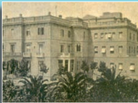
Imatge de l'edifici de la Clínica Plató els anys vint del segle passat.

Si té fotografies o documents del seu barri, en pot fer donació a l'Arxiu Municipal del Districte, 93 256 27 22