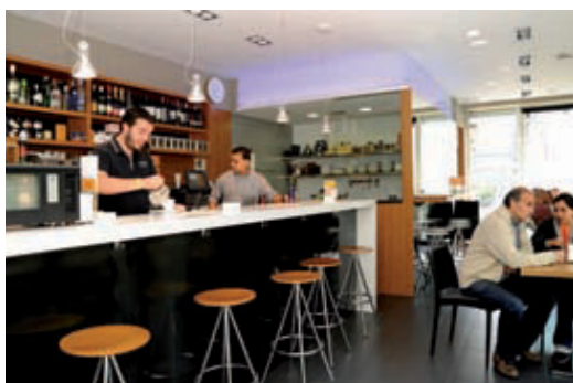
Ofereixen qualitat a preu raonable.