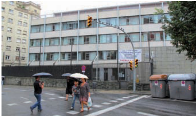
L'Escola Oficial d'Idiomes s'ha instal·lat a l'antic institut Gal·la Placidia.