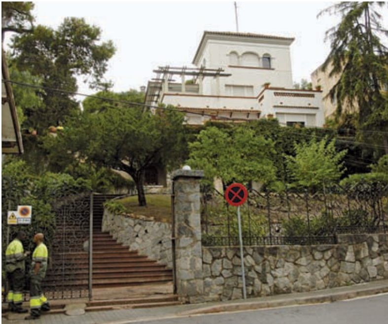
La casa que allotjarà l'equipament es troba al costat del parc del Putget.

El futur equipament de barri del Putget s'ubicarà en una casa enjardinada situada al carrer Manacor número 1, la qual des de fa poc és propietat de l'Ajuntament de Barcelona