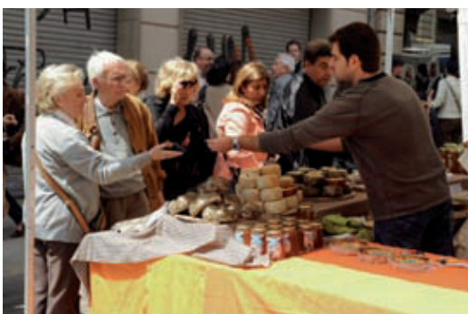
Els comerciants de Sarrià donaran a conèixer els seus productes.