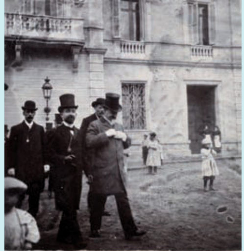
Imatge cedida a l'Arxiu Històric del Districte.

Una fotografia de l'àlbum familiar pot ser un valuós document històric. El paisatge de fons d'un retrat ofereix informació sobre com era un carrer, quina fesomia presentava un edifici determinat, o si un indret estava o no construït en el moment en què es va prendre la imatge. Per aquesta raó, el fet de fixar un dibuix tan precís com sigui possible de com era el districte en èpoques passades implica d'una manera molt directa tots els veïns. Aquest és el sentit de la campanya de recollida de material gràfic (fotografies, pel·lícules i dibuixos) engendrada pel Districte, i que engloba la recerca, classificació i estudi dels documents rebuts. Tothom que disposi d'aquest tipus de material i vulgui compartir-lo a fi de contribuir a aquest exercici de memòria històrica, pot aportar-lo per a la seva digitalització. Només cal que truqui al telèfon 93 291 52 81. El document serà tornat