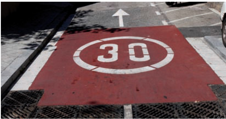
Zona 30 a l'àrea compresa entre el carrer Balmes, la Via Augusta i la ronda del Mig.

torn dels centres educatius, especialment del denominat sector "Monterols", és a dir, entre els carrers Balmes, Via Augusta i ronda del Mig. Aquestes actuacions van ser, ara fa un any, un dels compromisos del Districte davant del Consell Escolar de Sarrià-Sant Gervasi. En aquest sentit, s'ha avançat en la senyalització del sector com a Zona de velocitat màxima a 30 km/h, l'ampliació de la senyalització vertical de zones escolars, la instal·lació d'aparcaments per a bicicletes, la protecció de voreres en trams de carrer amb alta concentració d'alumnes, la instal·lació de fitones, la redistribució de les places d'aparcament per optimitzar l'ús de l'espai públic, la reprogramació semafòrica o la construcció de plataformes d'alumnes de les voreres allà on cal fer-ho. Ara, amb el nou document presentat, les mesures s'ampliaran a altres punts del districte.