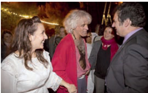
L'alcalde Jordi Hereu (a la dreta) saluda els actors.