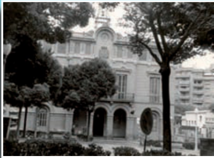
L'Ajuntament de Sant Gervasi de Cassoles.

Si té fotografies o documents del seu barri, en pot fer donació a l'Arxiu Municipal del Districte, 93 256 27 22