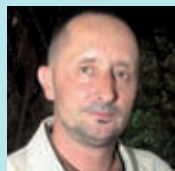
Carles Guri Informàtic

És una necessitat. És molt important el centre cívic, perquè no en tenim cap al barri, i també és important com a accés del parc del Putget.