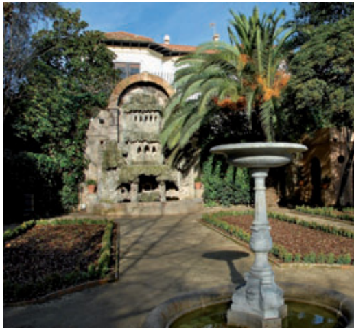
Un dels racons dels renovats jardins de la Tamarita.