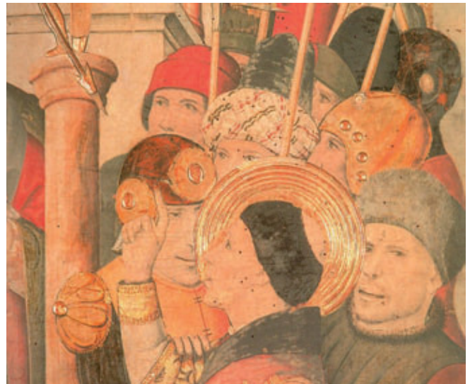
Detall del retaule.

sardo, pintor que va treballar sobretot a l'illa de Sardenya. En construir-se el nou temple parroquial, al final del segle XVIII, es va encarregar un retaule