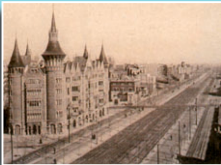
La Casa de les Punxes és un dels edificis emblemàtics de la Diagonal.

Si té fotografies o documents del seu barri, en pot fer donació a l'Arxiu Municipal del Districte, 93 256 27 22