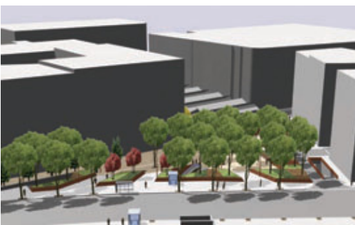
Imatge virtual de com quedarà la futura plaça de Joaquim Folguera.