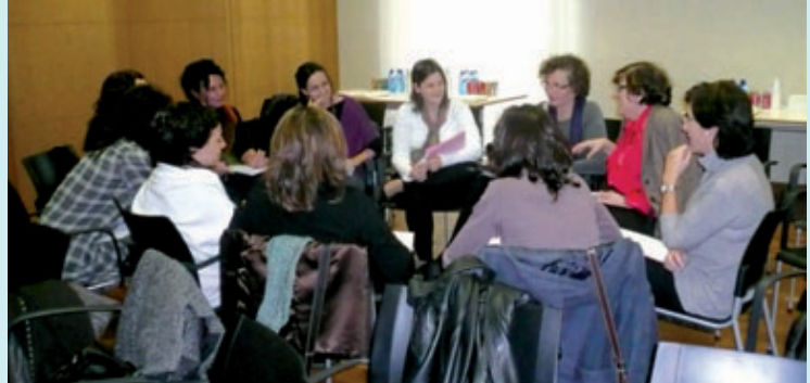
Un moment de l'última reunió de la Xarxa, el mes de desembre passat.

Sarrià-Sant Gervasi disposa d'una xarxa creixent de professionals i centres dedicats a infants i joves amb l'objectiu de millorar la seva qualitat de vida