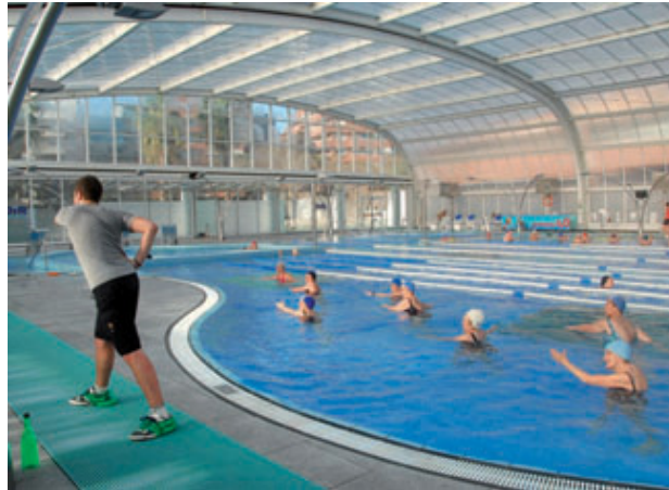
Activitat aquàtica a la piscina del poliesportiu DIR Diagonal.