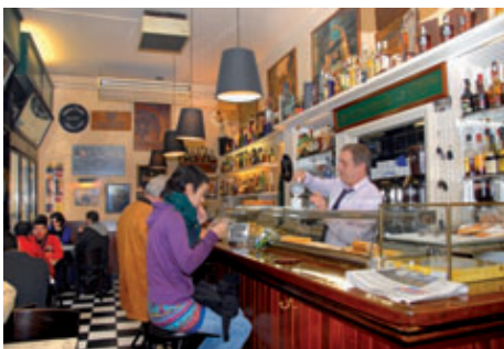
El Marcel és un bar on s'està molt bé a totes hores.