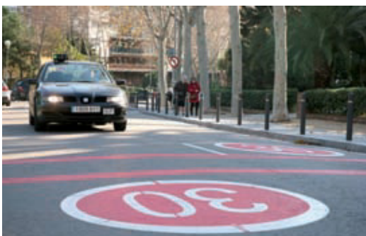
Les zones 30 s'anuncien amb senyals pintats al terra.