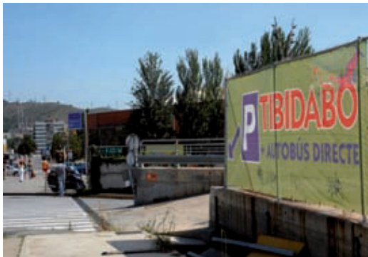
Entrada al pàrquing de la ronda de Dalt.

L'entorn del parc d'atraccions s'està remodelant per fer-ne una zona d'esbarjo per als vianants i els ciclistes. També s'hi eliminen totes les places d'aparcament