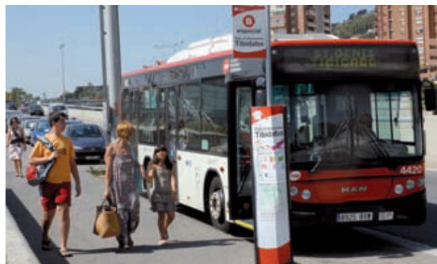
Parada de l'autobús al costat de l'aparcament de Sant Genís.

S'acaben les llargues caravanes de vehicles per accedir al cim del Tibidabo. Els carrers d'accés a la muntanya deixaran de funcionar com a aparcament incívic i es convertiran en un lloc de passeig tranquil per als ciclistes, excursionistes i visitants del parc de Collserola després de les obres de remodelació que han començat aquest estiu. A partir d'ara, pràcticament només els nuvis que celebrin el seu casament al temple podran accedir-hi en vehicle privat. La resta de visitants hi podran pujar en transport públic –amb el funicular o el Tibibus– o deixant el vehicle estacionat a l'aparcament municipal de Sant Genís, a la sortida 5 de la ronda de Dalt.