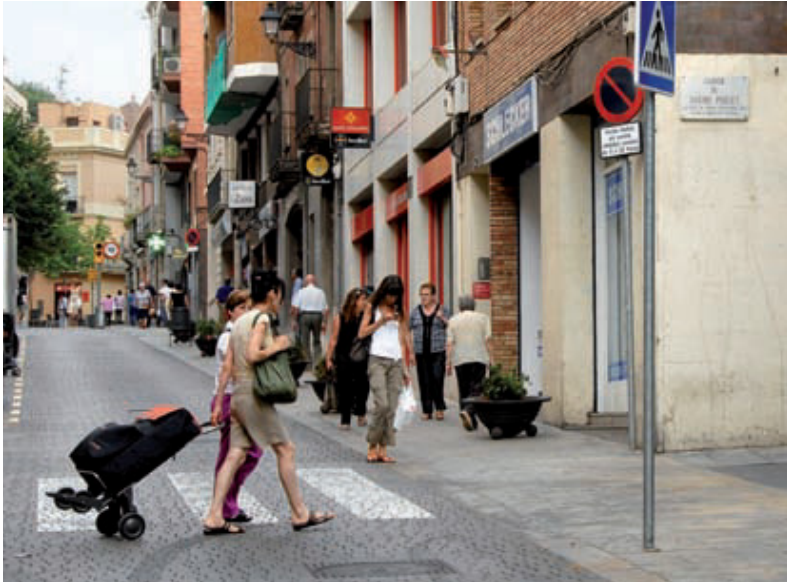
El carrer Major de Sarrià és una de les principals artèries del barri.

A l'àrea formada pel carrer Major de Sarrià, entre les places Artós i Sarrià, i els carrers adjacents, només hi poden entrar els cotxes de residents. El carrer guanya tranquil·litat i seguretat