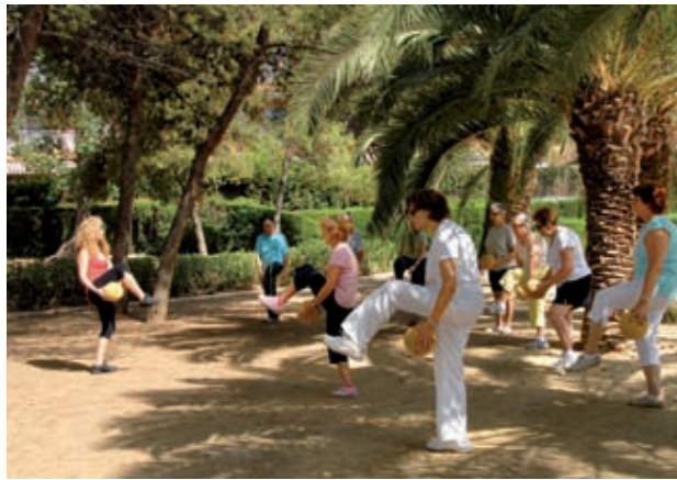
Usuaris practicant exercicis de motricitat.