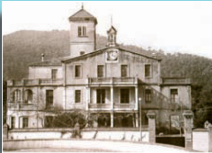
Imatge de Vil·la Joana, casa on va morir Verdaguer el 10 de juny de 1902.

Si té fotografies o documents del seu barri, en pot fer donació a l'Arxiu Municipal del Districte, 93 256 27 22