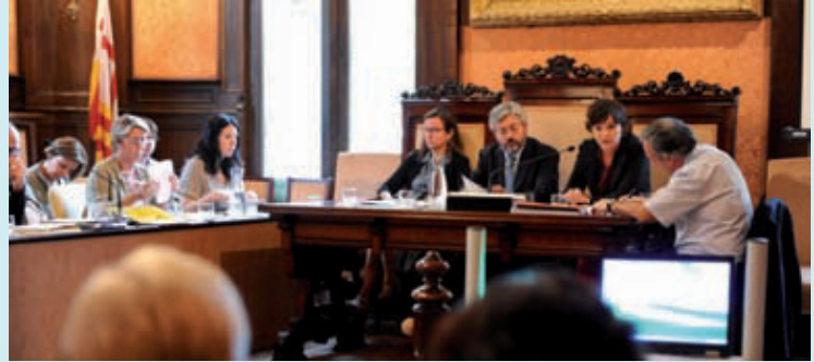
Un moment del Ple del mes de juliol.

Entre altres coses, al Ple del Districte es va presentar el Pla de treball per donar més seguretat a l'entorn de Monterols, zona amb una densitat important d'escoles