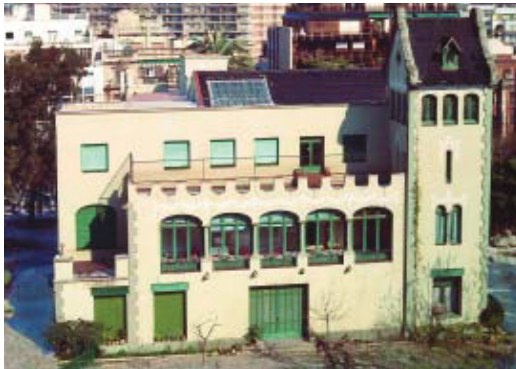
Vil·la Florida l'any 1975.

Vil·la Florida s'especialitzarà en activitats relacionades amb la cura del cos, la medicina natural i les teràpies alternatives, a les quals també estarà dedica-