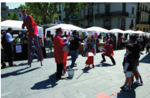
La mostra es fa l'anucli antic de la Vila.