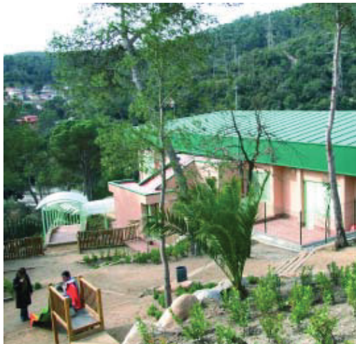
Aspecte de les renovades instal·lacions exteriors de l'escola.

El Centre d'Educació Especial Municipal (CEEM) Vil·la Joana va estrenar el passat 24 de febrer les seves noves instal·lacions, uns espais i un entorn a tocar del parc de Vallvidrera, perfectament adaptats a les característiques educatives i a les necessitats del seu alumnat. La rehabilitació del centre, que ofereix atenció a infants amb discapacitat d'entre 5 i 18 anys, compta amb una superfície construïda total de 3.105 m 2 repartits en espais tan diversos com una mediateca, aules d'informàtica i música, un poliesportiu, un taller de cuina o una fusteria, tal com va poder constatar en la seva visita inaugural el conseller d'Educació, Ernest Maragall, el qual va assistir al centre acompanyat de la regidora del Districte, Katy Carreras-Moysi, i la regidora d'Educació, Montserrat Ballarín. L'escola, que depèn de l'Institut d'Educació de l'Ajuntament (IMEB), és un centre emblemàtic pel que fa a l'educació especial a la ciutat. Durant els seus més de