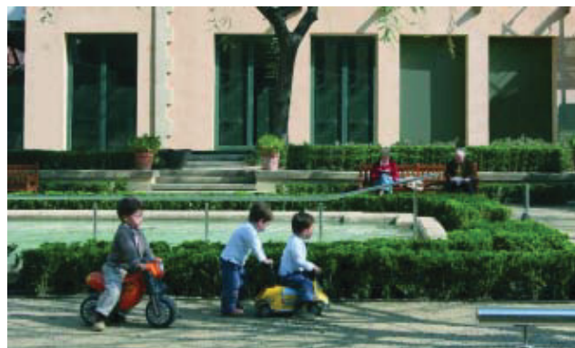
La cuina sana, especialment l'adreçada als infants, hi tindrà un gran protagonisme.

La remodelació de la Vil·la Florida ja s'ha acabat. L'antiga masia del segle XVIII s'ha transformat en un nou centre cívic que començarà a funcionar aviat. A hores d'ara s'està ultimant la programació del centre, on hi haurà un lloc destacat per a la cuina sana, especialment l'adreçada als infants. Amb aquesta finalitat, Vil·la Florida disposa d'una aula equipada per fer cursos de cuina i adaptada per a nens i persones discapacitades. En el moment de tancar aquesta informació, estava prevista una jornada de portes obertes al nou centre cívic el 31 de març, tot coincidint amb la cloenda de l'Any del Comerç i amb la 10a Mostra de Comerç de Sant Gervasi.