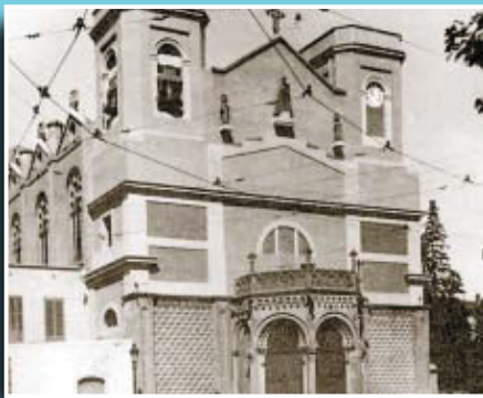
Imatge de l'antiga església de la Bonanova enderrocada el 1937.

Si té fotografies o documents del seu barri, en pot fer donació a l'Arxiu Municipal del Districte, 93 256 27 22