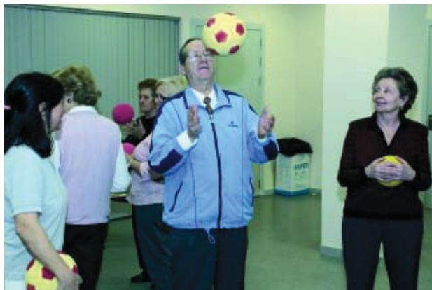
A les activitats s'hi poden apuntar també no associats.

La coordinadora d'activitats físiques explica que "totes les nostres activitats no només s'organitzen per als nostres associats. Moltes ve-