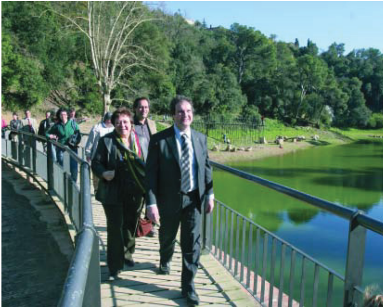
Amb les milliores efectuades es pot passejar per la zona amb més comoditat i seguretat.