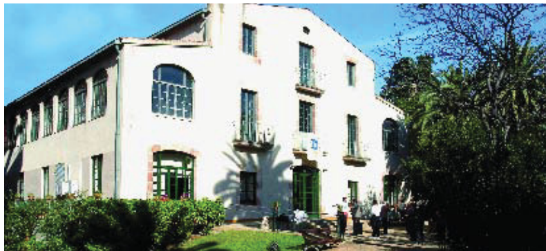
El casal de gent gran Can Castelló.

de febrer. El document de treball, que comença definint què és el Pla d'Equipaments i els objectius que persegueix dintre del Pla d'Actuació Municipal per al districte, inclou un plànol amb la situació dels equipaments actuals per facilitar les futures ubicacions de manera regular i d'acord amb la població de cada barri. I amb l'objectiu de treure el màxim profit de tots els recursos que hi ha a la ciutat, també es revisarà quins són els equipaments que hi ha en els barris que toquen els de Sarrià-Sant Gervasi i que estan més a l'abast perquè s'hi desplacin les persones que hi viuen a prop. El procés participatiu s'articlarà en reunions sectorials, amb tres equips de treball diferents: cultura, educació i social, i en trobades territorials, de les quals es farà una per a cada un dels barris: Vallvidrera, Sant Gervasi i Sarrià. Totes les reunions tindran lloc els dies a la tarda.