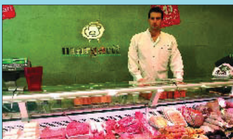
Xarcuterias Margarit tenen fins a 6 establiments al districte.