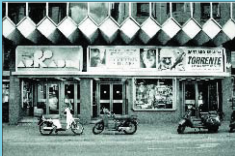
Abans El cinema Arkadín, poc abans del seu tancament.

Si té fotografies o documents del seu barri, en pot fer donació a l'Arxiu Municipal del Districte, 93 205 41 04