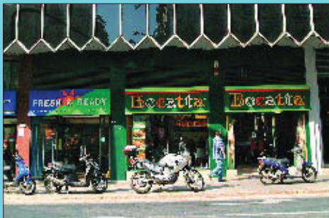
Ara El local, que havia estat dedicat al teatre i al cinema, avui alberga un establiment de menjar ràpid.