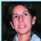
Nati Simó Informàtica

Me parece muy bien, sobre todo la zona dedicada a la podología. Pude leer información sobre el parque en la prensa y la idea me parece muy acertada.