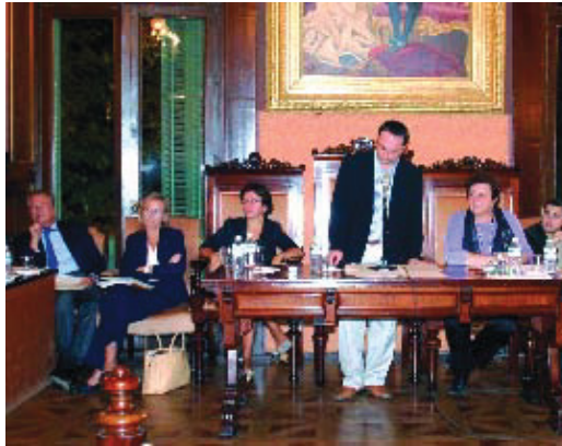
El Plenari es va celebrar el 3 d'octubre.