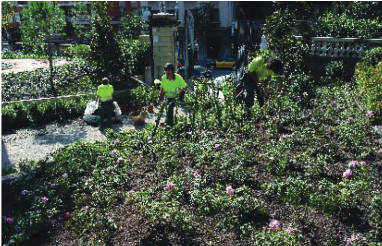
El jardí s'ha replantat amb rosers i arbustos.