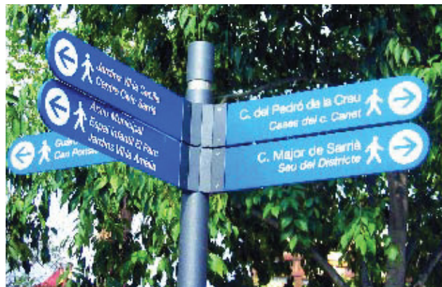
Detall de la nova senyalització.

Caminar és un dels mitjans de transport més ràpid, efectiu, fàcil i saludable per traslladar-se en distàncies curtes, i més si es tracta de zones urbanes i nuclis antics. Per demostrar-ho, el Districte de Sarrià-Sant Gervasi ha instal·lat un seguit de senyals al nucli antic del barri de Sarrià, tot indicant diversos recorreguts per a vianants a l'illa compresa entre el passeig de Reina Elisenda, l'avinguda Foix, el carrer de Francesc Carbonell i la Via Augusta. És una zona molt ben comunicada per transport públic en el seu perímetre i per això s'ha volgut donar preferència als vianants en el seu interior. En total s'hi han instal·lat tretze senyals que indiquen llocs d'interès històric i arquitectònic.