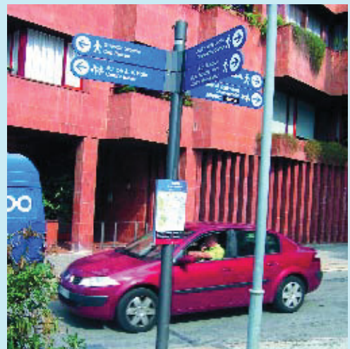
Senyal que indica el Camí Escolar de Sarrià.

El Districte ha marcat aquesta illa del nucli antic de Sarrià amb tretze senyals que hi indiquen llocs d'in-