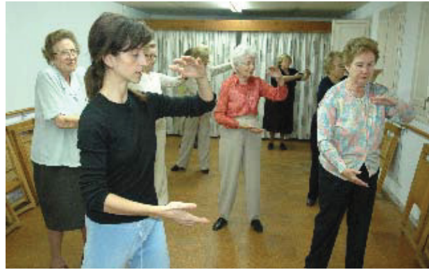
Un grup de usuàries fent exercicis suaus de manteniment.