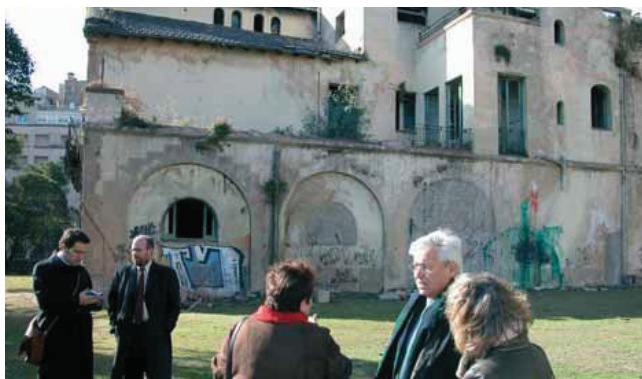
L'alcalde, Joan Clos, va explicar la futura conversió d'aquesta finca en equipament.

Vil·la Florida, l'antiga Escola de Puericultura, obrirà a l'estiu la primera zona verda amb un itinerari terapèutic de Barcelona. L'itinerari permetrà fer un passeig a peu nu sobre matèries naturals i gaudir així d'un massatge als peus. El jardí forma part del projecte de rehabilitació de la finca -situada a l'illa compresa entre els carrers Muntaner, Bisbe Sivilla, Sant Gervasi de Cassoles i Reus-, després de quinze anys d'abandonament. El projecte transformarà aquesta masia del segle XVIII en un equipament públic especialitzat en medicina natural i teràpies alternatives, que allotjarà un centre cívic i la biblioteca del Districte.