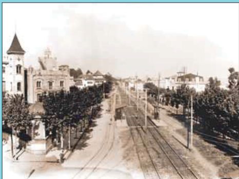
Abans La primitiva estació, al mig d'una Via Augusta, ocupada pel tren.

Si té fotografies o documents del seu barri, en pot fer donació a l'Arxiu Municipal del Districte, 93 205 41 04