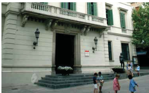
L'antic ajuntament de Sarrià, actual seu del Districte.

S'acaba de publicar el llibre Govern i territori , editat per l'Arxiu Municipal del Districte de Sarrià-Sant Gervasi, que recull una singular visió de l'administració pública, especialment dels conceptes relacionats al govern local en la història de la ciutat de Barcelona. Aquesta publicació mostra, a través dels esdeveniments més significatius, l'evolució de la història política i de les diverses institu-