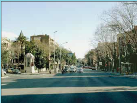
Ara El ferrocarril està soterrat i la Via Augusta està envaïda per milers de vehicles.