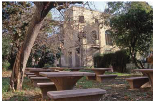
Els jardins de Vil·la Florida seran d'ús públic aquest estiu.

El parc forma part de la rehabilitació de la Vil·la Florida, que allotjarà un centre cívic i una biblioteca especialitzats en medicina natural i teràpies alternatives