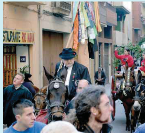
Una de les recents desfilades de Sant Medir.

El 3 de març, les 29 colles que integren la Federació de Colles de Sant Medir de Barcelona pujaran en romeria a l'ermita dedicada a aquest sant, situada a la Vall de Gausac, a prop de Sant Cugat del Vallès. Continuen així una tradició que suma ja 175 anys i que té l'origen a la romeria que va fer, el dia de Sant Medir d'un any entre el 1830 i el 1840, el flequer de Gràcia Josep Vidal i Granés. No es coneix el motiu d'aquella peregrinació –potser una promesa feta al sant pel guariment d'una malaltia– però sí que el flequer hi va anar a cavall i repartint lllaminadures fetes al seu forn. L'any següent el va acompanyar la seva família, més tard els amics i veïns, i a poc a poc es van anar formant les colles. El 1950, els presidents de les colles van decidir agrupar-se en una federa-