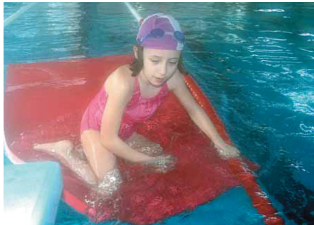
La natació pot ser un vehicle d'inserció per a nens amb discapacitat.

E l Club Minusvàlids Horitzó és una entitat sense ànim de lucre dedicada exclusivament a la promoció de l'esport adaptat per a persones amb qualsevol tipus de discapacitat, tant física com psíquica. Fundada el 1994, i amb seu a Rubí, vol ampliar les seves fronteres i estendre les seves activitats a Barcelona. Inicialment ho fa a la institució Neuro-Psico-Pedagògica GURU de Sarrià-Sant Gervasi, on promocionen la natació.