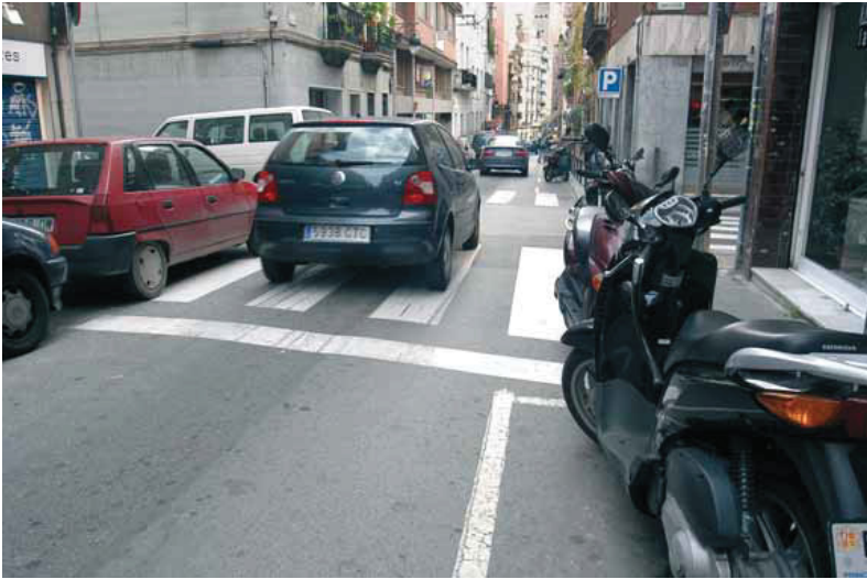
Les obres començaran abans de l'estiu per estar enllestides a l'inici de 2006.

Abans de l'estiu començaran les obres als carrers Saragossa, Septimània, Francolí i Santjoanistes. Els treballs serviran per reforçar el caràcter de nucli antic que té el barri del Farró