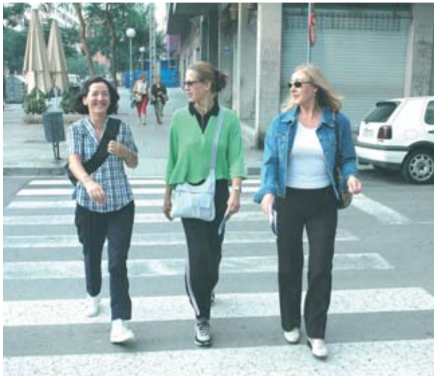
Les caminades urbanes han aconseguit aplegar més de 5.000 barcelonins.

L'èxit d'aquestes caminades, anomenades Barnatresc es deu a tres activitats que comencen per la lletra "C": Caminar, Civisme i Cultu-