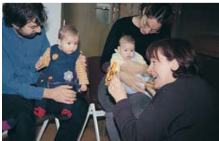
El curs estimula les seves capacitats cognitives.

Aquest mes de novembre s'inicia una nova edició de "Ballmanetes" i "Arri, arri, tatanet", els cursos de música per a nadons de 2 a 10 mesos i d'11 a 18 mesos, respectivament, que estimulen les seves capacitats cognitives. Aquests cursos tenen una durada de sis setmanes i es realitzen cada divendres a l'Escola Municipal Can Ponsic (Av. J. V. Foix, 51).