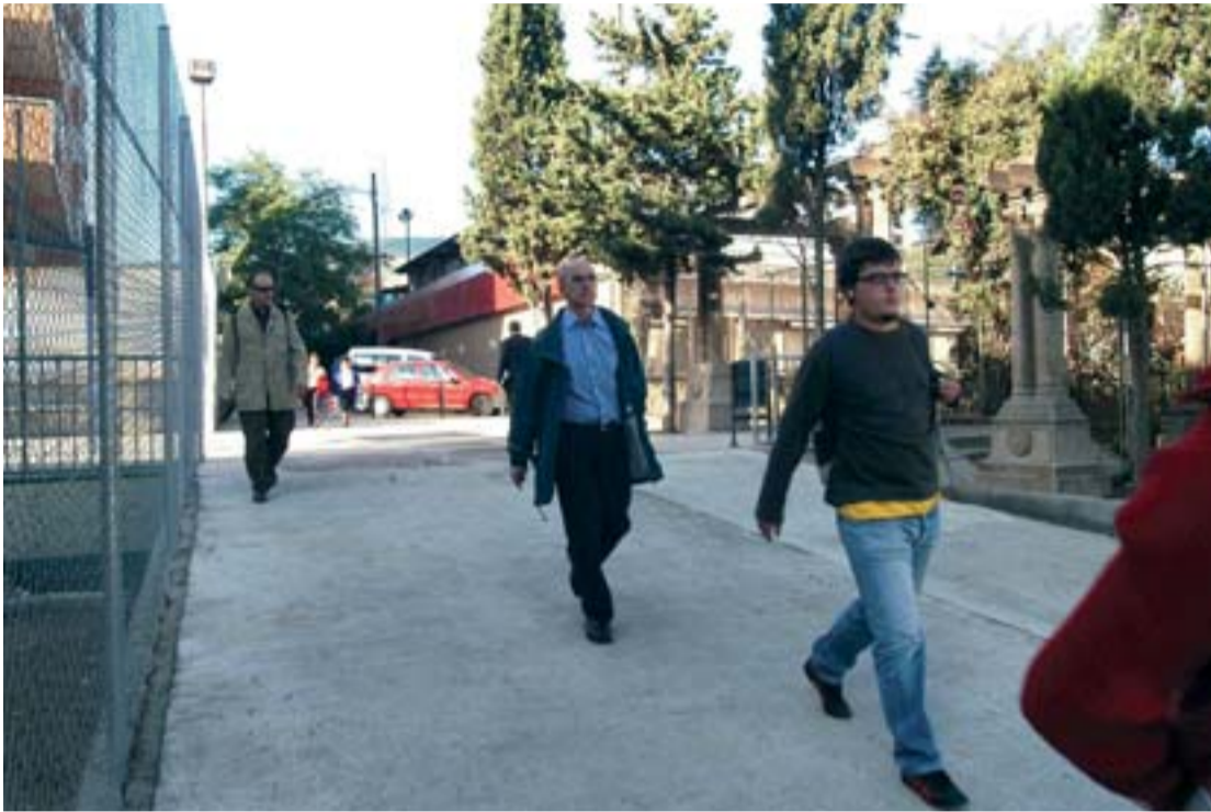
Ara molts veïns no han de fer volta per accedir a l'estació de tren.

Ara és una mica més fàcil accedir a l'estació de FGC. Els veïns de la plaça Sant Vicenç no hauran de fer volta