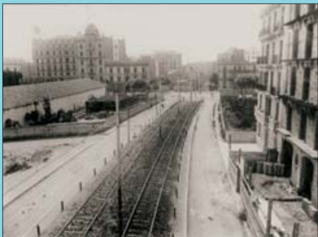
Abans La Via Augusta amb la Diagonal al fons, l'any 1926.

Si té fotografies o documents del seu barri, en pot fer donació a l'Arxiu Municipal del Districte, 93 285 03 57