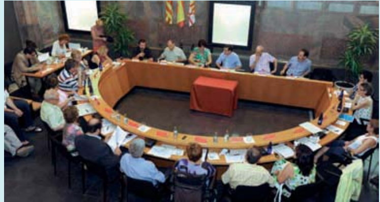
Un moment de l'últim Plenari del Districte.