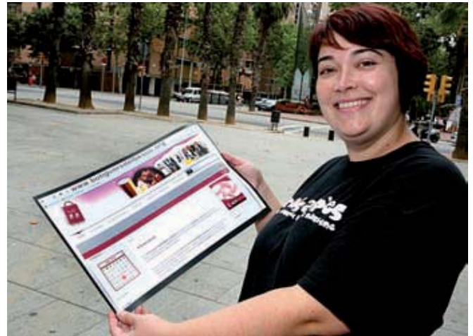
Espada mostra la imatge de la pàgina web de l'Associació de Comerciants del Besòs.

No m'agrada gens això de manar, però les circumstàncies m'hi van obligar, perquè algú havia de tirar el carro i posar-se al davant. En aquells moments, la manca d'unió del comerç