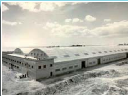
Imatge de la cotxera de Llevant poc abans de la seva inauguració.

Si té fotografies o documents del seu barri, en pot fer donació a l'Arxiu Municipal del Districte, 93 221 94 44