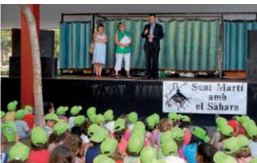
El regidor s'adreça als nens i nenes assistents a la festa.