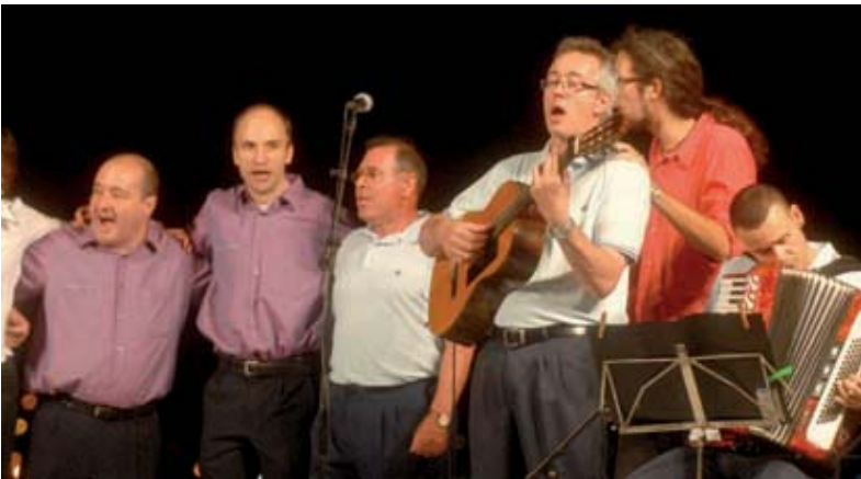
Els tres grups van interpretar junts la coneguda havanera "El meu avi".

L'actuació musical es va tancar tocades les 12 h, quan la presentadora va preparar el públic per veure un castell de focs artificials que va posar el punt i final a aquesta nit de celebració estival.