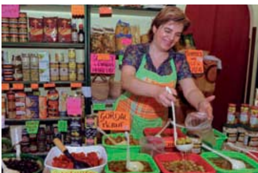
Tenen gran varietat de productes selectes.