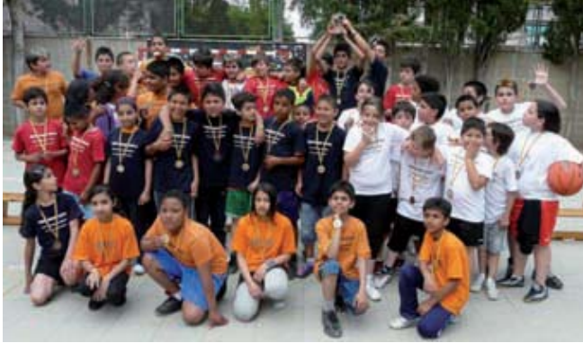
Nens i nenes que van participar al torneig de bàsquet escolar.