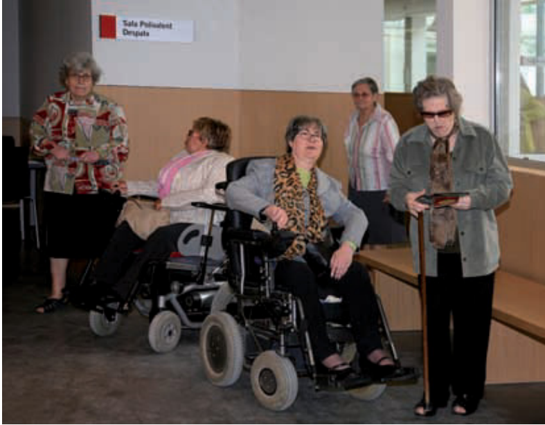
Usuàries del nou casal, el dia de la inauguració.

Situat al centre històric del barri de Poble Nou, s'emmarca en el Pla de Millora per a la Gent Gran. Ha requerit una inversió de 850.147 euros i s'ofereix com a espai a cultural, de relació i trobada per als usuaris