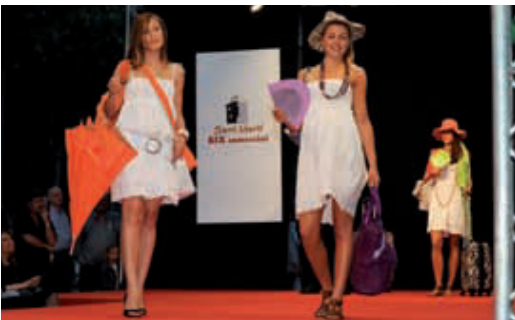
Un moment de la desfilada celebrada el 21 de maig.