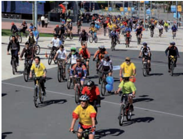
Ciclistes participants en una de les activitats entrant al Fòrum.

Per la seva part, el Bike Show, la fira activa de la bicicleta més important de tot Europa, va oferir diverses activitats relacionades amb el món de la bicicleta i els patins. El cap de setmana va comptar amb un programa ple d'espectacles, exhibicions, tallers, i competicions, que animava tothom a gaudir àmpliament de totes les possibilitats que