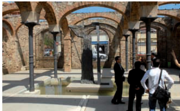
La renovació no modificarà el disseny original del parc.

El recinte del parc del Clot serà totalment renovat, sense modificar el disseny original, per millorar la seva qualitat urbana. Fins al proper mes de febrer del 2011 es duran a terme obres en tres fases durant les quals es millorarà la il·luminació, la pavimentació, la vegetació i el mobiliari urbà, entre d'altres. També seran restaurats els elements arquitectònics i patrimonials d'interès i el carrer Escultors Claperós, en l'àmbit del parc, serà remodelat per consolidar la seva projecció ciutadana. Tot i les obres, el desenvolupament de la Festa Major del Clot-Camp de l'Arpa, al mes de novembre, no es veurà afectada.