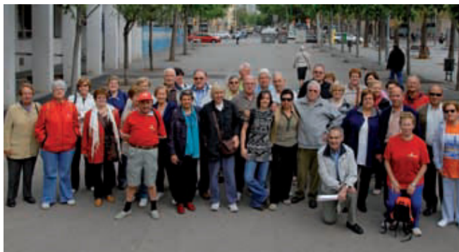
Participants a una de les caminades.