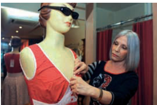
Tenen tant models informals com elegants.