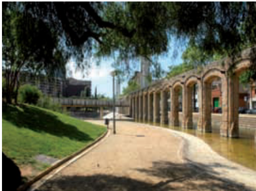
El parc del Clot en l'actualitat.

El regidor del Districte, Francesc Narváez, ha recordat la intensa participació ciutadana que es va produir en el seu moment per definir com havia de ser el parc. "El del Clot ha estat un model de parc amb molt d'èxit. Tant és així que pràcticament no ha calgut tocar-lo en tots aquests anys, tot i que ara necessita aquesta ambiciosa reforma en les seves 3,5 hectàrees de superfície". En paraules de Narváez, és un parc "molt