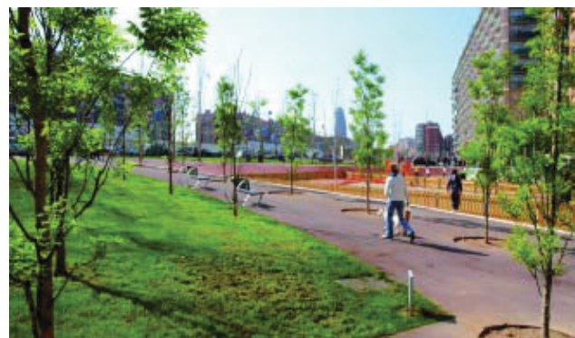
El parc sorgit de la semicobertura de la Gran Via.

L'acord signat entre el Districte de Sant Martí i les associacions de veïns Sant Martí de Provençals, Paraguai-Perú, La Pau, La Palmera i Gran Via-Perú-Espronceda dona veu a les entitats veïnals perquè aportin els seus suggeriments de millora d'aquesta artèria de Barcelona reformada fa ben poc.