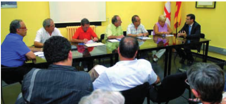
L'acte de signatura de l'acord cívic sobre la Gran Via.

Les associacions veïnals de Sant Martí de Provençals, Paraguai-Perú, La Pau, La Palmera i Gran Via-Perú-Espronedada es comprometen a fomentar el civisme entre els veïns