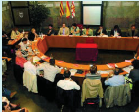
Sessió plenària celebrada el passat 1 d'octubre.