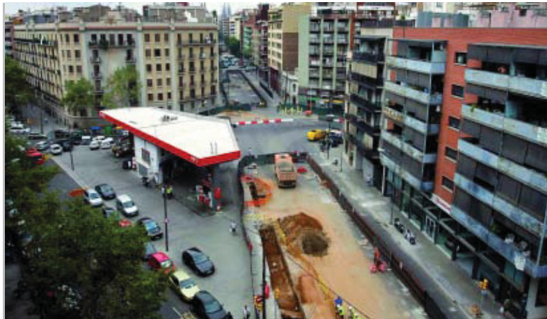
Obres de l'AVE al carrer Mallorca a la confluència amb el carrer Biscaia.