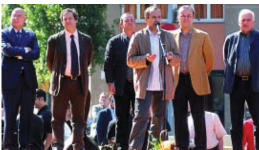
L'alcalde i el conseller de Cultura van assistir a la inauguració.