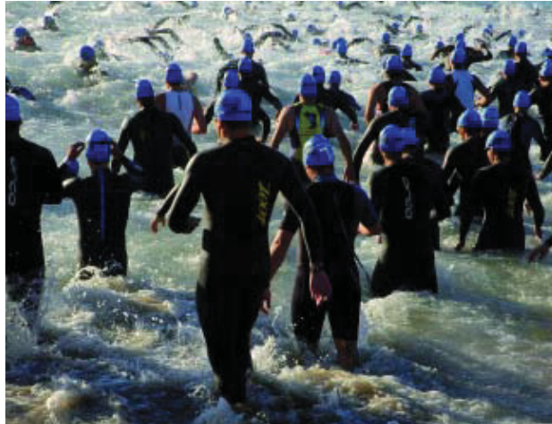
El triatló inclou una prova de natació a la platja de la Mar Bella.

La prova va ser tot un èxit de participació amb més de 2.500 triatletes, tant nacionals com estrangers, molt per damunt dels 400 de l'edició anterior, per bé que queda encara lluny dels 13.000 participants del triatló de Londres, la prova més multitudinària del món. Nedar, muntar en bicicleta i córrer a peu, una prova per a superatletes que va convertir el litoral i els carrers de la ciutat en tot un espectacle esportiu en un dia acompanyat per un temps esplèndid. Molta va ser la gent que es va acostar al Front Marítim i va omplir els carrers per on passava la prova per animar els participants i aplaudir el seu esforç. En aquesta edició del triatló carre-