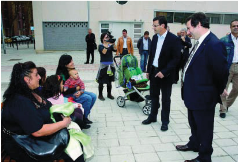
L'alcalde acompanyat pel regidor del Districte, durant la festa per celebrar la finalització de les obres.

La inversió realitzada en els últims anys arriba fins a prop dels 20 milions d'euros en obres de millora de l'espai públic, a més de 12 milions d'euros que s'inverteixen en actuacions de millora dels habitatges del barri