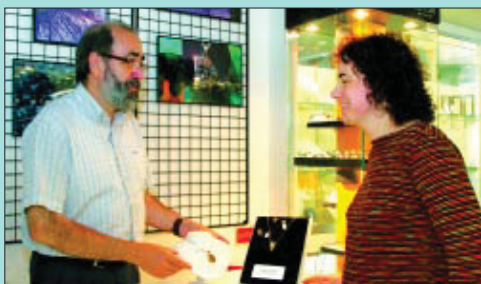
La joieria Gol s'ha orientat a vendre dissenys propis.