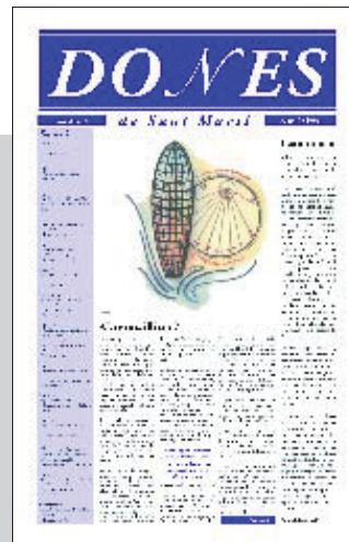
Portada d'un dels números del diari "Dones".

Dones de Sant Martí es publica un cop l'any. Cada número està dedicat a un tema, el qual trien les dones integrants del consell de redacció del diari. El número del 2007 parla de les llibertats. En números anteriors, les dones de Sant Martí han abordat la conciliació de la vida familiar i laboral, la immigració, la convivència o la sexualitat.