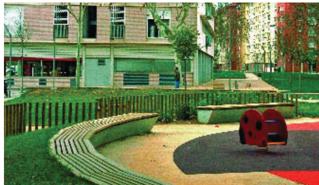
La Via Trajana compta ara amb noves àrees de joc infantil.

El tram final de Via Trajana, fronterer amb Sant Adrià del Besòs, s'ha renovat completament amb noves zones enjardinades i nous vials que permetran millorar la qualitat de vida dels seus veïns i veïnes i facilitaràn els accessos a la resta del barri. Una de les actuacions més destacades és la construcció d'una zona d'estada de 250m 2 que destinarà part del seu espai a parc infantil, que serà molt a prop del casal infantil i la llar d'infants. També s'han habilitat camins de connexió entre els blocs d'habitatges, envoltats de vegetació i bancs de fusta per facilitar el descans i la relació entre el veïnat. D'altra banda, s'ha renovat l'enllumenat, el mobiliari urbà i s'han plantat arbres nous.