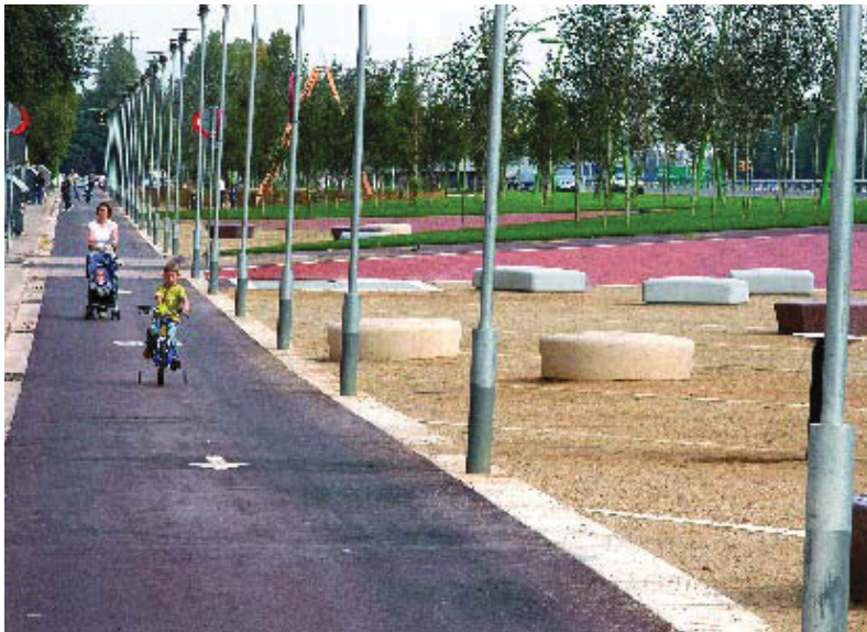
Amb aquesta actuació s'han guanyat unes nou hectàrees de zones verdes i espais lliures.