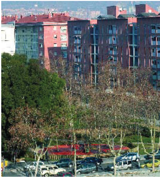
La Via Trajana compta amb noves zones verdes i espais de joc.

Aquesta remodelació de cap a peus ha estat possible gràcies a la col·laboració dels ajuntaments de Barcelona, Sant Adrià de Besòs i la Mancomunitat de Municipis de l'Àrea Metropolitana, i millorarà la