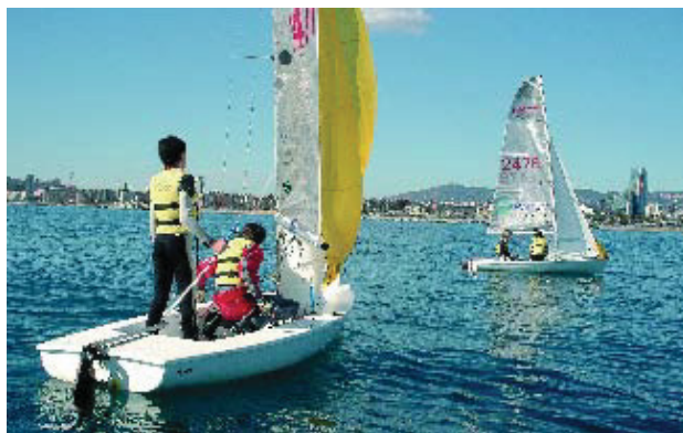
Els nens poden fer un bateig de mar per uns setze euros.

El Centre Municipal compta amb una flota d'unes 60 embarcacions de