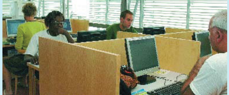
Les noves tecnologies són presents a la major part dels equipaments municipals.