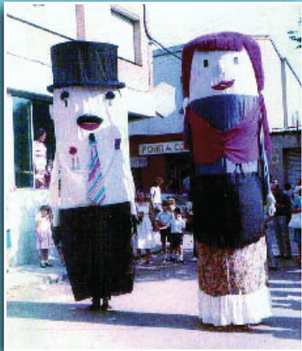
Els primers gegants del Clot, Ell i Ella, en una actuació.

Si té fotografies o documents del seu barri, en pot fer donació a l'Arxiu Municipal del Districte, 93 221 94 44