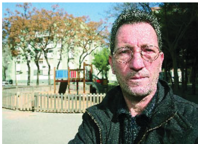
A Hornos li agraden les zones verdes, els arbres i l'espai del barri.

Aquest és un barri molt lluitador. Ara fa 25 anys ni els taxis hi volien venir. Després de les obres del Fòrum, que van obrir el barri al mar, la connexió entre Sant Martí i Sant An-