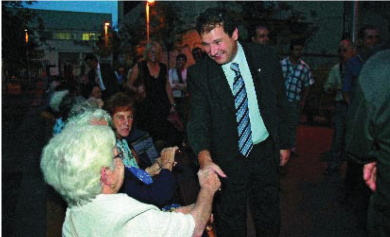
L'alcalde, Jordi Hereu, durant la inauguració de les reformes del carrer Marià Aguiló.

L'augment significatiu de carrers amb plataforma única per a ús prioritari dels vianants i de les zones verdes proporcionen una millor qualitat de vida al veïnat