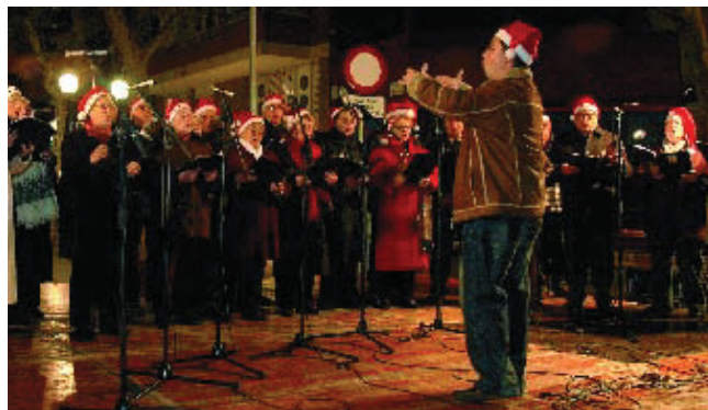
Cantada de nades de les corals dels casals de gent gran.

Per segon any consecutiu, el districte de Sant Martí ha celebrat la campanya de Nadal Solidari. Enguany, l'espai escollit per celebrar plegats la recollida d'obsequis destinats a la gent gran que ho necessita dels barris de Sant Martí va tenir lloc el passat 18 de desembre, a la rodona de la rambla del Poblenou, davant del Casino L'Aliança. Un dels moments més emotius de la vetllada, amenitzada amb actuacions musicals a càrrec de les corals dels casals de gent gran Joan Maragall, Taulat-Can Saladrigas, Paraguai-Perú, de la ludoteca Maria Gràcia Pont i de l'Agrupació Musical del Taxi, fou la cantada de nades.