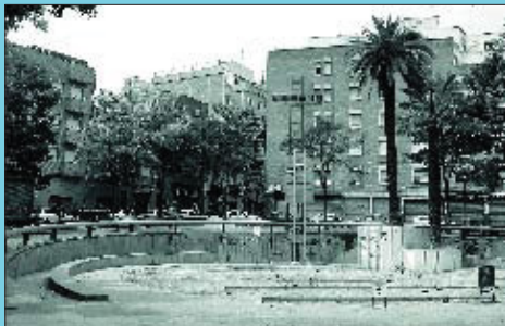
La plaça amb dos nivells, inaugurada el 1986 i que durant molt de temps va tenir una barra a l'estil bombers per on lliscaven els joves del barri.

Si té fotografies o documents del seu barri, en pot fer donació a l'Arxiu Municipal del Districte. T. 93 221 94 44