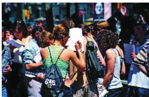
Els joves són un dels objectius del projecte premiat.