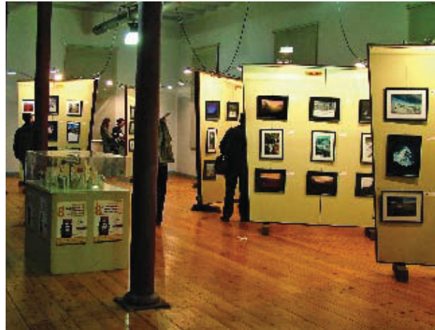
Imatge d'una exposició d'una edició anterior.

Per a Manel Garcia, "el fet que sigui una exposició oberta al públic també compleix un dels objectius: la divulgació, el coneixement i la dina-