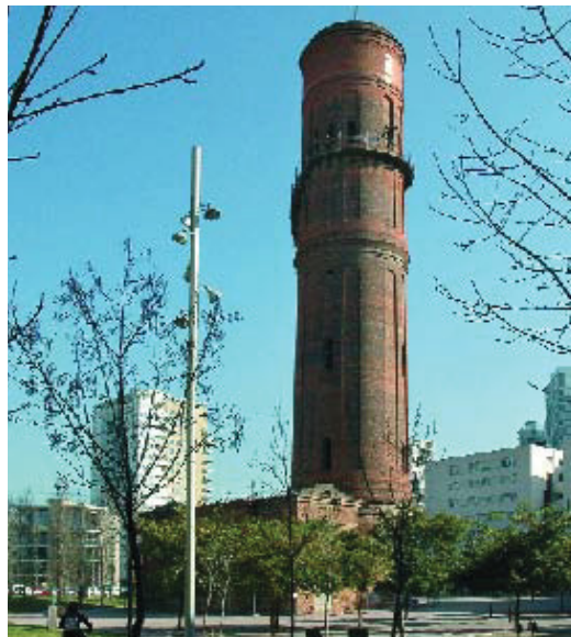
Imatge actual de la torre.

El passat dia 9 de febrer, l'Ajuntament de Barcelona i Agbar van signar un conveni per a la restauració de la Torre de les Aigües de Sant Martí, autèntic testimoni de la industrialització a Catalunya. La coneguda com a Torre de Can Girona (companyia que passà a ser propietària de l'edifici el 1922) és també un exemple notori de l'enginyeria civil del final del segle XIX: l'anomenada "torre d'aigua" és un tipus d'edifici molt comú d'aquella època que respon al creixement de les ciutats i a l'augment dels usos industrials, fets que requerien un increment del subministrament d'aigua. El seu funcionament és molt senzill: mitjançant una canalització interna s'extreu la matèria primera d'un pou o embassament, s'eleva i es distribueix a pressió utilitzant la força de la gravetat. La Torre de Can Girona, de 67,75 m d'alçada i un diàmetre de 12 m, va ser projectada amb aquesta finalitat cap a 1880 per l'arquitecte