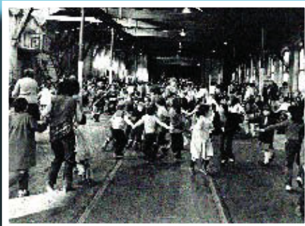
Festa infantil a la nau del Clot durant la Festa Major de 1983.

Si té fotografies o documents del seu barri, en pot fer donació a l'Arxiu Municipal del Districte, 93 221 94 44