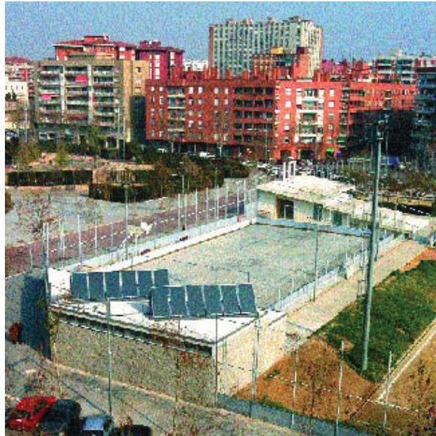
Quatre nous vestidors i plaques solars per a l'aigua calenta a disposició dels usuaris.

Les millores també inclouen la instal·lació de plaques solars per a l'aigua calenta sanitària que complementaran les calderes de gas, que ja existien al complex.