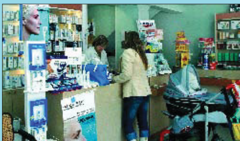
La farmàcia Front Marítim.