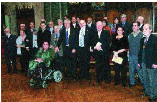
L'entrega de les medalles es va celebrar al Saló de Cent.