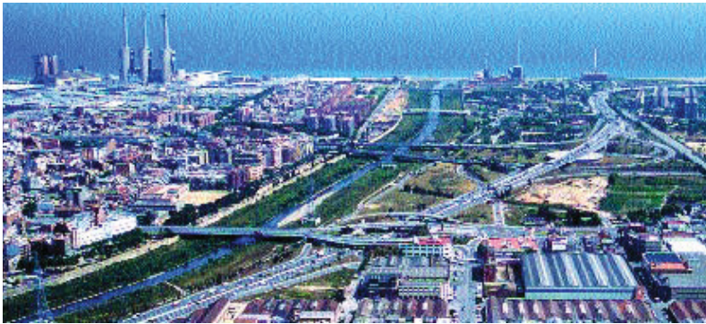
Imatge aèria del barri de la Pau.

El passat 22 de febrer, la històrica data en la qual s'apravà la Carta Municipal de Barcelona al Senat, es va celebrar el Plenari municipal del Districte