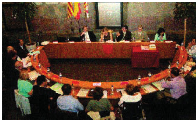
Imatge del Ple del dia 22.

Entre els diversos projectes que van ser aprovats pel Plenari municipal del Districte, celebrat el passat 22 de febrer —el mateix dia que al Senat s'aprovava la Carta Municipal de Barcelona—, hi destaca el pla per instal·lar ascensors als edificis del barri de la Pau. En aquesta zona del districte aixecada ara fa quaranta anys, molts dels seus edificis es van construir sense ascensor, amb tots els inconvenients que això comporta per a molts veïns, sobretot la gent gran. El pla aprovat pel Districte amb la col·laboració de l'empresa ADIGSA garantirà l'ocupació de part de l'espai públic per instal·lar aquests ascensors quan sigui necessari.