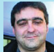
Quim Guillemon Informàtic

Em sembla que és una bona aportació per al barri i ha estat molt ben rebuda pels veïns. Amb tot, encara s'han de crear moltes més places per donar cabuda a tota la demanda.