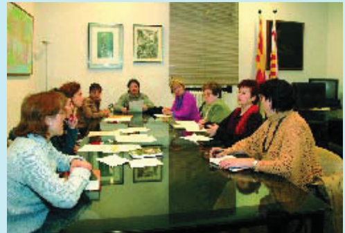
Una de les darreres trobades del Consell, el mes de febrer de 2006.

El seu objectiu és fer que es tinguin en compte les necessitats específiques de les dones i que es progressi en la igualtat entre dones i homes a Sant Martí