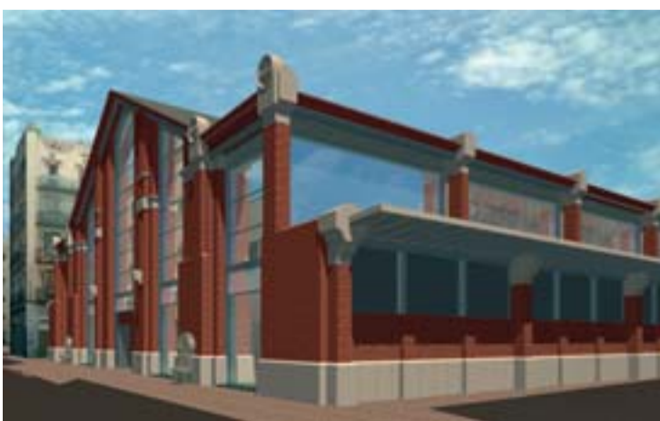
Aspecte que tindrà el mercat quan acabin les obres.

E l mercat de la Unió, situat al bell mig del Poblenou, va ser construït l'any 1889, quan Sant Martí encara era municipi independent. La seva estructura procedeix de l'època de les construccions de ferro del darrer quart del segle XIX. A causa de la seva antiguitat, el mercat necessitava una remodelació integral per transformar-se en un conjunt comercial modern i adaptat a