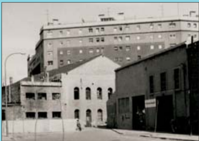
Abans El bloc en els anys vuitanta, des del carrer de Castella, eclipsat per la caldereria de Can Castellet.

Si té fotografies o documents del seu barri, en pot fer donació a l'Arxiu Municipal del Districte, 93 285 03 57