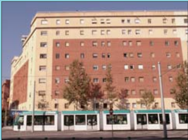
Ara La zona i l'edifici han guanyat qualitat.