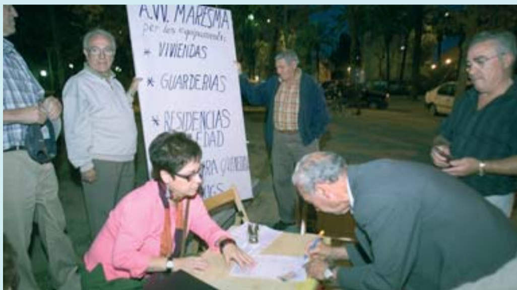
L'Associació de Veïns ha treballat sempre per la millora del barri.