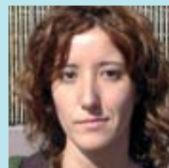
Núria Jariot Informàtica

Me parece que la Farinera ya tiene una buena oferta. A mí me interesan especialmente las actividades de montaña y bicicleta y aquí he encontrado dónde hacerlas.