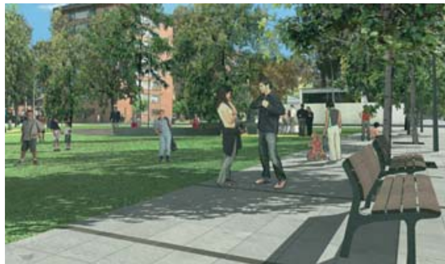
Imatge de com quedarà la Via Trajana.