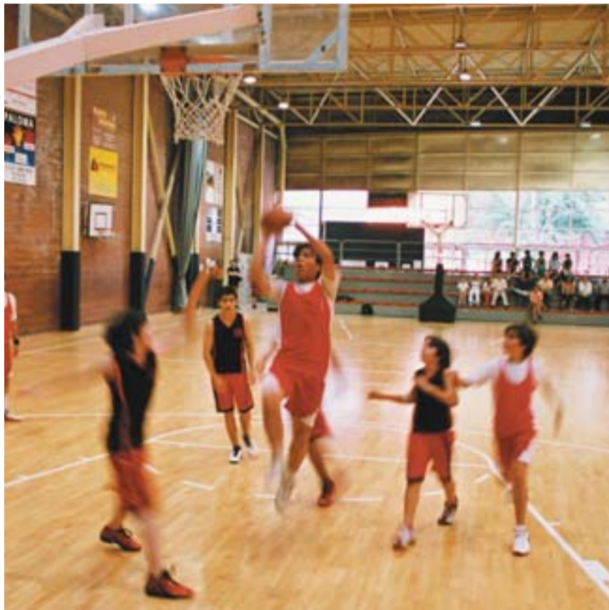
El Grup Barna té ja 26 equips de totes les categories, masculines i femenines.