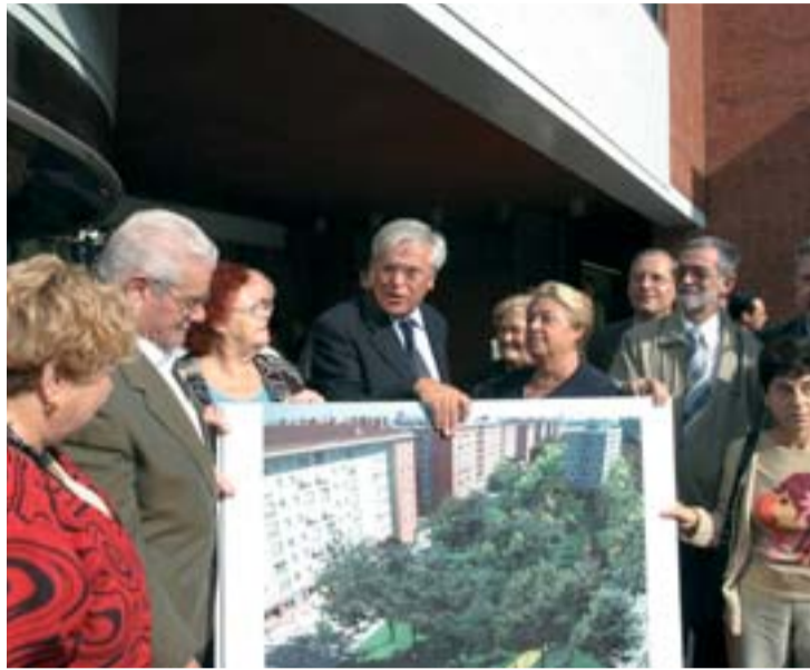
Joan Clos va explicar els detalls del projecte.

"Mitjançant un urbanisme de barri, per a la gent, s'aconseguirà que la Via Trajana tingui un dels espais més macos de Barcelona i de Sant Adrià", va assegurar l'alcalde de Barcelona, Joan Clos, durant la presentació pública del projecte que va tenir lloc el mes d'octubre passat al casal de gent gran de Verneda Alta. L'alcalde Clos va assegurar que aquest és un dels projec-