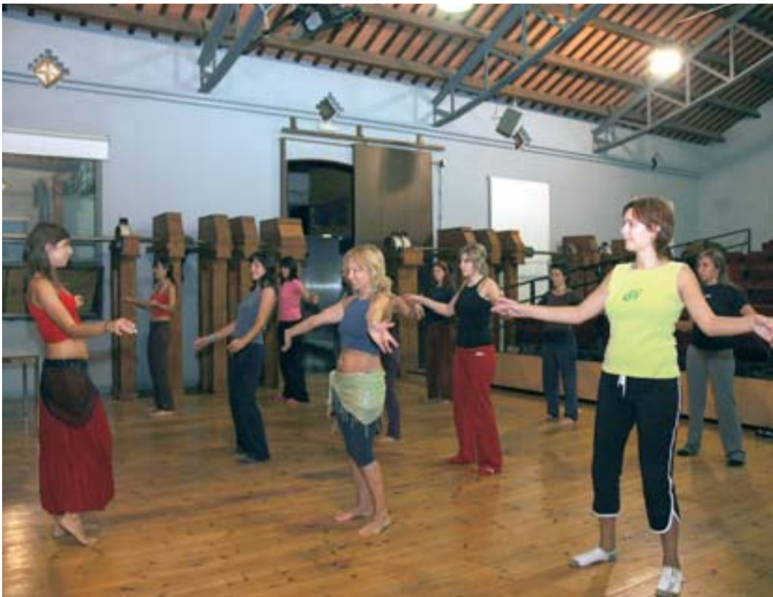
A més de tallers com el de dansa del ventre, hi ha exposicions, concerts, teatre...

La Farinera del Clot s'ha convertit en el primer equipament sociocultural municipal gestionat per una federació d'entitats, un model de gestió cívica regulat a la Carta Municipal