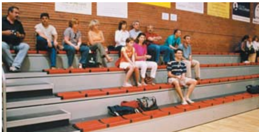
No fa gaire han inaugurat una nova grada perquè el públic gaudeixi del joc.

nes per gaudir del joc". Per al president del Club, "aquest serà un any inoblidable per al Grup Barna, ja que el Comitè Olímpic Català ens ha concedit el seu premi anual en reconeixement de la tasca duta a terme a favor de l'esport de promoció i, en particular, del bàsquet, i pel nombre d'equips inscrits a la Federació Catalana de Basquetbol. Tot això ens dóna més força -continua Santos- per mantenir el nostre desig de formació humana dels nens i dels jugadors". La nova grada es va inaugurar el mes de juny