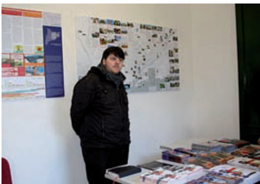
La Casa del Guarda tindrà espai per a entitats del barri.

L'antiga Casa del Guarda del parc de la Casa de les Aigües es transforma en un nou espai cultural de la Trinitat Vella i un espai museïtzat sobre la història del subministrament d'aigua a la ciutat de Barcelona