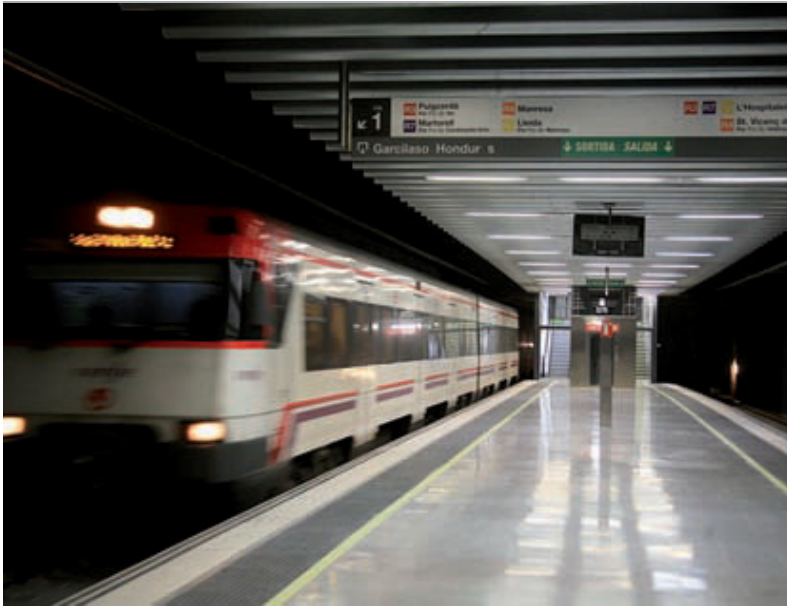
Interior de la nova estació de Rodalies de la Sagrera-Meridiana.