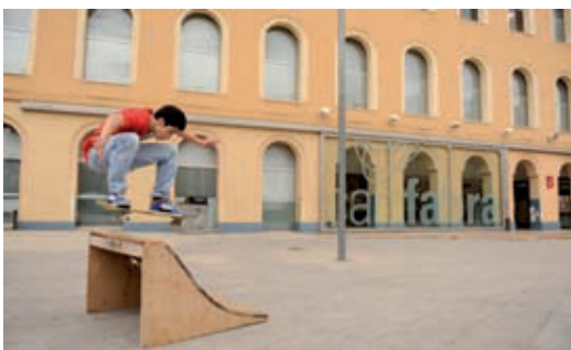
Un jove skater davant de Can Fabra.