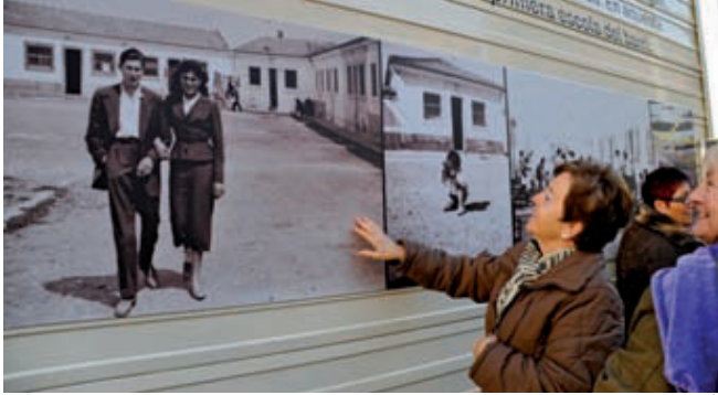
Unes veïnes miren les fotografies del mural.