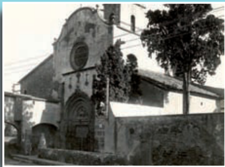
Església de Sant Martí de Provençals i inici del nucli de Sant Martí.

Si té fotografies o documents del seu barri, en pot fer donació a l'Arxiu Municipal del Districte, 93 443 22 65