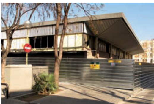
L'antic mercat, envoltat de tanques.