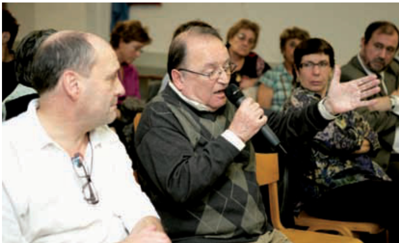
Moment del Consell de Barri de Baró de Viver.