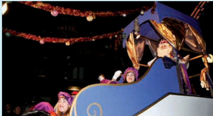
La cavalcada de Reis és una de les principals activitats de Nadal.