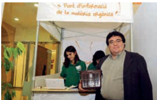
Un ciutadà recull la galleda al Punt d'Informació de Can Fabra.