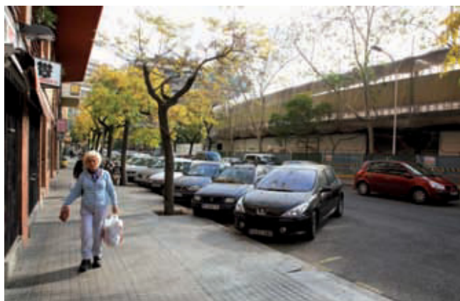
Els serveis municipals han actuat als entorns del canòdrom.

La salubritat de les velles instal·lacions en obres del canòdrom i de l'espai públic del seu entorn està plenament garantida gràcies a les tasques de manteniment engegades per diversos serveis municipals, tant pels de Manteniment del mateix Districte com pels equips del Servei d'Higiene Pública i Zoonosi de l'Agència de Salut Pública. L'Ajuntament treballa en les mesures preventives, correctives i químiques per eliminar els rosegadors a l'entorn de les obres. Paralelment, també s'està vigilant la zona al voltant de la plaça de l'Assemblea de Catalunya perquè, encara que no s'han trobat caus de rosegadors, és una zona en obres que es vol tenir controlada de manera preventiva.