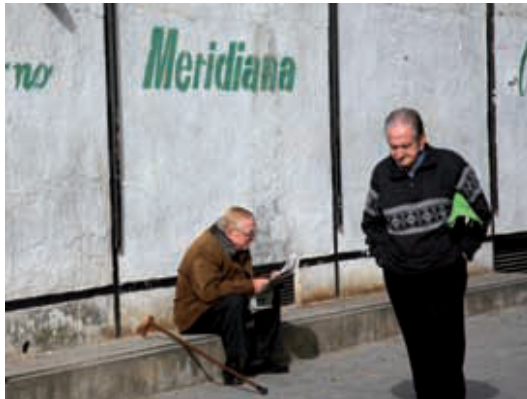
Mur perimetral del canòdrom.

Les antigues instal·lacions del canòdrom i els seus entorns són objecte de treballs de manteniment continuats per part de l'Ajuntament, per garantir-ne la salubritat