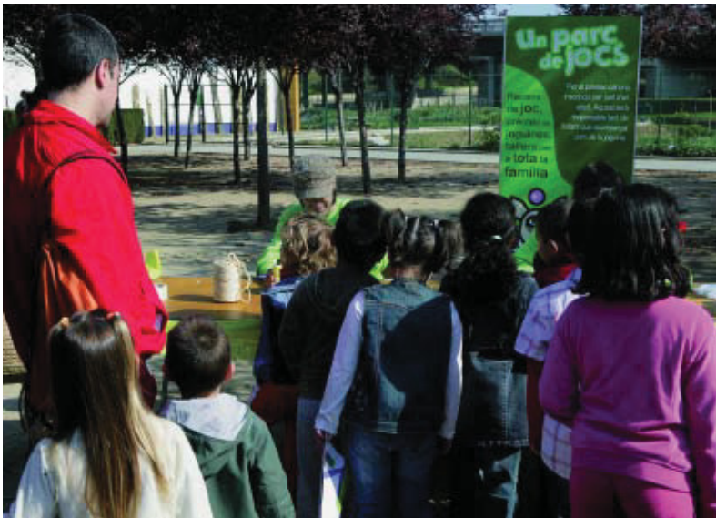
Moment de la festa del dia 15 de març.

Els infants poden utilitzar el préstec de joguines només acompanyats d'un adult i també participar en tallers i activitats dirigides per monitors els caps de setmana al matí