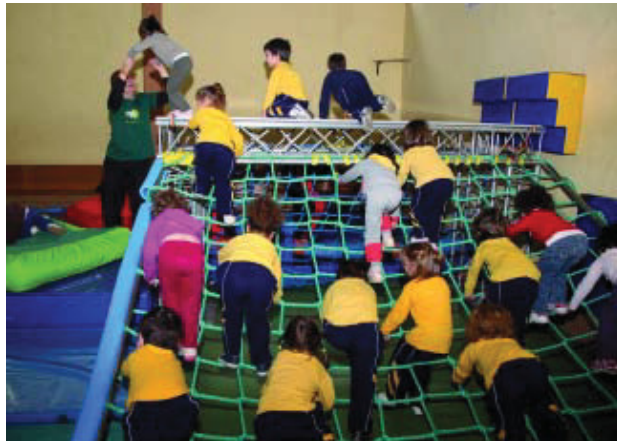
Alumnes participant en el programa, en plena activitat.

El programa didàctic i esportiu “Mira què fem!”, organitzat entre el Districte de Sant Andreu i el Centre de Recursos Pedagògics, va convertir aquestes quatre jornades en mo-