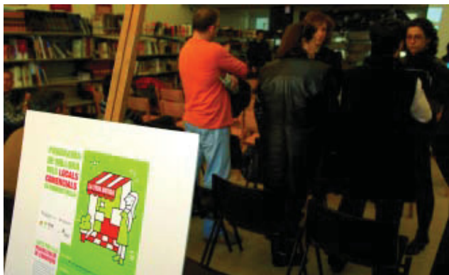
El conveni permetrà modernitzar la xarxa comercial del barri.

S'ha signat un conveni de col·laboració entre l'Institut del Paisatge Urbà i Qualitat de Vida –que disposa des de fa anys d'un programa d'ajuts per a la renovació de la imatge exterior dels establiments comercials–, el Districte de Sant Andreu i l'Associació de Comerciants de Trinitat Vella per tal de donar a conèixer les possibilitats de subvenció entre el col·lectiu de comerciants del barri de la Trinitat Vella, amb l'objectiu de modernitzar la xarxa comercial del barri, tot donant suport als comerciants en el moment de fer tota la tramitació documental per a la sol·licitud de subvenció. La iniciativa s'emmarca en les actuacions previstes per la Llei de barris.