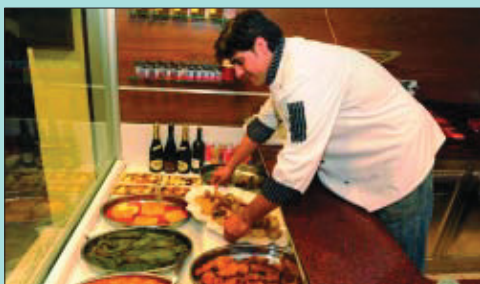
Fan càtering per a fàbriques de la zona.

Tenir un establiment com Ca la Quima al Bon Pastor és una sort per a molta gent. Saben que allí troben plats cuinats per ells, com els canelons, les croquetes o el "ternasco", una especialitat de la zona d'Osca, entre d'altres. Si tenim una celebració i no volem tancar-nos a la cuina, Ca la Quima ens ho posa fàcil. Sobretot els diumenges tenen el taulell ple de plats. Fan càtering per a moltes fàbriques del voltant, on saben que tot ho fan bo i al moment. Tenen productes de carnisseria frescos i