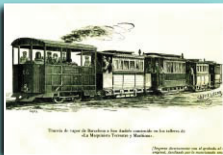
Imatge del primitiu tramvia de vapor de Barcelona-Sant Andreu.

Si té fotografies o documents del seu barri, en pot fer donació a l'Arxiu Municipal del Districte, 93 291 69 32