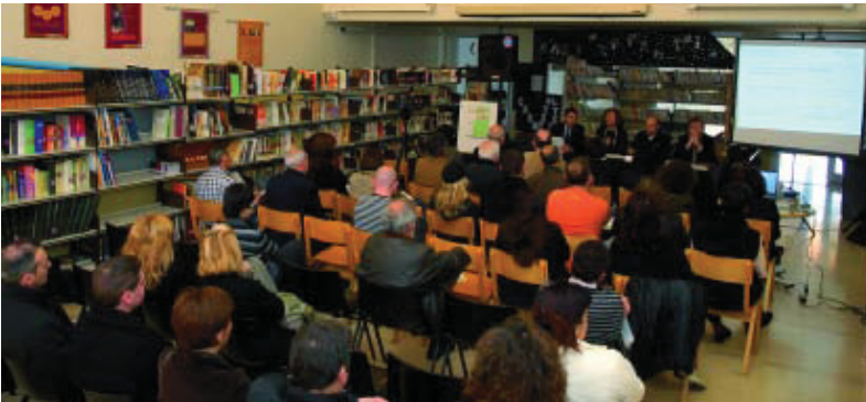
Un moment de l'acte de signatura del conveni.

Els comerços hauran de sol·licitar la llicència d'obres corresponent al Districte, com també la sol·licitud d'ajut a l'Institut del Paisatge Urbà en l'imprès normalitzat que els serà facilitat. Aquesta sol·licitud s'haurà de fer abans del començament de les obres. Una vegada realitzades les obres, i amb la presentació prèvia de les factures corresponents a l'Institut del Paisatge Urbà, aquest organisme tramitarà el pagament de la subvenció establerta.