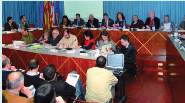
Un moment del Ple del dia 3 de març.

En la sessió plenària del 3 de març es va informar dels projectes aprovats dins el Fons Estatal d'Inversió Local que s'han de dur a terme al districte durant el 2009