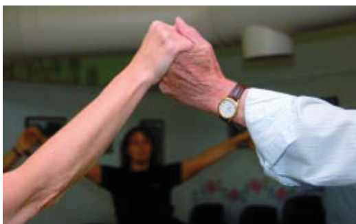
Fa onze anys que el Foment organitza cursos de sardanes.