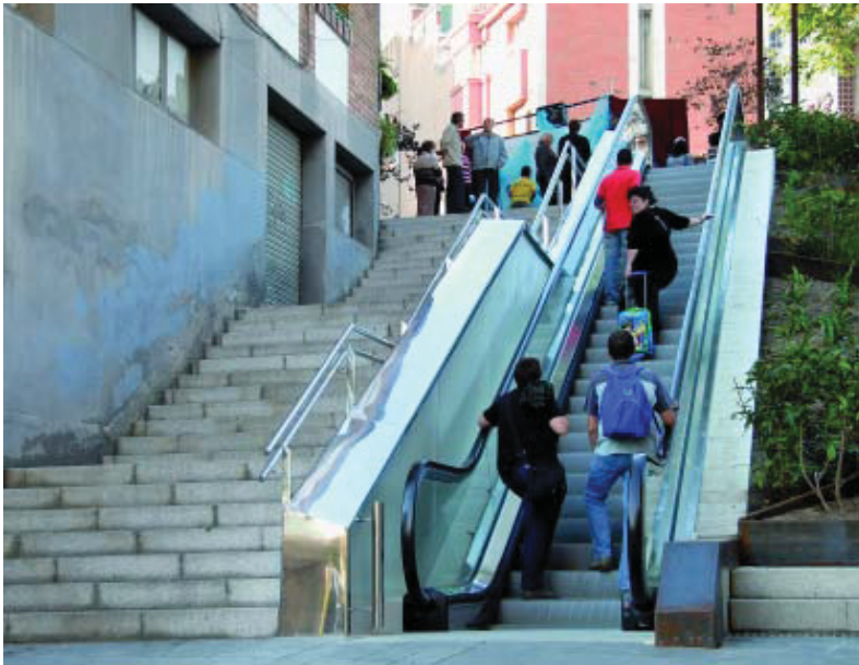
Les noves escales tenen regulador de velocitat.

Les escales mecàniques del carrer Ausona (entre Foradada i Mare de Déu de Lorda) es van inaugurar el 10 d'octubre amb una festa: grups d'animació, concert i berenar popular