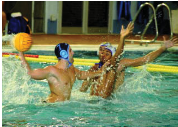
Moment del partit celebrat el 4 d'octubre.

Valls assumeix les possibles mancances que pot tenir la seva secció, però "pel que fa a l'equip hem arribat quasi al màxim, i pel que fa al club, hem pogut respondre perfecta-