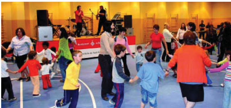
Una de les activitats festives celebrades durant la inauguració del casal.

La inauguració va ser una festa lúdica amb actuacions del Caliu-Congrés, espectacles infantils, xocolatada per a tothom i una visita de portes obertes, a la qual va assistir també l'alcalde de Barcelona, Jordi Hereu.