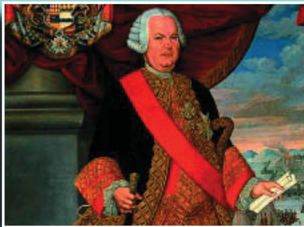
El virrei Amat.

Si té fotografies o documents del seu barri, en pot fer donació a l'Arxiu Municipal del Districte, 93 291 69 32