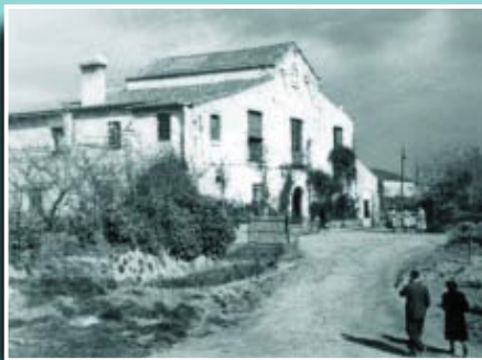
Imatge rural de la masia de can Valent.

Si té fotografies o documents del seu barri, en pot fer donació a l'Arxiu Municipal del Districte, 93 291 69 32