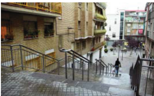
El carrer Vinya Llarga on s'instal·laran unes escales mecàniques.