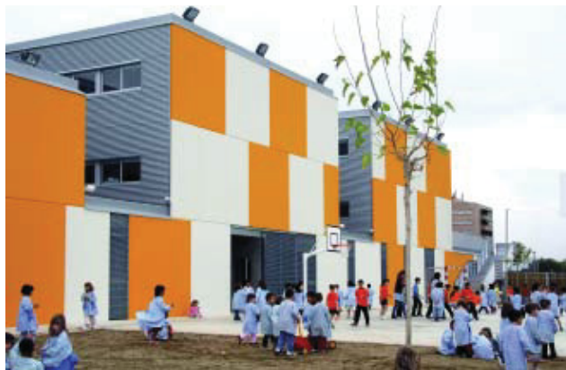
Els alumnes han estrenat la nova escola.

La nova escola Eulàlia Bota va entrar en funcionament el passat 15 de setembre amb l'inici del curs escolar. La seva construcció havia començat el novembre de l'any passat. Es tracta d'una de les primeres actuacions del nou complex d'equipaments, habitatges i espais públics de les antigues casernes de Sant Andreu, una de les operacions de transformació urbana més importants que es fa actualment a la ciutat. El nom de l'escola és un homenatge a la pedagoga Eulàlia Bota, que va ser veïna de Sant Andreu. L'escola Eulàlia Bota s'afegeix a la comissaria dels Mossos d'Esquadra que ja va ser inaugurada mesos enrere a l'espai de les antigues casernes de Sant Andreu.