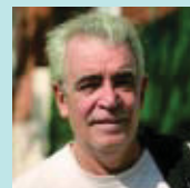
Carlos Agut Informàtic

De moment encara està tot en obres, però penso que el resultat serà positiu per al barri, encara que actualment estem patint la transformació.