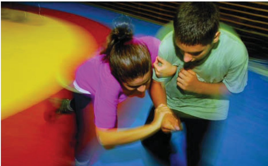
El club és l'únic equip català que participa a la Divisió d'Honor d'aquest esport.

El Club de Lluita Baró de Viver és un dels clubs referents de Catalunya i vol fer el salt a escala estatal en la segona edició d'aquesta lliga