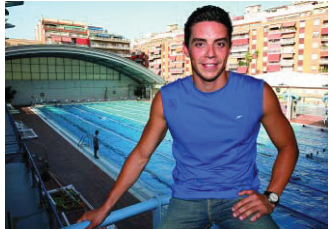
L'Europeu, els Jocs del Mediterrani i el Mundial, els pròxims objectius de Brenton.

Vull recuperar-me bé perquè els dos darrers anys he tingut un ritme fort,