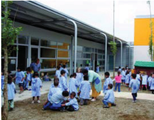
El pati de la nova escola ple de nens i nenes.

La nova escola, que ha entrat en funcionament amb el nou curs escolar, és un dels primers grans projectes de renovació del recinte de les antigues casernes de Sant Andreu