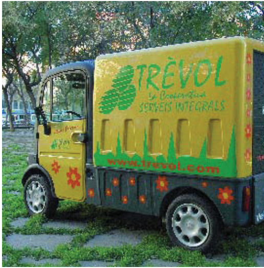
Un dels vehicles elèctrics que fa la distribució a botigues.

Com qualsevol via amb força densitat comercial, pel carrer Gran circulen molts vehicles per distribuir el gènere a les botigues. Els desplaçaments es concentren en una mateixa franja horària, perquè la distribució es fa quan els comerços són oberts i això origina una gran congestió del