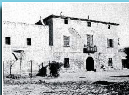
Imatge del mas de Ca l'Armera o Cal Ros.

Si té fotografies o documents del seu barri, en pot fer donació a l'Arxiu Municipal del Districte, 93 291 69 32