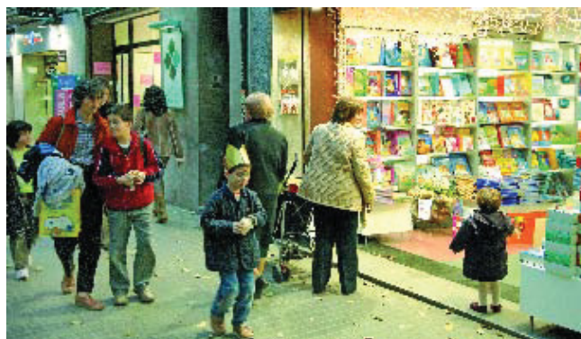
La prova de distribució de mercaderies a les botigues es farà durant dos mesos.

Al carrer Gran de Sant Andreu, entre Lenguadoc i Malats, s'està fent una prova pilot de distribució de mercaderies que té com a objectiu reduir-hi el trànsit comercial. La iniciativa, la primera d'aquest tipus que es fa a Barcelona, ha estat impulsada per l'Eix Comercial de Sant Andreu i l'Ajuntament i durarà dos mesos. També servirà per promocionar el transport sostenible, ja que la distribució es fa amb uns petits vehicles elèctrics que ni emeten fum ni fan soroll, els quals recullen el gènere a un magatzem de l'antiga fàbrica Fabra i Coats i, des d'aquí, el distribueixen a les botigues. Si els resultats són positius, el sistema es podria estendre a altres punts de Barcelona.