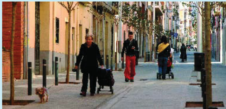
El carrer Servet és un dels que s'ha fet de plataforma única.