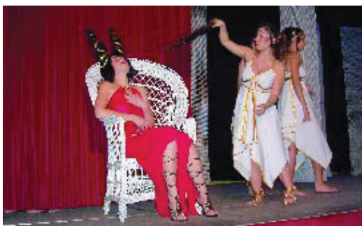
Una imatge de l'obra Lisístrata de l'Associació Teatral la Jarra Azul.