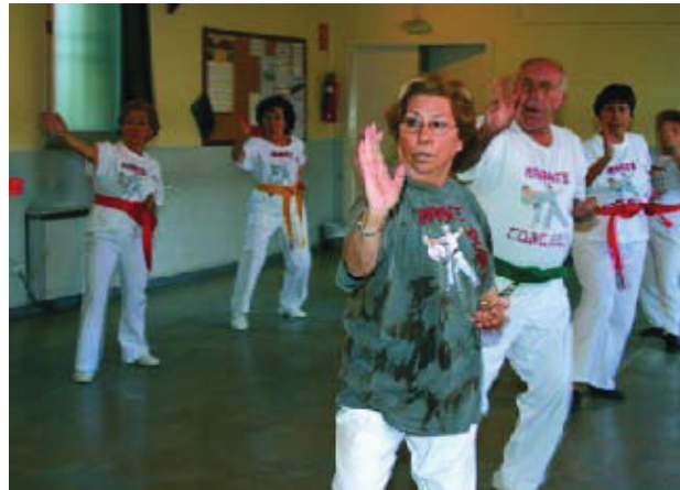
Una de les imatges de l'exposició.

El Districte de Sant Andreu, amb la col·laboració del Consell de les Dones, del Consell de l'Esport del Districte i la Regidoria de la Dona, ha posat en marxa una interessant exposició amb un marcat caire femení sobre l'estreta relació entre l'esport i les dones de Sant Andreu. El Consell de les Dones del Districte va triar com a eix temàtic de treball per al període 2006-07 la presència i el protagonisme de les dones del districte en l'esport. Tal com assenyalava el fulletó de l'exposició, "en una societat en la qual l'esport és un fenomen social de grans dimensions, la pràctica esportiva femenina, tot i els avenços aconseguits en els darrers anys, mostra encara uns percentatges de participació massa allunyats de la mitjana masculina".