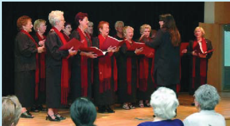
Aquest mes hi haurà tota mena d'activitats adreçades a les dones.