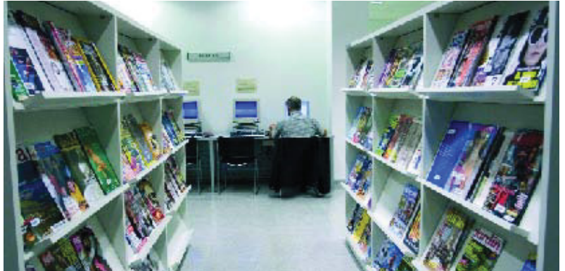
Detall de l'interior de la biblioteca.