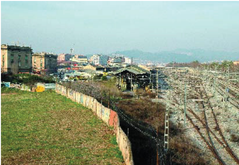
Estat actual dels terrenys de l'estació de la Sagrera.

La transformació de l'antiga estació ferroviària de la Sagrera és una oportunitat històrica per recuperar un espai que tradicionalment ha estat una ferida en la trama urbana i que ara està cridat a convertir-se en un nou centre de la ciutat