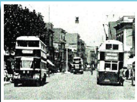
Els troleibús al carrer Gran de Sant Andreu.

Si té fotografies o documents del seu barri, en pot fer donació a l'Arxiu Municipal del Districte, 93 221 94 44