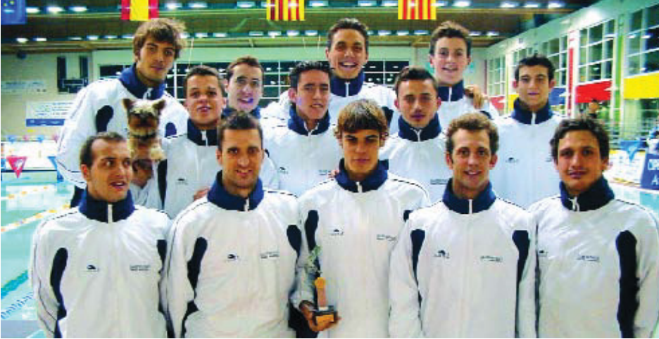
Els medallistes del CN Sant Andreu.