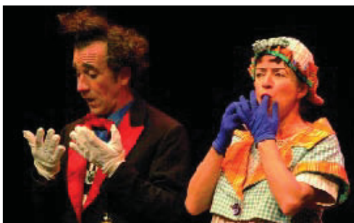
Els pallassos, un dels principals protagonistes del saT! per a l'abril.