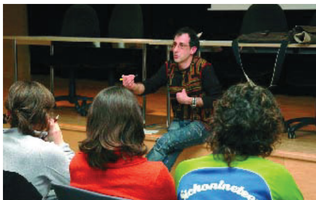
Sessió de treball del cicle 7 de teatre.