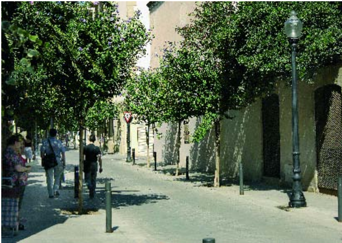
El carrer de les Monges, després de la remodelació.

Durant l'estiu s'han acabat obres que han renovat diversos espais públics de Sant Andreu. Cal destacar la urbanització de la plaça de Can Galta Cremat i la dels carrers de les Monges i de Recesvint