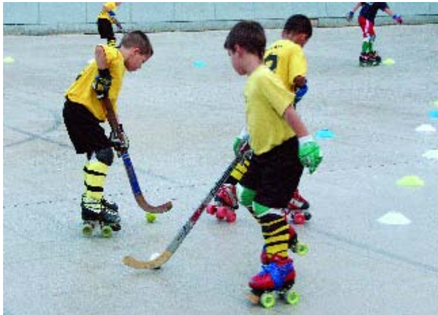
El club té actualment uns 180 esportistes.