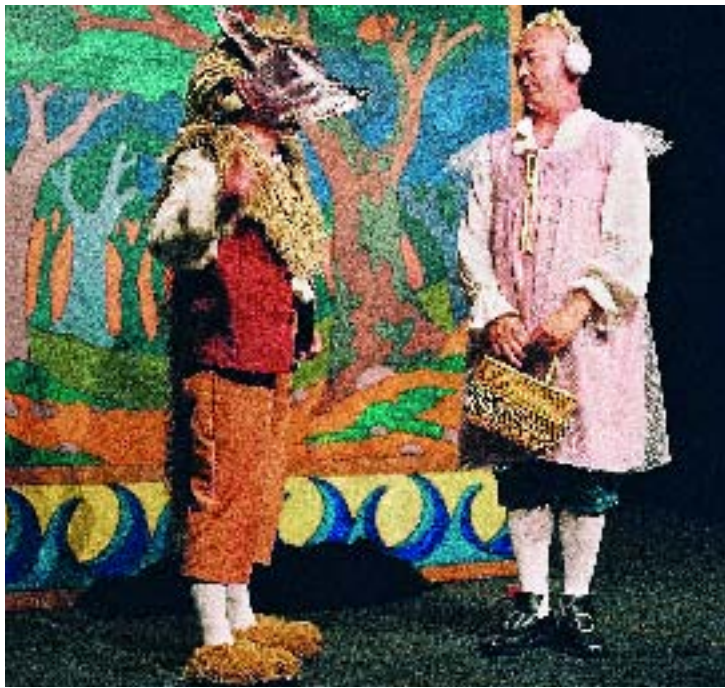
Una escena de "Grim, Grim o La Blancallops i els set porquets".