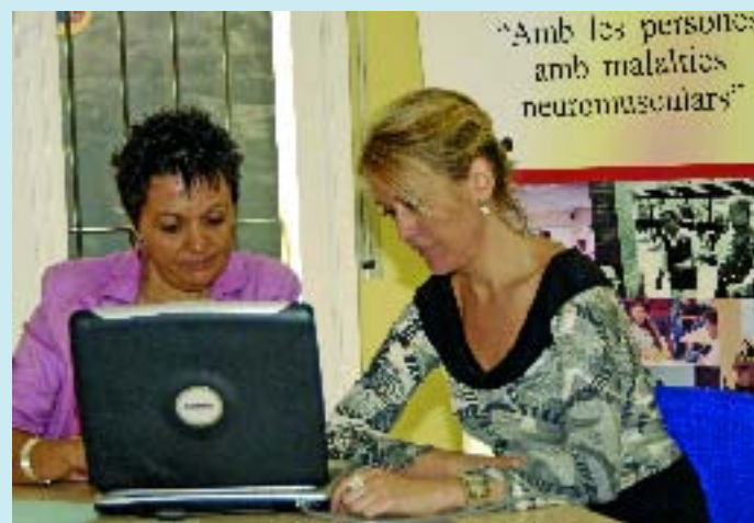
A l'ASEM fan divulgació i pedagogia.

El nou local, que ha estat cedit per l'Ajuntament del Districte de Sant Andreu, té unes instal·lacions prou àmplies per garantir la intimitat dels malalts que hi van