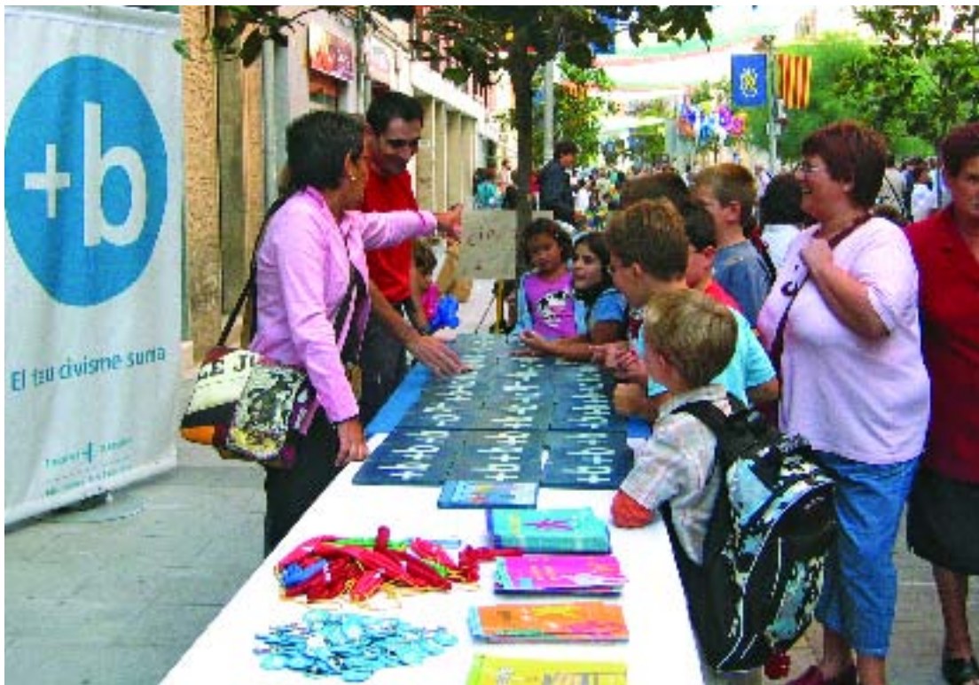
Un estand amb jocs cívics per als més petits al carrer Jordi de Sant Jordi.