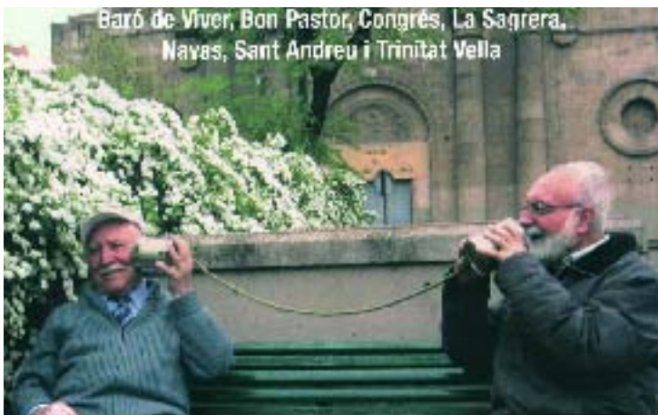
Imatge de la publicació de La Veu de la Gent Gran, de Sant Andreu.