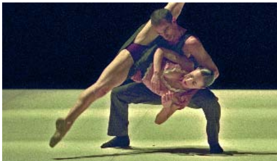
La dansa contemporània és molt present en la programació del saT.

La companyia de dansa contemporània Thomas Noone Dance és una de les apostes fortes del Sant Andreu Teatre (saT) per a aquesta nova temporada. Durant aquesta tardor presentarà dos espectacles, Crush-Crease i Fútil , i oferirà activitats de formació per a estudiants i professionals de la dansa. El grup de Sant Andreu La Jarra Azul estrena a Barcelona Niños de Morelia , una obra sobre l'exili que van patir molts infants espanyols durant la Guerra Civil. La programació infantil presenta obres com La Via Làctia , Pippi Langstrump o Grim, Grim o la Blancallops i els set porquets –una revisió dels contes clàssics–, així com un espectacle de dansa de Lanònima Imperial.