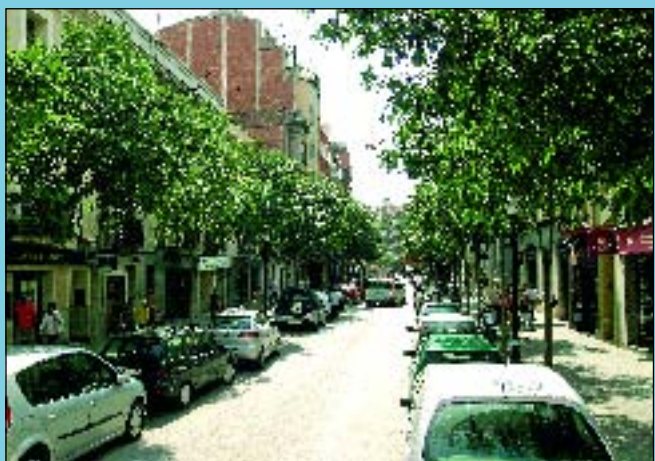
Ara Continua sent un dels principals carrers de Sant Andreu.