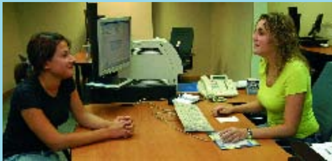
Interior de la nova oficina.