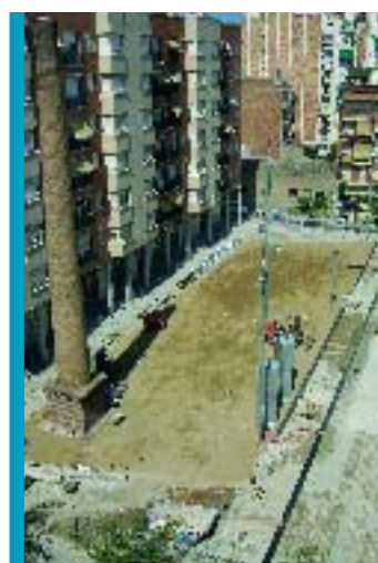
S'ha aprofitat l'actuació a la plaça per pacificar el trànsit al carrer Colòmbia

I parlant d'equipaments, ja s'ha acabat la primera fase de les obres per construir el Casal de Gent Gran de Navas, les quals han consistit en l'enderroc de la pista poliesportiva i dels murs de pantalla i en