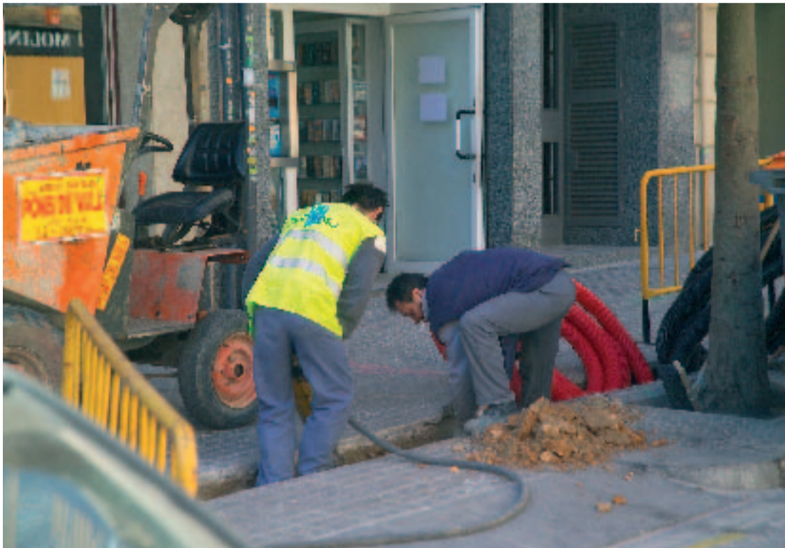
Els treballs a alguns carrers van començar el mes de març.