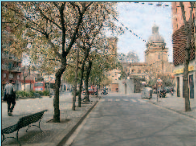
Ara Amb els anys i la construcció d'edificis, el lloc ha canviat molt.