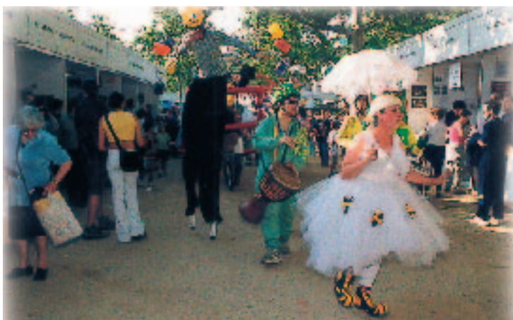
Imatge de l'última Mostra d'Entitats, ara fa dos anys.

Dos anys després de l'edició anterior, torna la Mostra d'Entitats del districte. La Mostra és una oportunitat per donar a conèixer als veïns el que fan les associacions de Sant Andreu. Cada entitat ofereix informació relacionada amb la seva tasca quotidiana, ensenya la seva producció o fa participar els veïns en les seves activitats. Així s'acosten als visitants durant els tres dies de fira.