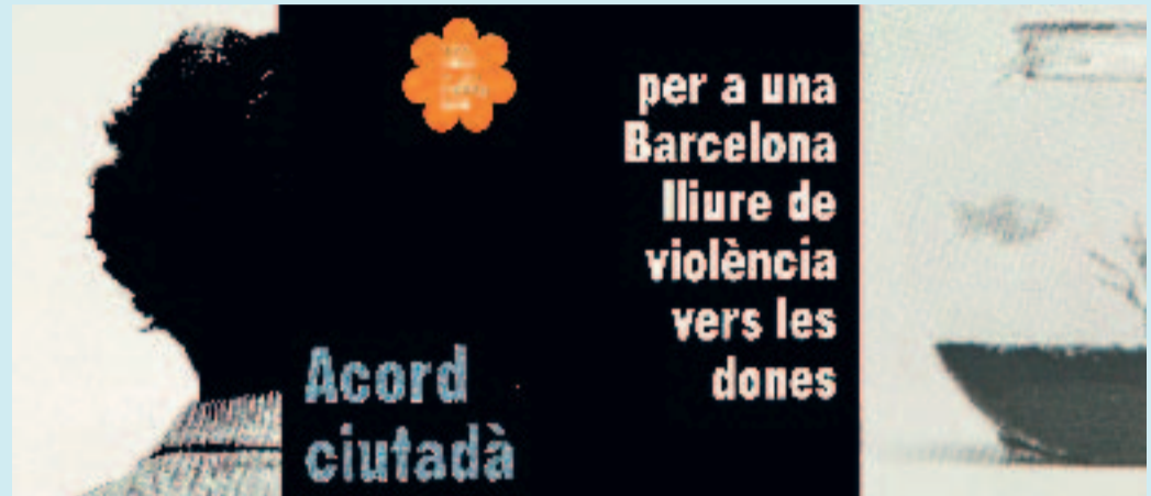
Fullet divulgatiu de l'Acord ciutadà contra la violència de gènere.

A tot Barcelona són ja més de 400 les entitats que s'han compromès en l'Acord ciutadà per a una Barcelona lliure de violència vers les dones. Sant Andreu ha reforçat, en els últims mesos, la difusió d'aquest compromís