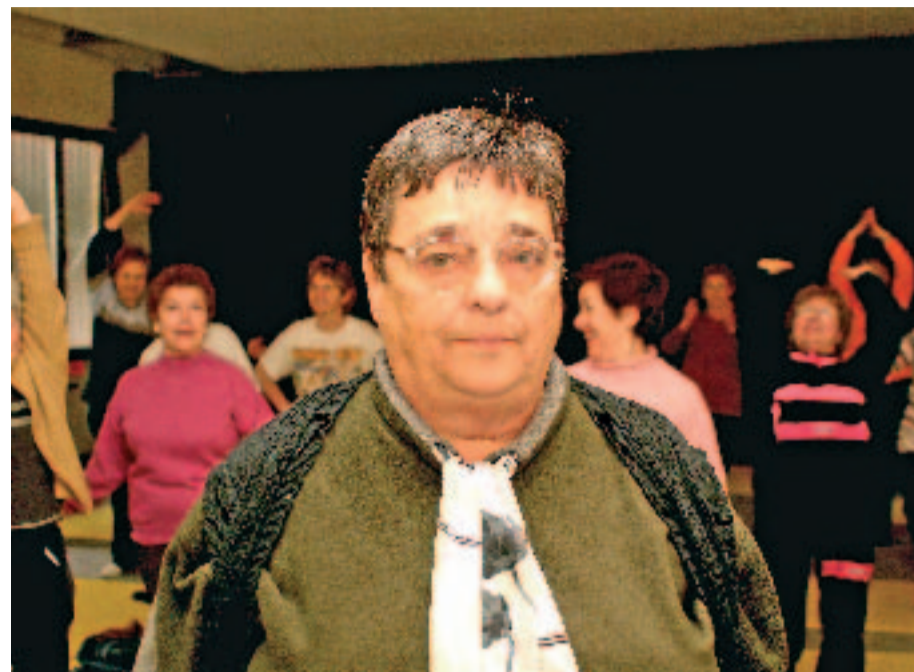
Paulina pensa que no s'hauria d'envellir mai.

Un dia, jo vaig tenir un problema amb La Caixa. Em van cobrar