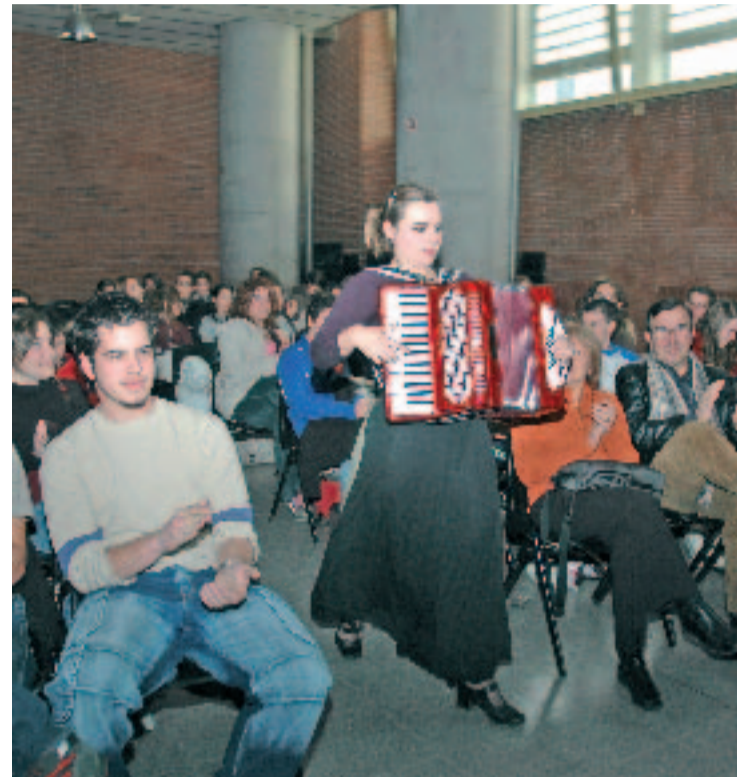
Durant set dies es fan tallers sobre arts escèniques.

tat que hi ha al districte de Sant Andreu. El curs es tanca amb la celebració d'un espectacle relacionat amb la matèria que han pogut aprendre i amb l'assistència d'una representació al saT. En la darrera edició, que va