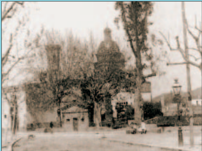
Abans Eucaliptus de Can Serret a la plaça Ramon Riera el 1924.

Si té fotografies o documents del seu barri, en pot fer donació a l'Arxiu Municipal del Districte, 93 291 69 32