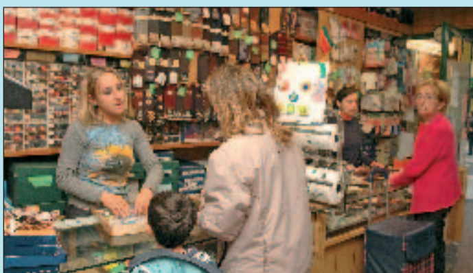
Mostrador de la merceria, amb la seva varietat d'articles.