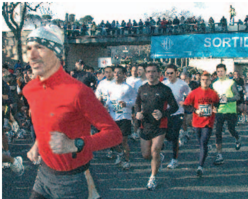
Uns 2.000 atletes van córrer per Barcelona el 6 de març.

El temps també va fer costat a l'organització i als participants, i amb un dia assolellat, esplèndid i amb molt bona temperatura per a la pràctica de l'atletisme, els 21.097 metres de la Mitja Marató van ser un veritable passeig.