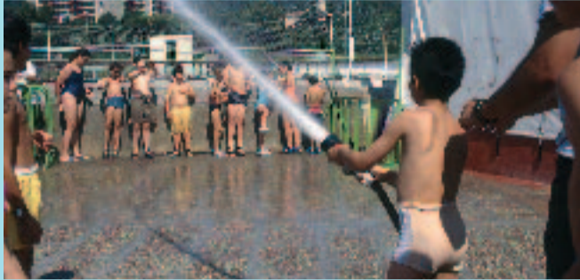
Les activitats van adreçades a infants i joves fins a 17 anys.