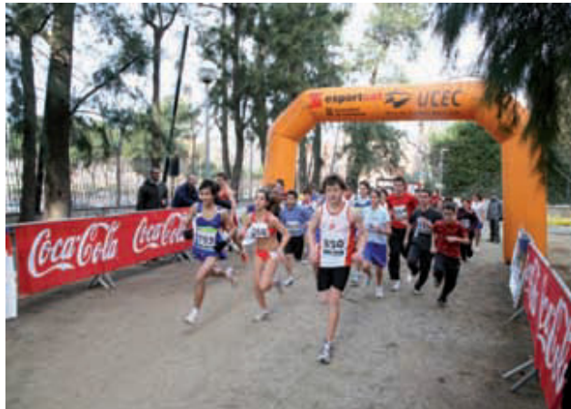
La sortida de la cursa a l'edició passada.

Les curses, que començaran a les 10 hores, permetran córrer a nois i noies nascuts entre els anys 1992 i 2003, en recorreguts establerts per cada categoria que poden anar dels 800 fins als 3.300 metres.