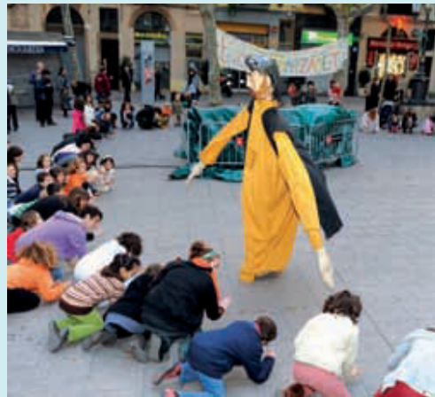
Nens i monitors de l'esplai, a la festa a la plaça Concòrdia.

La celebració de l'aniversari es va completar amb una ex-