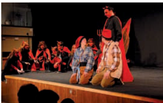
Representació dels Pastorets del Col·legi Pare Maryanet.