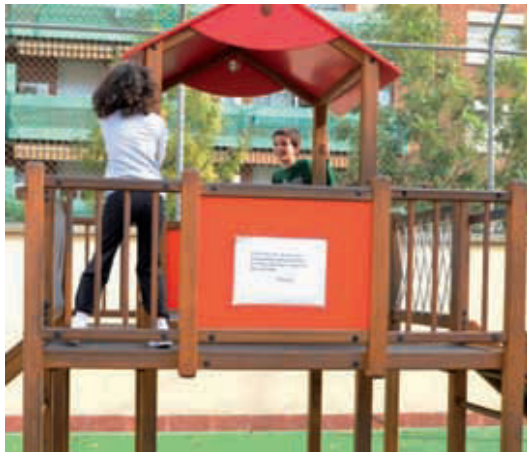
El pati esdevé un espai on jugar amb altres nens del barri.

La Regidoria de Nous Usos Socials del Temps i la Fundació Jaume Bofill iniciaven al 2005 el projecte 'Temps de barri, Temps educatiu compartit', un repte pensat per harmonitzar el lleure de nens i nenes amb les necessitats horàries de les famílies, a través de propostes educatives i de qualitat dissenyades per les entitats del territori. El projecte, que va començar a Sants-Montjuïc, Gràcia i Nou Barris, es va estendre aviat a tots els districtes, i el curs passat va englobar 63 activitats amb gairebé 14.000 assistents.