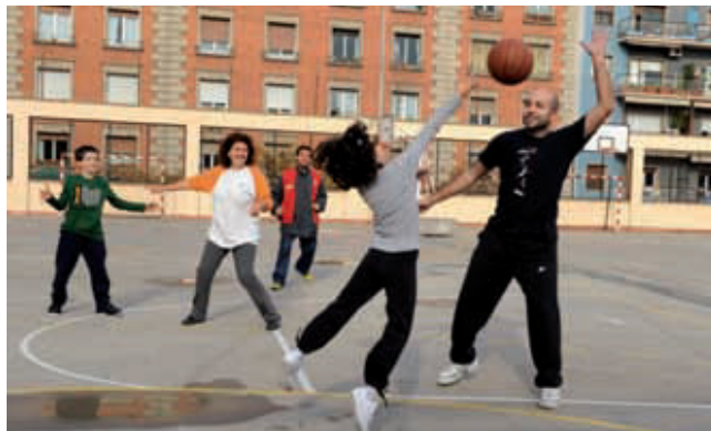
Esport al pati obert del CEIP Eugeni d'Ors.

Un espai on jugar i practicar esports, retrobar-se amb els companys d'escola, amb els veïns de l'escala, amb els amics del barri... Els patis escolars han recobrat vida utilitzats com a parcs vigilats els caps de setmana. Ja se n'ha obert una vintena a tota la ciutat, entre els quals el pati de l'escola Les Corts, i aviat ho farà també el de l'escola Pau Romeva. L'obertura dels patis forma part del projecte "Temps de barri" per ajudar els pares i les mares a conciliar la vida familiar i laboral. El passat 31 d'octubre, infants, famílies i agents educatius van ser convocats a una gran festa a les fonts de Montjuïc per celebrar el primer any de vida del programa.