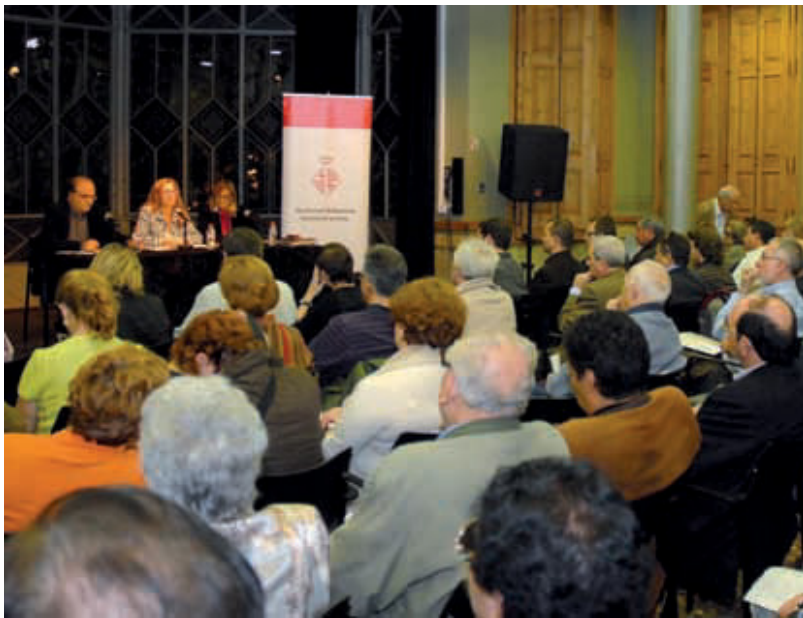
Un moment de la constitució del Consell de Barri de les Corts.

El passat mes de novembre es van constituir els nous Consells de Barri, l'òrgan de participació ciutadana en totes les qüestions referents als respectius barris del districte