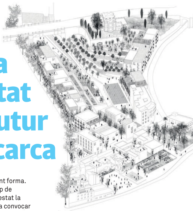
Plànol-gràfic de proposta del nou model de planejament del barri

EL futur de Vallcarca va prenent forma. La proposta "Arrels", de l'equip de l'arquitecte Carles Enrich, ha estat la guanyadora del concurs que va convocar l'Ajuntament per definir l'urbanisme de Vallcarca i reactivar aquest barri amb la construcció de nous habitatges i espais verds.