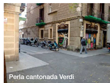
Perla cantonada Verdi