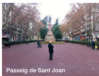
Passeig de Sant Joan