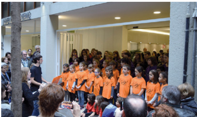
Coloraines de l'Orfeó Gracienc cantant a la inauguració de les obres de remodelació de la seu de l'Orfeó Gracienc

Amb un cost de 1.450.000 € les obres han adequat les instal·lacions del carrer Astúries 83, a les normatives de seguretat, antiincendis, accessibilitat i supressió de barreres arquitectòniques necessàries segons la llicència d'activitat corresponent.