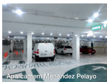
Aparcament Menéndez Pelayo