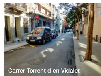
Carrer Torrent d'en Vidalet