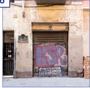
c. Cera, 10 Superfície útil: 35 m 2 Estat: reforma prevista