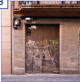
Santa Madrona, 6-8 (local 2) Superfície útil: 139,30 m 2 Estat: reforma prevista