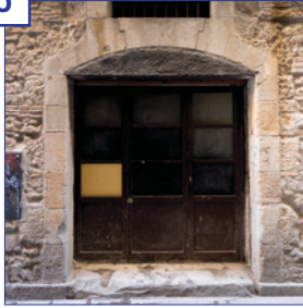
c. Flassaders, 23 Superfície útil: 35 m 2 Estat: reforma prevista Altres: entrada pel carrer de Sabateret