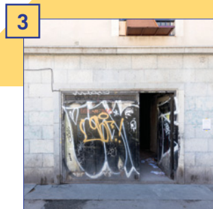
3 c. Arc del Teatre, 13 Superfície útil: 155 m 2 Estat: reforma prevista Altres: espai d'entrada diàfan i 3 sales independents