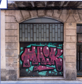
c. Carretes, 43 Superfície útil: 121,06 m 2 Estat: reforma prevista