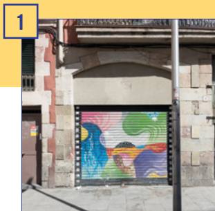
1 c. Robador, 21 Superfície útil: 111 m 2 Estat: en reformes