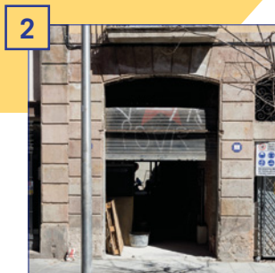
2 c. Robador, 43 Superfície útil: 68,90 m 2 Estat: finca en reformes Altres: local amb pati de 42,05 m 2