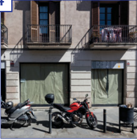
c. Francesc Cambó, 30-36 Superfície útil: 59 m 2 Estat: en reformes Altres: entrada pel carrer Giralt el Pellicer, davant del Mercat de Santa Caterina