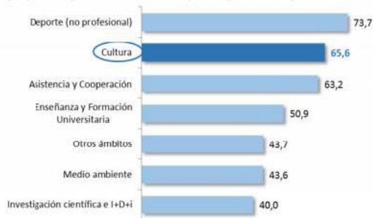
Gráfico 2. ¿En qué ámbitos realiza su empresa acciones de patrocinio y/o mecenazgo? (en porcentaje sobre el total de empresas que realizan patrocinio/mecenazgo)

Es parla sobre les formes de col·laboració entre les entitats i/o empreses i que cap empresa dóna diners perquè sí. El benefici se sostrau de les relacions exercides. No existeix una forma ideal de col·laboració. Es conclou que no importa tant l'interès del projecte en si mateix que busca finançament, sinó els punts de connexió entre el projecte i l'entitat que fa el