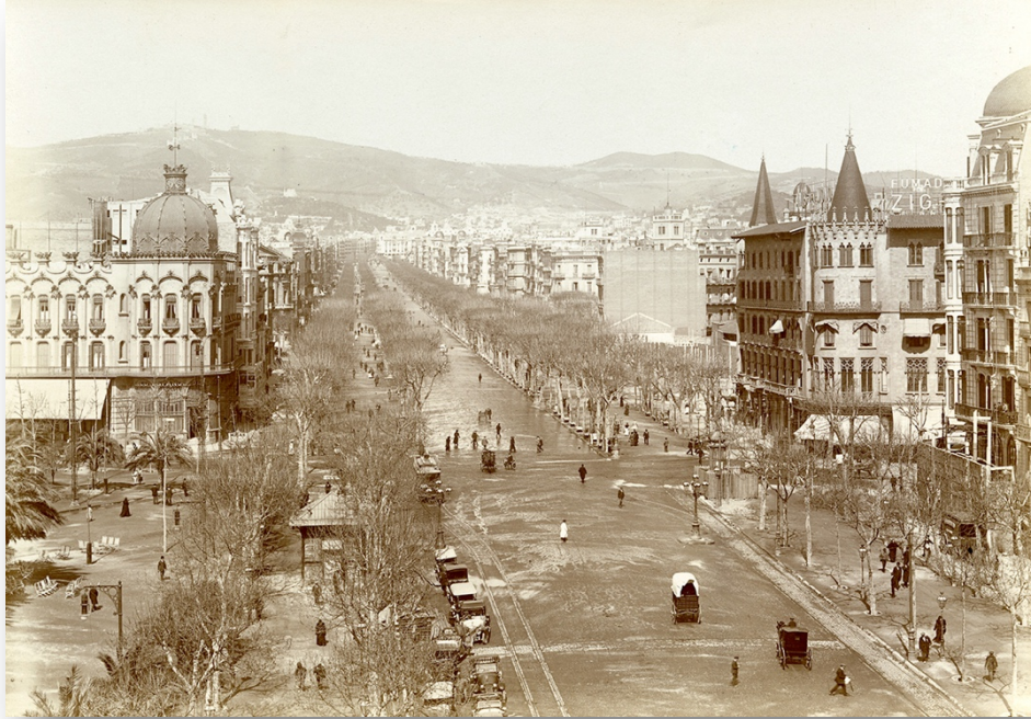
Fotografia del Passeig de Gràcia de 1908