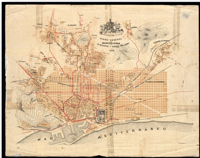
Mapa de Barcelona del 1908