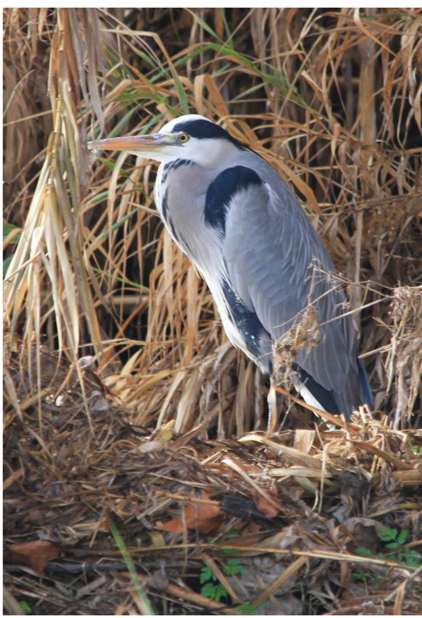
Bernat pescaire, fàcil d'observar al riu Besòs.