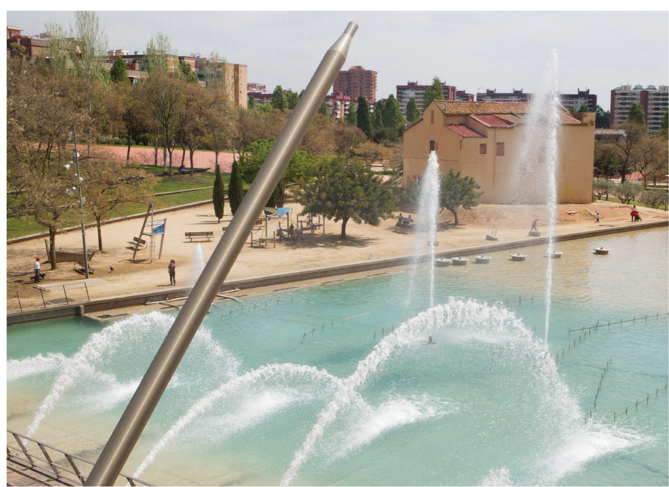
L'aigua dona vida al Parc Central de Nou Barris.

Nou Barris amaga arbres i racons de natura sorprenents. A la plaça de Santa Engràcia del barri de la Prosperitat hi viu, des del 1899, un exemplar d'acàcia de Japó d'onze metres d'alçada. Si us enfileu a Roquetes, hi trobareu els Jardins de Rodrigo Caro, una petita arca de Noè dels arbustos de clima mediterrani; hi ha plantades fins a 80 espècies de plantes aromàtiques i gramínies, algunes procedents de Xile, Sud-àfrica o Austràlia.