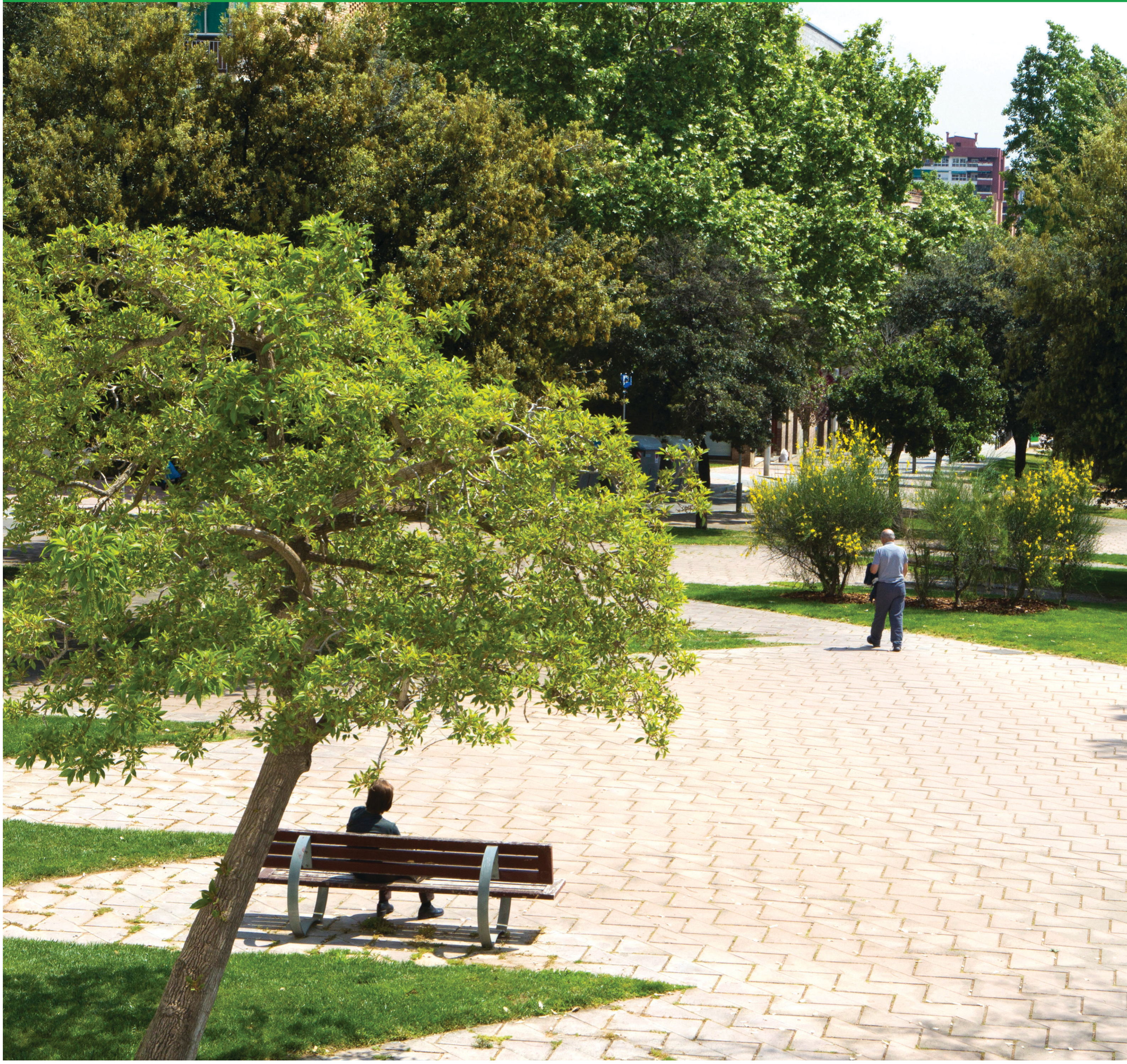
El Parc Central de Nou Barris, on hi viuen més de 1.000 arbres.