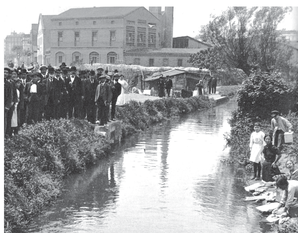
El Rec Comtal quan passava pel barri del Clot.

Des de fa uns anys, el tram final del riu Besòs viu un lent però esperançador procés de canvi. Ha passat de ser un riu contaminat a cel obert a un ecosistema amb vida aquàtica, d'un espai degradat a un gran parc fluvial per al lleure. L'èxit social i ambiental de la recuperació del Besòs està difuminant el tradicional efecte frontera del riu i l'està convertint en una veritable frontissa que relliga els dos marges. El Besòs és, avui dia, un àmbit clau per al futur desenvolupament de l'àrea metropolitana de Barcelona.