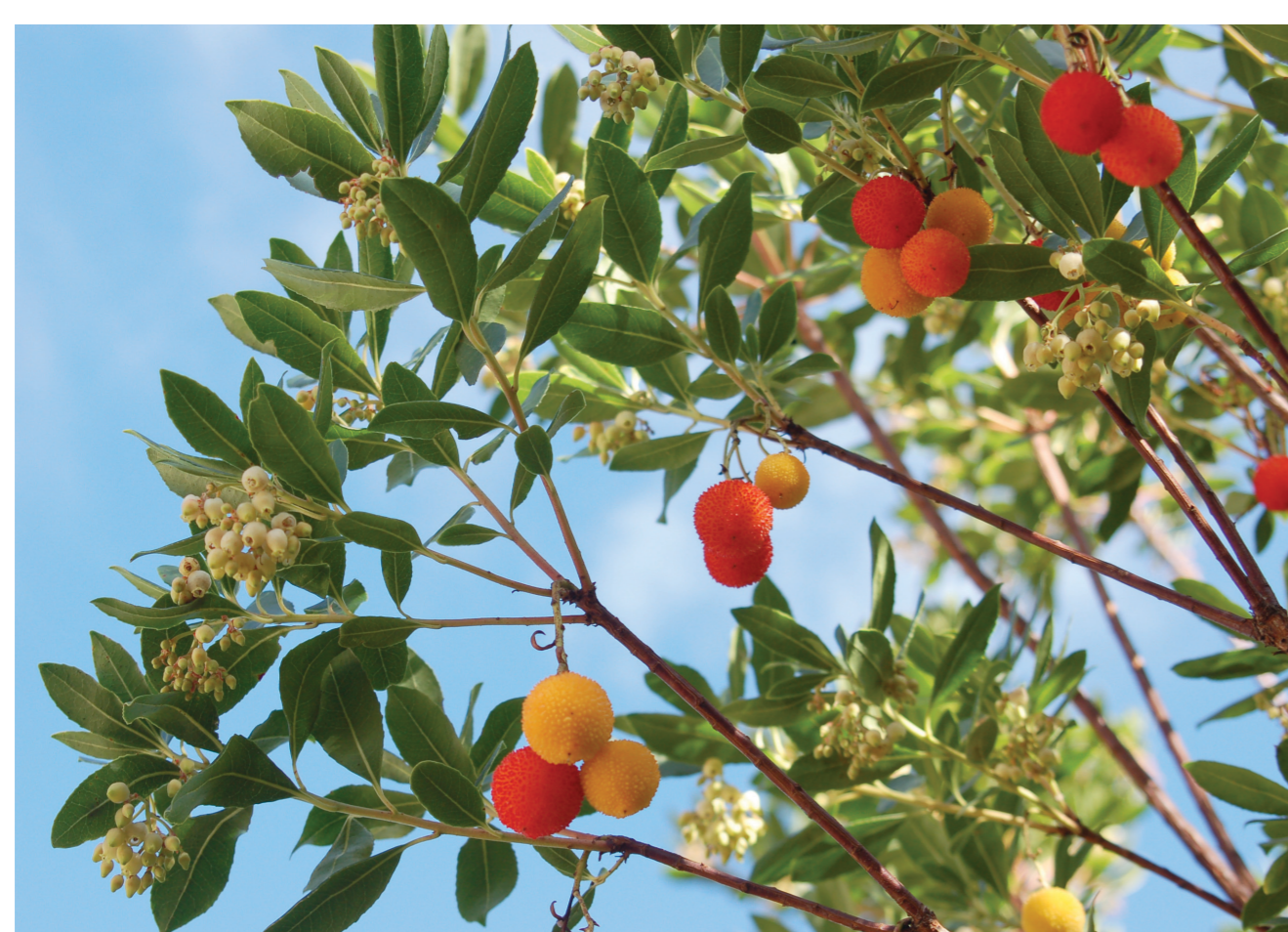
Cireretes d'arboç, de colors ben vius.

Des de Barcelona es pot accedir a Collserola per múltiples entrades. Una de les més desconegudes i sorprenents és la del barri de Trinitat Nova, a l'extrem més oriental de la ciutat. Des de la Casa de l'Aigua, amb dues parades de metro a tocar, un camí panoràmic s'enfila al Castell de Torre Baró. Aquest edifici misteriós és un símbol del districte, un mirador fabulós i un punt d'informació del Parc Natural des d'on iniciar diversos itineraris que s'endinsen al massís.