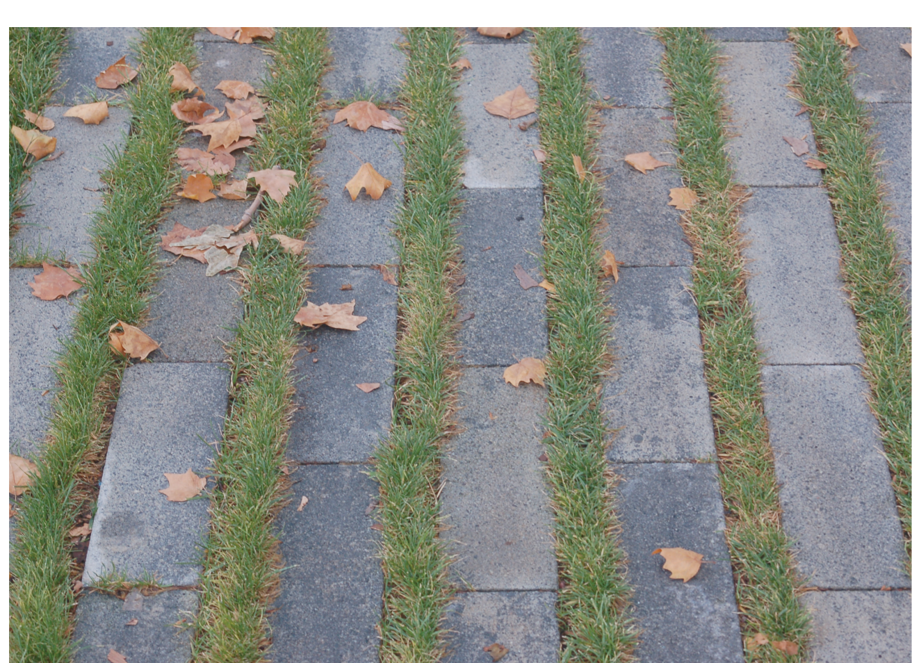
La natura, ben present als carrers de la ciutat.