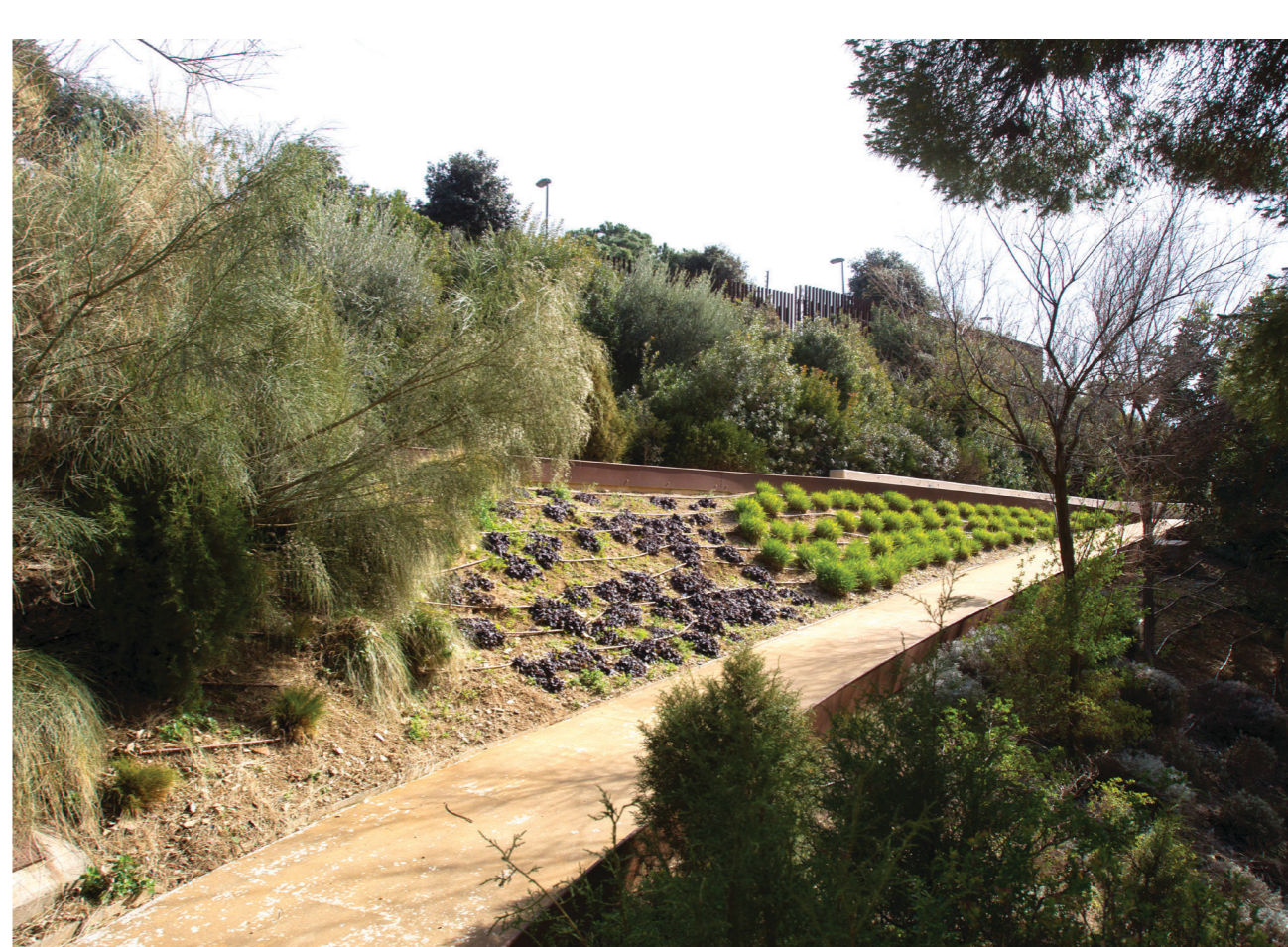
Els Jardins Rodrigo Caro, un espai verd a descobrir.