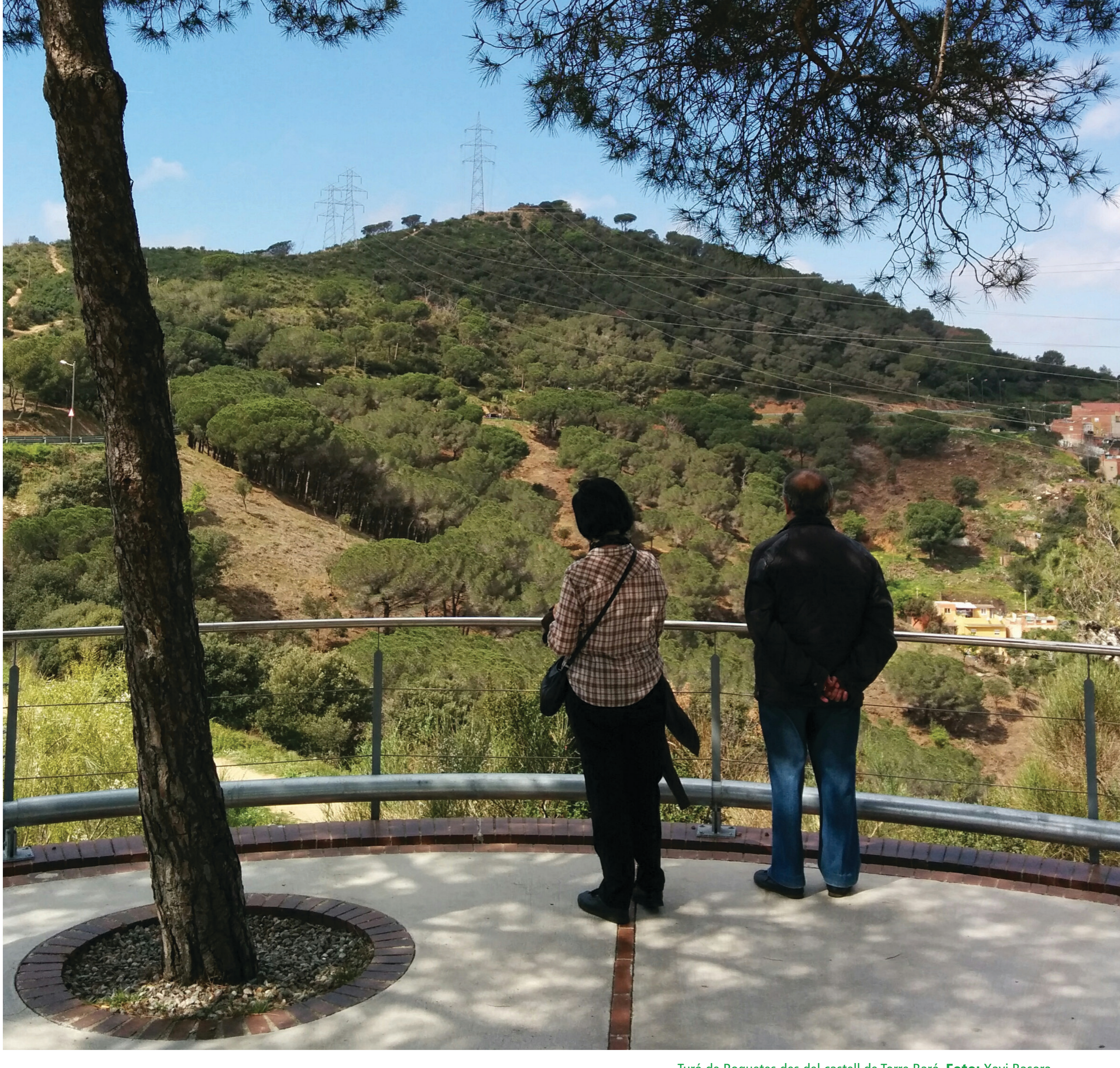
Turó de Roquetes des del castell de Torre Baró.