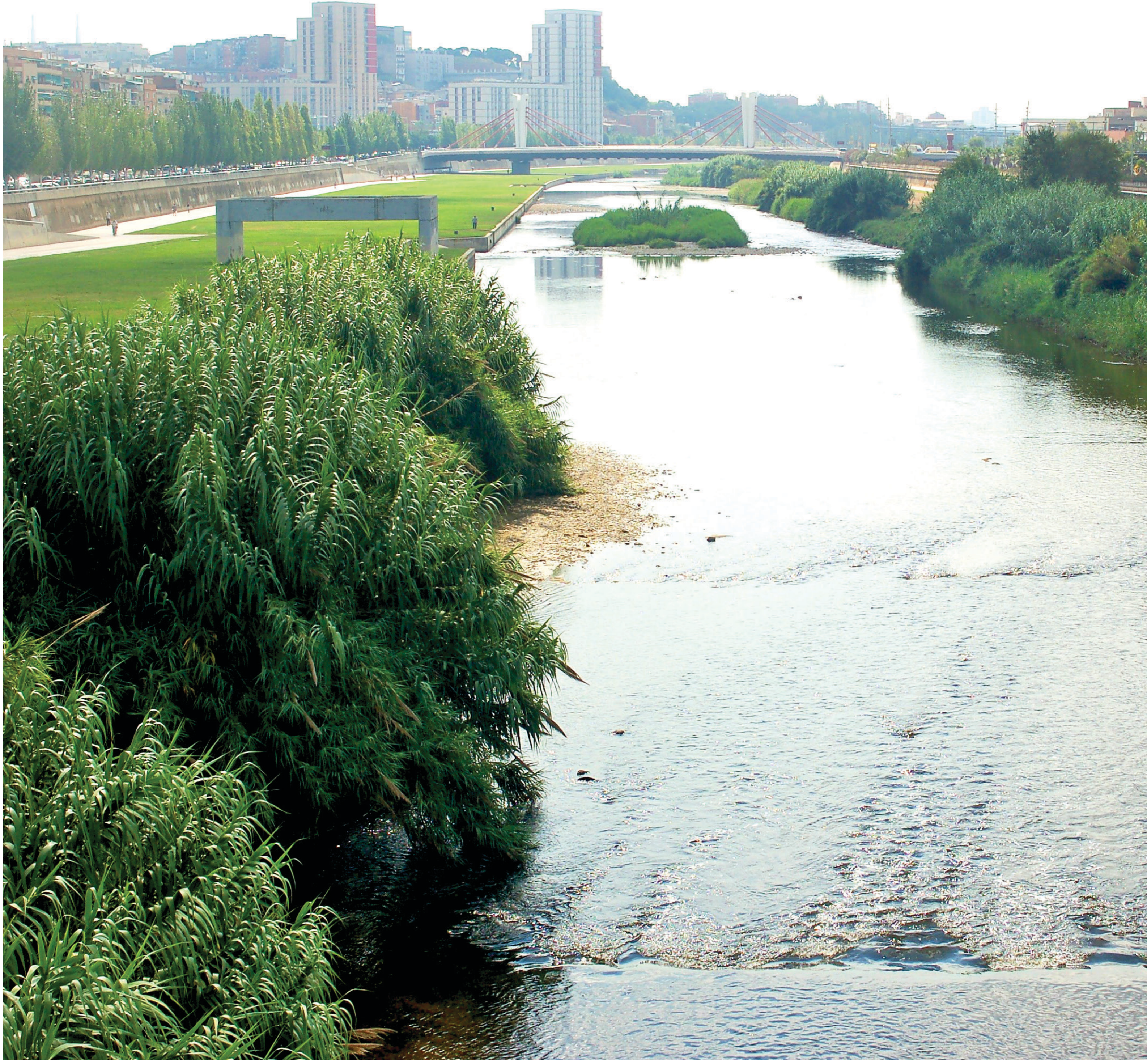
Panoràmica del tram final del riu Besòs.