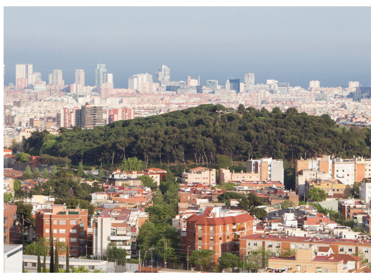
El Parc del Turó de la Peira, una autèntica illa verda.