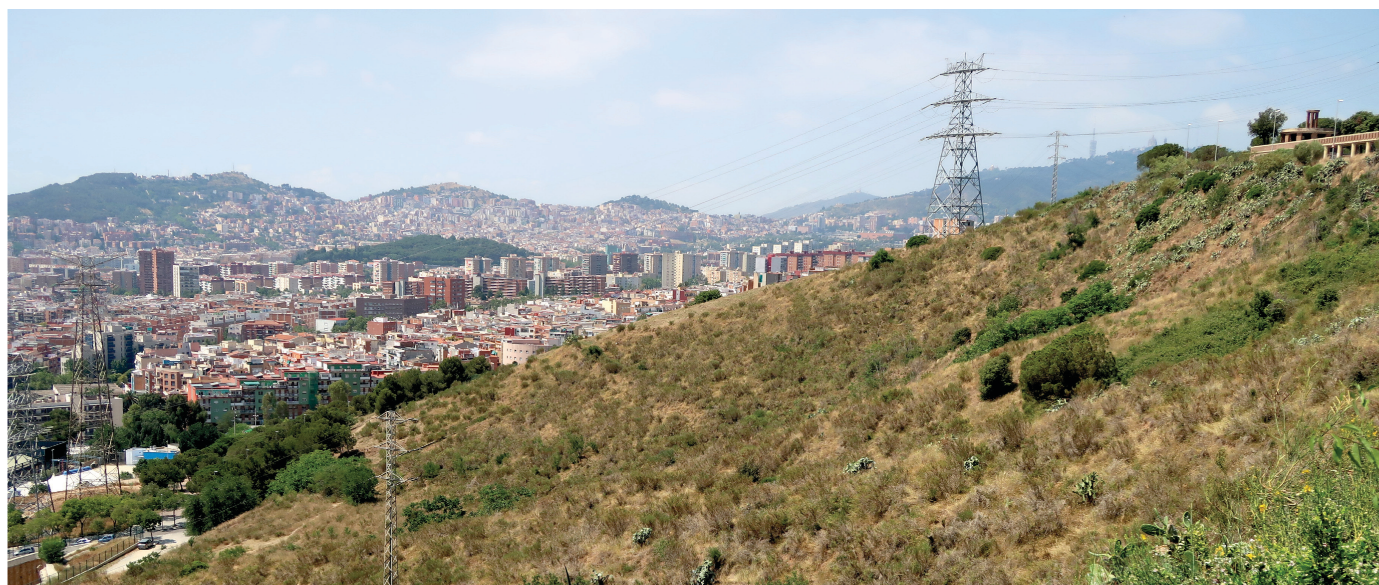
Els prats d'albellatge, capaços de suportar altes temperatures.