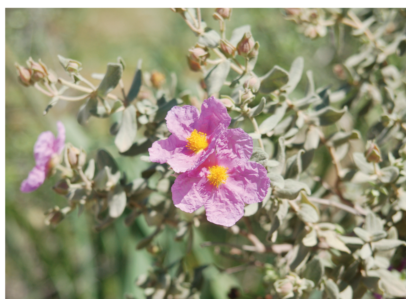
Estepa blanca, un arbust 100% mediterrani.