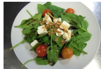
Meal served at Vall d'Hebron University Hospital, Barcelona

Més informació sobre aquest projecte la trobareu aquí