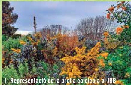
1. Representació de la brolla calcícola al JBB

Presenten poca diversitat florística, amb una o poques espècies dominants; són de vida curta però es regeneren contínuament.