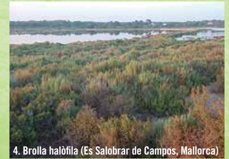
4. Brolla halòfila (Es Salobrar de Campos, Mallorca)

La reproducció de les plantes dels matollars és sobretot sexual. Les llavors acostumen a ser molt fines i es dispersen pel vent o per animals. Poden tenir una llarga latència que evita la germinació massiva, que podria