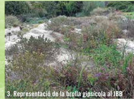
3. Representació de la brolla gipsícola al JBB

• Brolles halòfiles i halonitròfiles , properes a zones litorals o en sòls