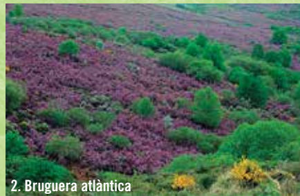
2. Bruguera atlàntica

• Brolles acidòfiles , sobre sòls àcids, en zones més fredes i humides de caràcter litoral atlàntic, amb processos de podsolització que creen sòls com-